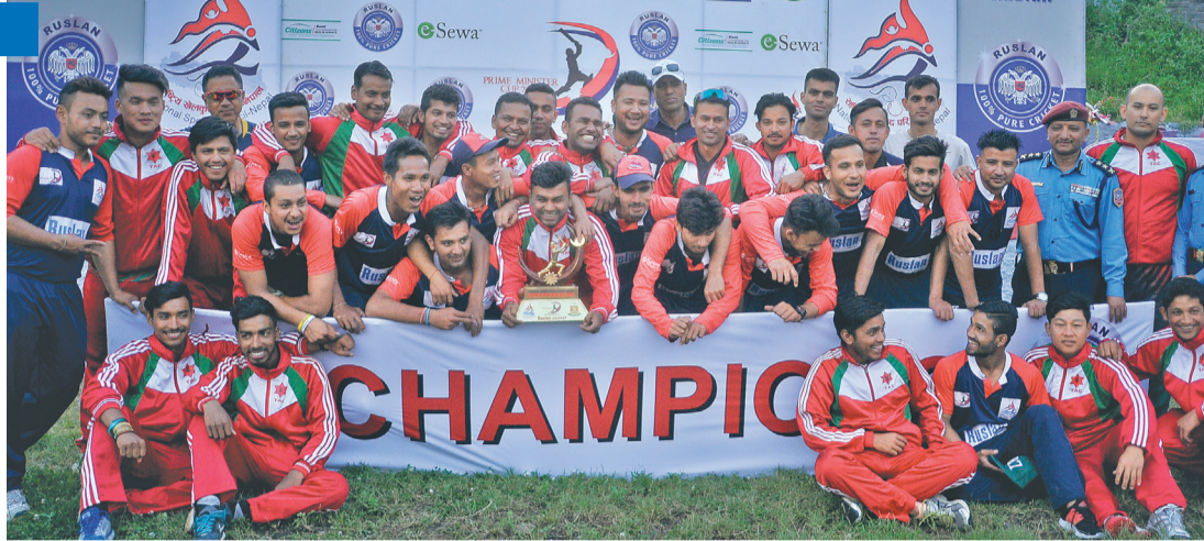
प्रधानमन्त्री कप क्रिकेटको संयुक्त विजेता बनेपछि टुफीसाथ आर्मी र पुलिसका खेलाडी ।

काठमाडौं- वर्षाले फाइनल खेल पूरा हुन नदिएपछि विभुवन आर्मी र नेपाल पुलिस क्लब प्रधानमन्त्री कप राष्ट्रिय क्रिकेट प्रतियोगिताको संयुक्त विजेता बनेका छन् । विहीवारको यस नतिजापछि नेपालको सर्वाधिक धनराशि पुरस्कारको प्रतियोगिताको रकम पनि दुवै टोलीले बाँडेका छन् । विजेताले २० लाख र उपविजेताले १० लाख रूपैयाँ पाउने प्रावधान थियो । संयुक्त विजेता भएपछि दुवैले समान १५ लाख पाए । कीर्तिपुरस्थित त्रिवि मैदानमा भएको फाइनलमा टस हारेर ब्याटिङ गरेको पुलिस ४५.१ ओभरमा १ सय २६ रनमै अलआउट भयो । आर्मीले २.३ ओभरमा १ विकेट गुमाई ७ रन बनाएको स्थितिमा खेल बर्षाले विथोलिएपछि फेरि सुरु हुन सकेन ।