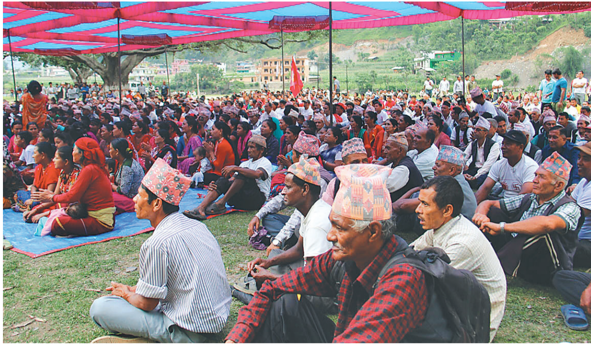
गुल्मीको सुसिकोट नगरपालिकामा बिहीबार एमालेले आयोजना गरेको चुनावी सभाका सहभागी।

नगर क्षेत्रमा नयाँ शक्ति र संघीय समाजवादी फोरम एउटै चिह्न लिएर चुनावमा जाने देखिएको छ। माओवादी केन्द्रले पार्टी क्षेत्र नम्बर ४ का