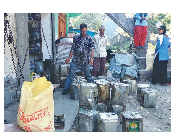
बैतडीको डिलासैनी २ गन्ना बजारमा घिउ संकलनले जाँचपछि निर्यातका लागि तयारी गर्दै। यहाँको घिउ भारतको हल्द्वानीसम्म जाने गरेको छ।