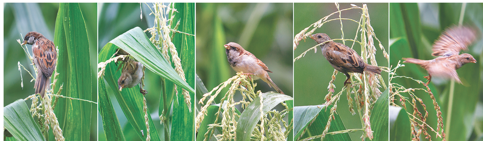
राजधानीको डिल्लीबजारमा विहीवार मकैबारीमा मकैको धान खाँदै भँगेरा चरा ।