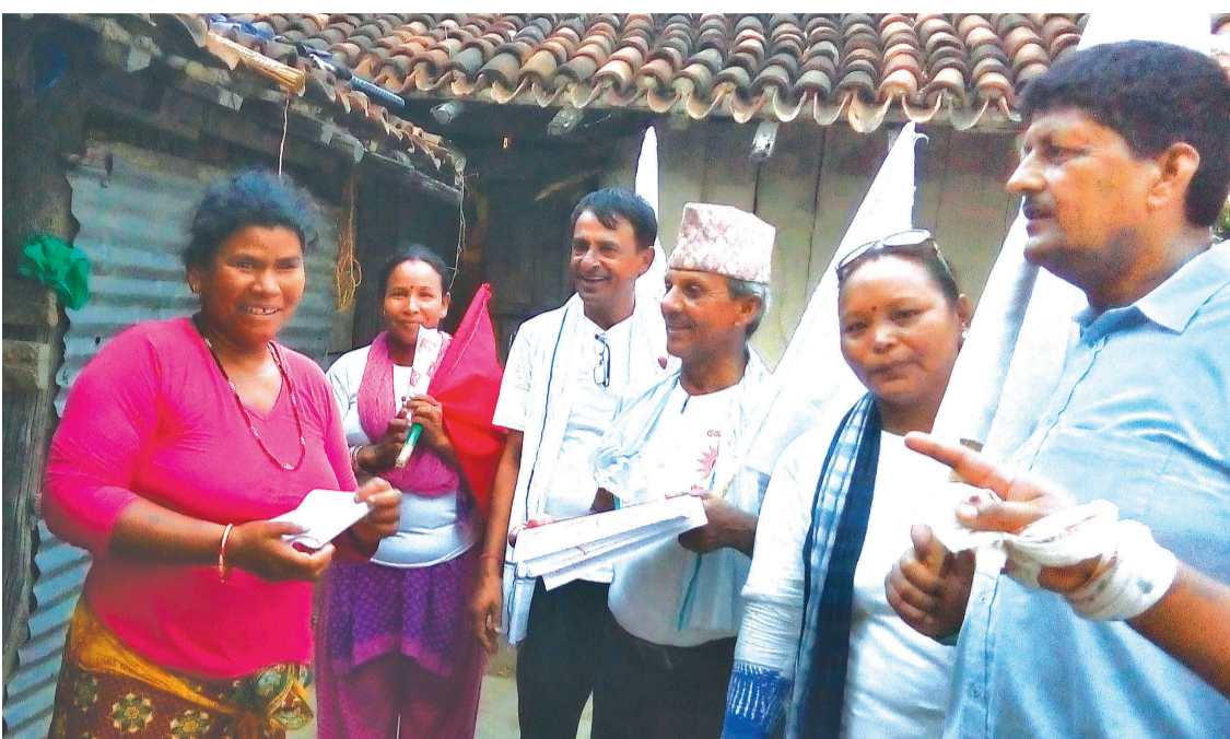
कपिलवस्तुको बाणगंगा नगरपालिका-१ वैरियामा चुनाव प्रसार गर्दै एमाले कार्यकर्ता।