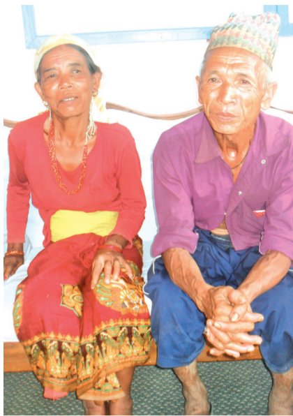
छिमेकीले भुक्त्याएर जग्गा पास गरेपछि उजुरी गर्न गोरखास्थित जिल्ला प्रशासन कार्यालय आएका कुमाल पत्नी।