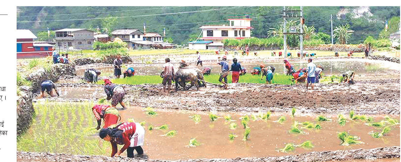
लमजुङको मर्याङ्डी गाउँपालिका ५, धेर्मुफाँटमा धान रोपाईं स्थानीय किसान।