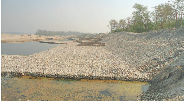
बबईको राजापुरस्थित कर्णाली नदीमा निर्माणधीन तटबन्ध ।