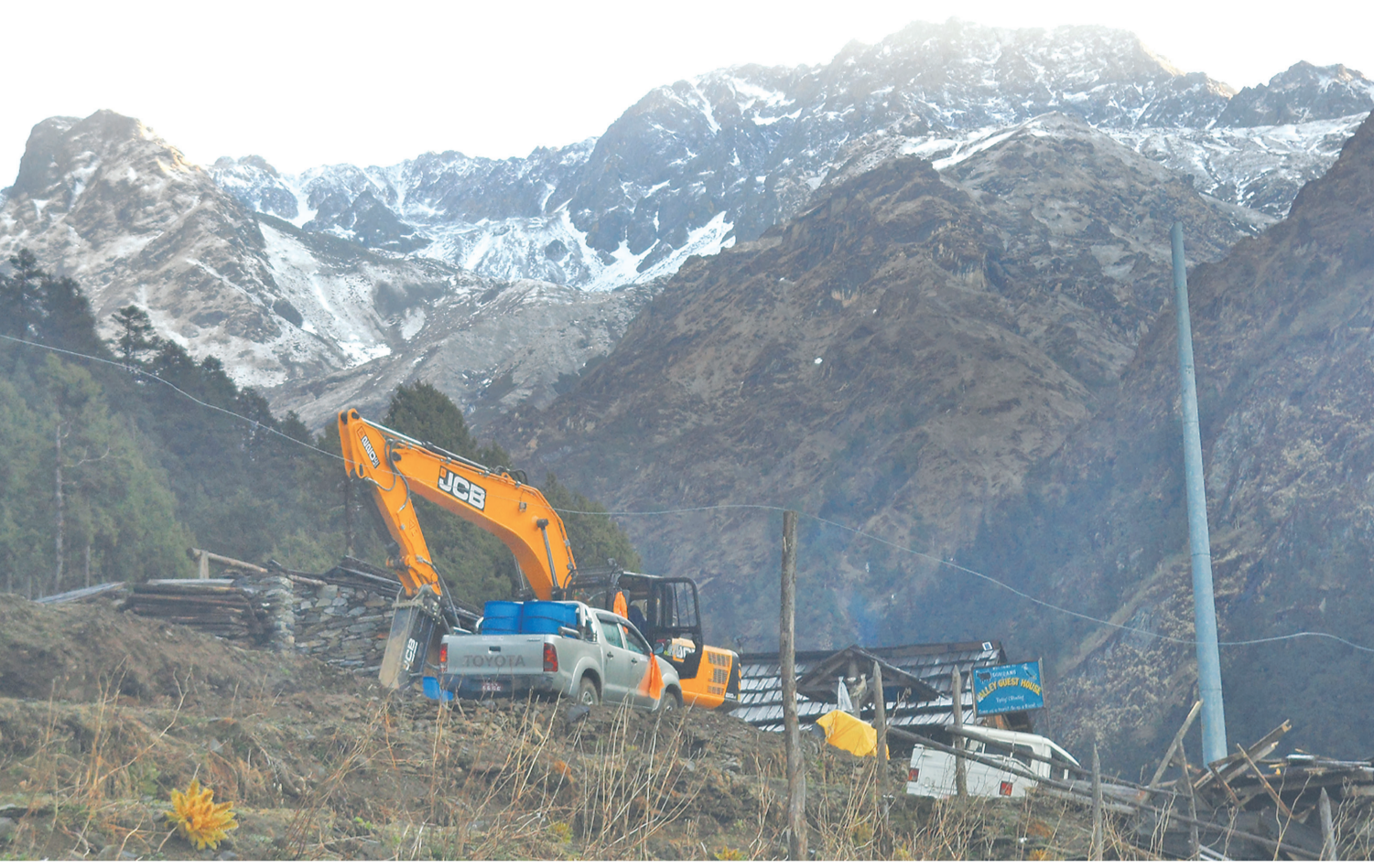
घाडिङको सोमदाङ-तिब्बिड सडक निर्माणका क्रममा पुगेको डोजर । यहाँ अत्यधिक चिसो हुने भएकाले दैनिक ६ घण्टा मात्रै काम हुने गरेको छ ।