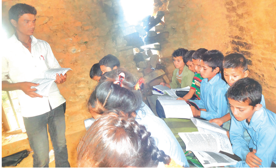
जीर्ण विद्यालय भवनमा पढ्दै विद्यार्थी।