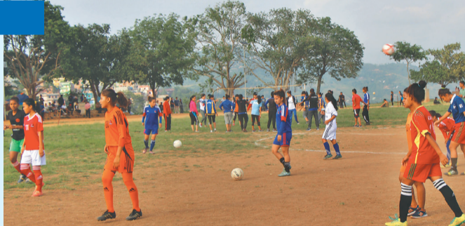
शुक्रवार हुने फाइनलको तयारीमा ताप्लेजुड र रौतहटका खेलाडी । तिरिच : माधव/कान्तिपुर

रौतहट कमजोर टिम होइन । विजेताको ३ लाख र उपविजेताको डेढ लाख पुरस्कारका लागि हुने एन्फा राष्ट्रिय महिला लिग फुटबलको फाइनल रोचक हुने अपेक्षा छ । रौतहटलाई जसरी पनि जित्ने योजना बुन्दै छ ताप्लेजुड । टिम प्रशिक्षक देवकुमार लिम्बू रौतहटलाई जित्ने रणनीतिक तयारी भइसकेको बताउँछन् । 'हरेकपल्ट रौतहटसँग पराजित