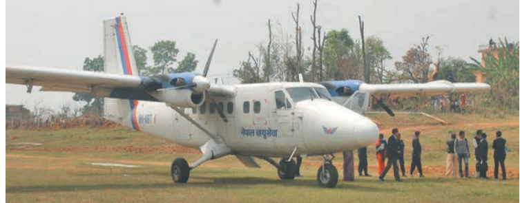
बागलुङको बलेवास्थित विमानस्थलमा बिहीबार अवतरण गरेको नेपाल एयरलाइन्सको जहाज।

पोखरापछि बढी पानी पर्ने स्थान भएको र रातो माटोको मैदान भएकोले चिपिने जोखिमबारे उनले औत्प्रेयाका थिए। निर्यामित जहाज सञ्चालनको लागि भनेर आगामी वर्ष भने नेपाल नागरिक उड्डयन प्राधिकरणले धावनमार्गलाई पक्की