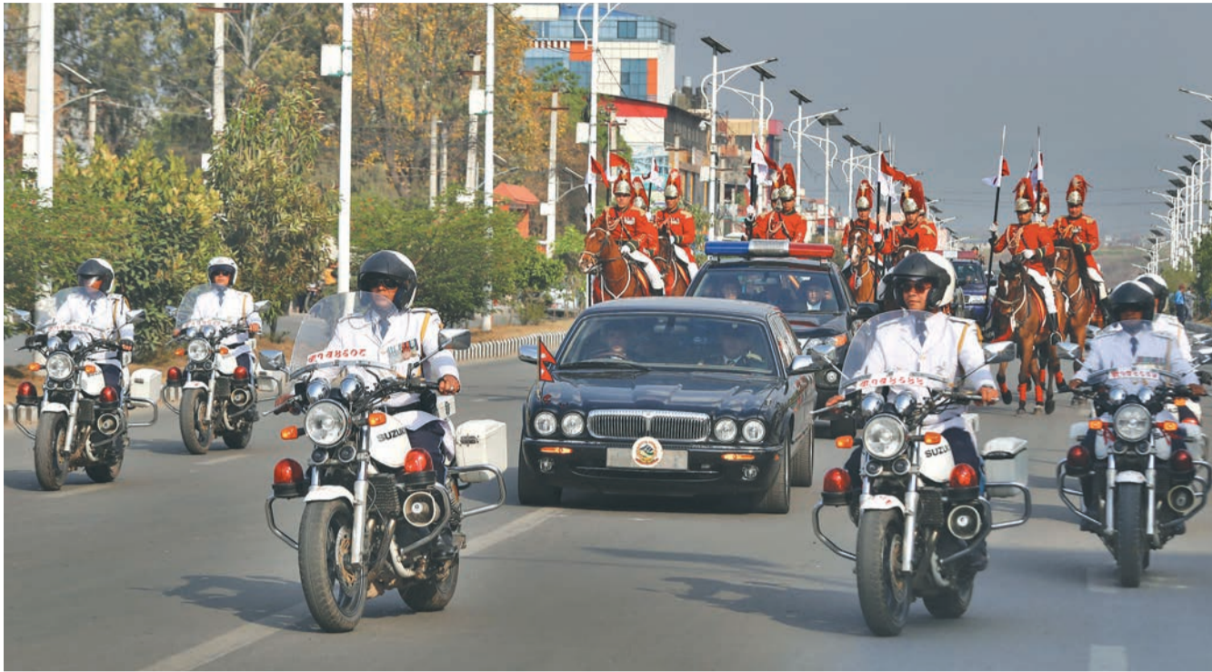
संघीय संसदको पहिलो संयुक्त बैठकलाई सम्बोधन गर्न बिहीबार नयाँ बानेश्वरस्थित संसद भवन जाँदै राष्ट्रपति विद्यादेवी भण्डारी। रिसल्ला र कारोडसहितको सवारीले राजधानीको सडक घण्टी अस्तव्यस्त बनेको थियो।

समाजशास्त्री भन्छन्- सत्तासीनहरू अरुको दुःख देख्दैनन्, सवारीमार्फत शक्ति प्रदर्शन सामन्ती चरित्रकै पुनरावृत्ति हो