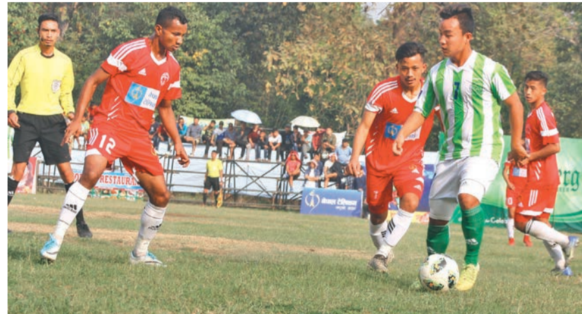
बटवलको मानवज्ञान माविको मैदानमा बिहीवार भिड्दै नेपाल पुलिस र मनाङ्क खेलाडी ।

बटवल- मनाङ्क मर्याङ्गी क्लब बटवलमा जारी तेस्रो मदन भण्डारी गोल्डकप फुटबल प्रतियोगिताको सेमिफाइनल पुगेको छ।