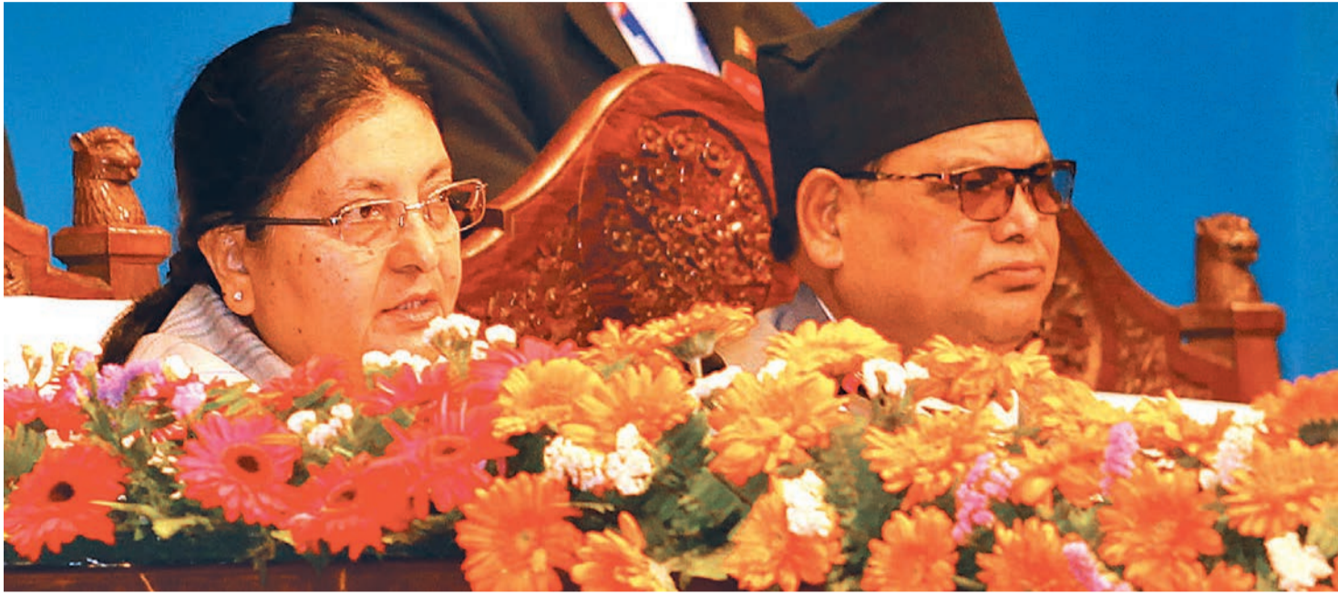
संघीय संसद्को संयुक्त बैठकलाई विहीवार सम्बोधन गर्दै राष्ट्रपति विद्यादेवी भण्डारी। साथमा सभामुख कृष्णबहादुर महरा।