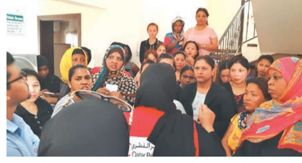
५ महिनादेखि तलब र घर फिर्न नपाएका नेपालीसहित विदेशी महिला कामदारलाई खाद्यान्न वितरण गर्दै कतार रेडक्रिसेन्टका अधिकारीहरू।