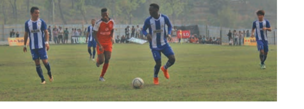
चौथो कटारी मेयर गोल्डकपमा बिहीवार संकटा (नीलो) र गोर्खा ब्याडजका खेलाडी बल नियन्त्रण लिनै दाउमा ।

उदयपुर (कास)- चौथो कटारी मेयर गोल्डकप फुटबलमा बिहीवार गोर्खा ब्याडज रूपन्देहीलाई ३-० ले पराजित गर्दै संकटा क्लब काठमाडौं फाइनल पुगेको छ।