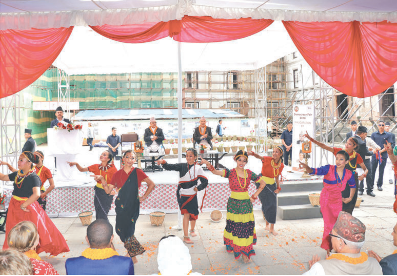
काठमाडौंको वसन्तपुरमा विहीवारदेखि सुरु लोकतन्त्र मेलाको उद्घाटनमा नृत्य प्रस्तुत गर्ने कलाकार । समारोहमा सभामुख कृष्णबहादुर महरा, राष्ट्रियसभा अध्यक्ष गणेश तिमिल्सिनालागतको उपस्थिति थियो ।