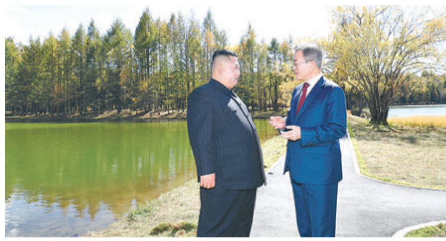
दक्षिण कोरियाली राष्ट्रपति मून जाय-इन (दायाँ) उत्तर कोरियाली नेता किम जोङ-उनसँग कुराकानी गर्दै । मून तीन दिन भ्रमण सकेर विहीबार सोल फर्केका छन् ।

वासिङ्टन (रोयटर्स/एएफपी)- अमेरिकाले कोरियाली द्वीपमा परमाणु निःशस्त्रीकरणका लागि पुनः उत्तर कोरियासँग वार्ता गर्न तयार रहेको जनाएको छ । विदेशमन्त्री माइक पोम्पियोले 'उत्तर कोरियालाई सन् २०२१ भित्र पूर्णरूपमा परमाणु अस्त्रविहीन बनाउन पुनः वार्ता गर्न तयार रहेको' विहीबार बताएका हुन् । अमेरिका र उत्तर कोरियाबीचगत जुन १२ मा सिंगापुरमा शिखर बैठक भएको थियो । उक्त वार्ताका क्रममा दुई पक्षबीच परमाणु निःशस्त्रीकरण लगायत विषयमा सहमति भएको थियो । यद्यपि, उक्त कार्यका लागि ठोस कदम भने चालिएको छैन । तर यसै साता भएको दुई कोरियाली शिखर बैठकपछि परमाणु निःशस्त्रीकरणको मुद्दामा थप कदम चालिने संकेत देखिएको छ । दक्षिण कोरियाली राष्ट्रपति मून जाय-इनसँग उत्तर कोरियाली नेता किम जोङ-उनले आफ्नो मुख्य क्षेत्राधिकार प्रक्षेपण केन्द्र बन्द गर्न सहमत भएका थिए । शिखर बैठकका पहिलो पटक प्योङयाङ पुगेका मूनले दसौं हजार उत्तर कोरियालीको माफमा अभूतपूर्व भाषण गरेका थिए । उक्त अवसरमा मूनले भनेका थिए, 'परमाणु निःशस्त्रीकरणका लागि नेता किम सहमत छन् ।' अमेरिकी विदेशमन्त्री पोम्पियोले किमको महत्त्वपूर्ण प्रतिवद्धताका