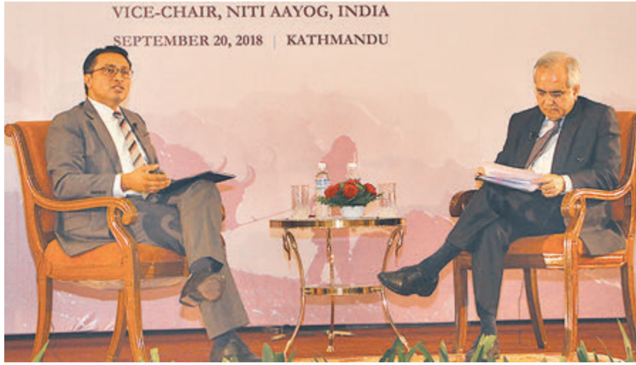
राजधानीमा बिहीबार काठमाडौं विधुत्वविद्यालय र बारवारा फाउन्डेसनले संयुक्त आयोजना गरेको नेपाल, भारत र छिमेकी सम्बन्ध तथा आर्थिक सुधारबारे भएको सांजनिक छलफलमा भारतीय नीति आयोगका उपाध्यक्ष राजीव कुमार (दायाँ) र राष्ट्रिय योजना आयोगका पूर्वउपाध्यक्ष स्वर्णिम वाग्ले।

बिहीबार काठमाडौंमा आयोजित एक कार्यक्रममा उनले यस्तो बताएका हुन्। 'रक्सौल काठमाडौं रेलमार्गका लागि वास्तवमै काम भएको छ,' उनले भने, 'काम तीव्र रूपमा अघि बढेकाले निर्धारित समयमै निर्माण पूरा हुन्छ।' यो रेलमार्गले काठमाडौंलाई भारतसँग जोड्ने भएकाले यसको महत्त्व धेरै हुने उनले बताए। 'रेलमार्ग निर्माणलाई भारतले निकै महत्त्व दिएको छ,' उनले थपे। यसअघि भारतीय प्रधानमन्त्री नरेन्द्र मोदीले एक वर्षअघि रक्सौल-काठमाडौंको डीपीआर निर्माण गर्न निर्देशन दिएका थिए। दुई साताअघि काठमाडौंमा सम्पन्न बहुपक्षीय प्राविधिक तथा आर्थिक सहयोगका लागि बंगाल खाडीकाको प्रयास (विमस्टेक) सम्मेलनमा नेपाल आएको समयमा भारतीय प्रधानमन्त्री मोदीले उक्त निर्देशन दिएका थिए। उक्त समयमा यो विषयमा भारतीय प्रधानमन्त्री मोदी र नेपालका प्रधानमन्त्री केपी शर्मा ओलीको उपास्थित्यतामा दुई देशबीच समझदारी पत्रमा हस्ताक्षर (एमओयू) भएको थियो। सम्झौताअनुसार रक्सौल-काठमाडौं विद्युतीय रेलमार्गको प्रारम्भिक प्राविधिक सम्भाव्यता अध्ययन (प्राइमिनिरी इन्जिनियरिङ एन्ड ट्राफिक सर्वे) भारतले गरिदिनेछ।