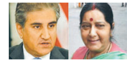
साह मोहम्मद कुरेसी र सुषमा स्वराज