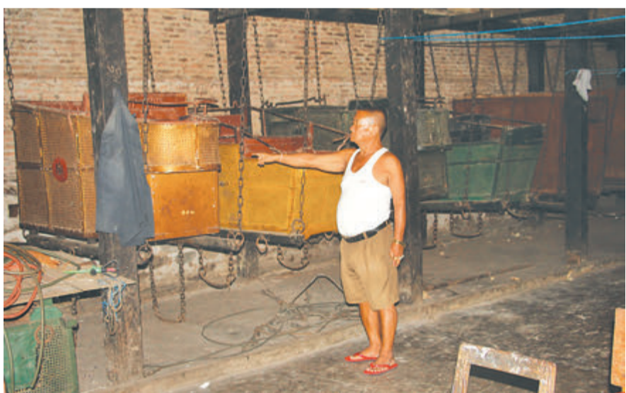
मकवानपुरको भीमफेदीस्थित हात्तीसारको संग्रहालयमा रहेको उपयोगविहीन अवस्थाका हौदा देखाउँदै । प्रयोगमा नआएको यसलाई माक्रुराको जालोले ढाकेको छ ।

त्रिभुवन राजपथ निर्माण हुनुभन्दा अघि उपत्यकाको एक मात्र प्रवेशद्वार भीमफेदीको चहलपहल यामिनसकन् थियो । तराईमा सिकार खेलन जाने होस् वा तराईबाट राजधानी आउजाउ गर्ने पैदल यात्रुहरूको बासस्थान थियो भीमफेदी । राणाकालमा बेलायती राजारानीसंगै विदेशी पाहुना हात्तीमा बसेर सिकार खेल्नका निम्ति पनि भीमफेदी नै आउथे । वित्तमा पैदल यात्रुहरूका निम्ति बास बस्न बनाइएका पाटीपौवा र निजी भवनहरू जीर्ण अवस्थामा पुगेका छन् । त्यसैगरी विदेशी पाहुनाहरू सिकार खेलेका हात्तीका हौदाहरूलाई माक्रुराको जालोले ढाकेको छ ।