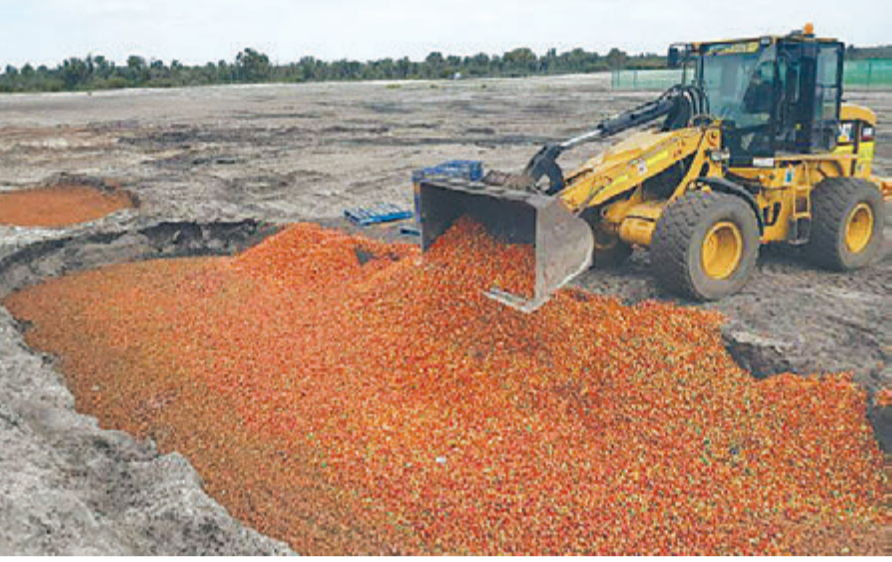
अस्ट्रेलियामा उत्पादित स्ट्रबेरीमा सियो भेटिएपछि नष्ट गरिँदै ।