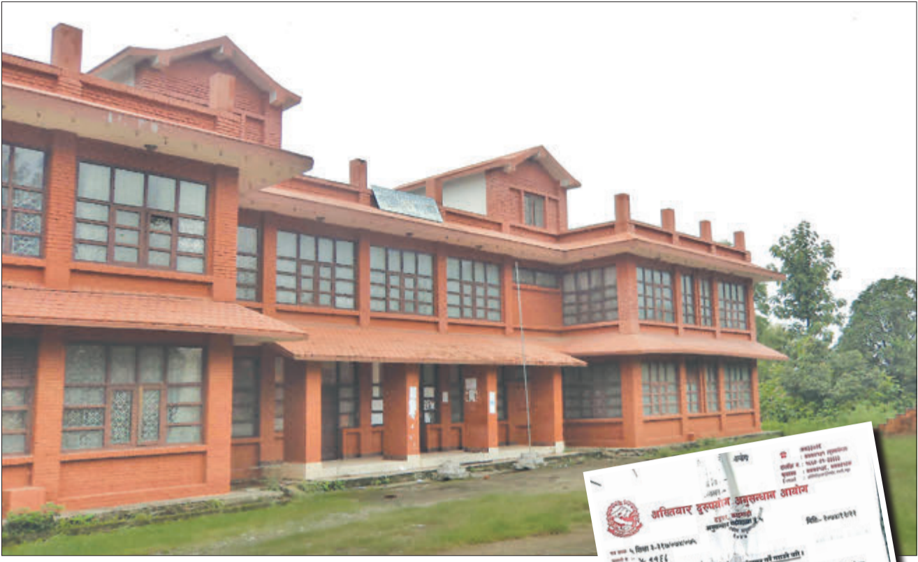
दाङको बेलभुङ्डीस्थित नेपाल संस्कृत विश्वविद्यालयको केन्द्रीय कार्यालय (माथि)। अख्तियारले विश्वविद्यालयलाई लेखेको पत्र।