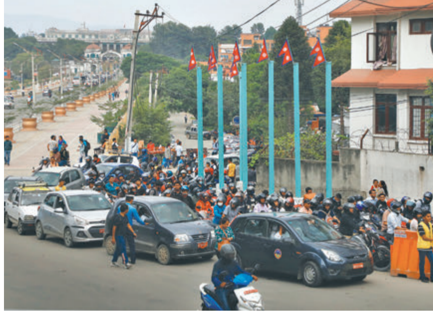
इन्धन दुबानी चालकको हडतालका कारण राजधानीमा पेट्रोलियम पदार्थ सुलभ नहुँदा बिहीबार भद्रकालीस्थित नेपाली सेनाको पेट्रोल पम्पमा इन्धन भर्न लाइन लगेका सवारी साधन ।