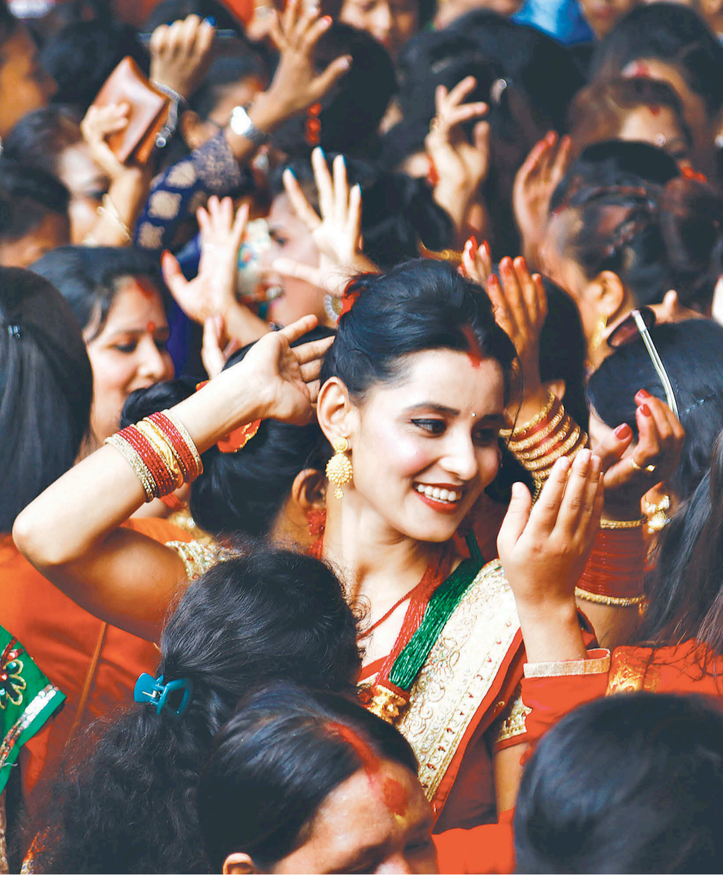
काठमाडौंको वसन्तपुरमा सोमबार नाचगान गरेर तीज मनाउँदै महिला।