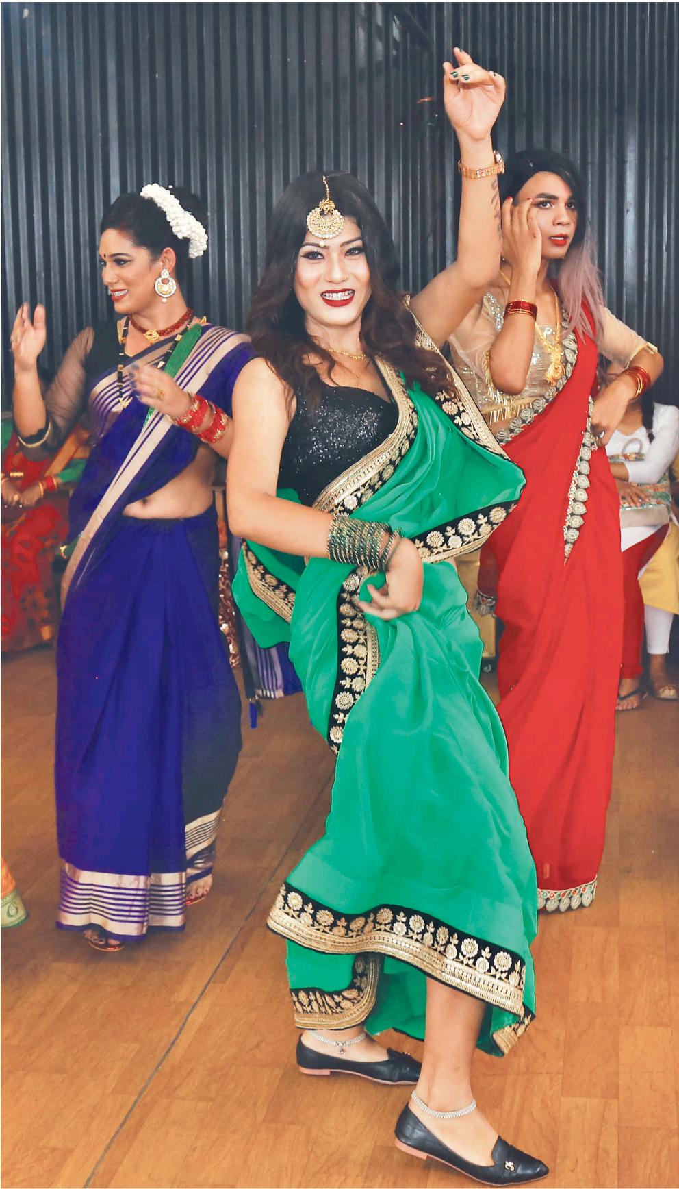
यौनिक तथा लैंगिक अल्पसंख्यकको महासंघ नेपाल, नीलहीरा समाज र कुण्डस नेपालले काठमाडौँमा गरेको तीन कार्यक्रममा नाच्दै समितिी तसविगी समुदाय ।