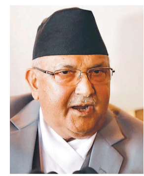
शान्तिपुर अस्पतालमा उपचारमा सहभागी भएका प्रधानमन्त्रीको स्वास्थ्यमा गडबडी देखिएको थियो।