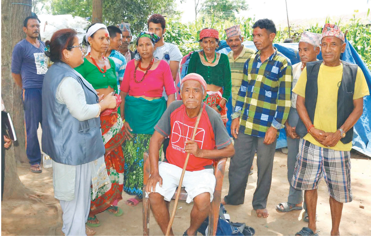
कर्णाली प्रदेश सभा सदस्यलाई पीडा सुनाउँदै वीरेन्द्रनगरस्थित महिला प्रशिक्षण केन्द्रका बाढीपीडित ।