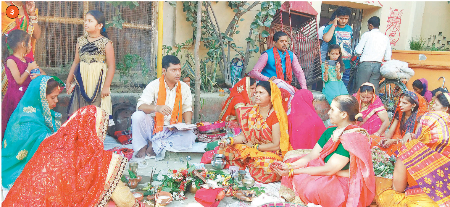
१. तीजको अवसरमा जनकपुरको रामचोकमा गणेश युवा कमिटीले आयोजना गरेको सांस्कृतिक कार्यक्रममा नाचगान गर्दै ब्रतालु। २. महोत्सवीको गौशाला ९ मा चौठचन्द्रको पूजा गर्दै ब्रतालुका साथ एक गृहिणी। ३. जनकपुरमा हरितालिका तीज ब्रतको कथा सुन्ने ब्रतालु।