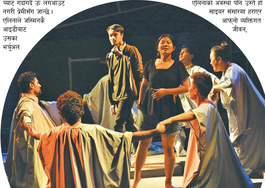
'गुम्फन' नाटकमा अभिनय गर्दै कलाकार।