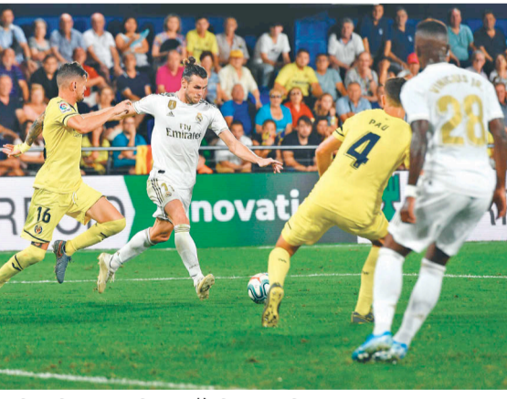
भिल्लारियलविरूद्ध बलअधि बढाउँदै रियल म्याड्रिडका बेल ।

म्याड्रिड (एएफपी)- गेराय बेलले दुई गोल गर्दै आइतबार स्पेनी ला लिगामा रियल म्याड्रिडलाई टाइटबाट जोषाएका छन् । त्यसको त्यस प्रदर्शनको मद्दतले रियलले भिल्लारियललाई २-२ को बराबरीमा रोकेको । तर इन्च्युरी समयमा बेल दोहोरो पहिलो काडँ खाएर मैदान छाड्न पनि बाध्य रहे । सिजनको सुरुमा बेलले रियल छोडे सवैलाई राम्रो हुने बताएका थिए । उनकै प्रदर्शनको मद्दतले रियल रोमाञ्चक बराबरीको नतिजा निकाल्न सफल रह्यो । भिल्लारियलले जेराई मोरेनोको गोलले १-२ को मिनेटमा पहिलो गोल गरे । खेल सकिँदा १६ मिनेट अगाडि मोड गोमेजेले दोस्रो गोल थपे । त्यसयता बेलले मध्यान्तर अर्धअर्ध एक गोल गरे भने खेल सकिँने चार मिनेट अगाडि बराबरी गोल गरे । दुई मिनेटको अन्तरमा दुई पहिलो काडँ