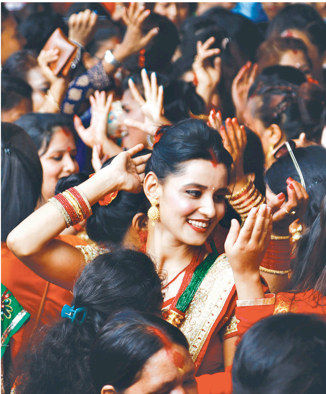
काठमाडौंको वसन्तपुरमा सोमबार नाचगान गरेर तीज मनाउँदै महिला ।