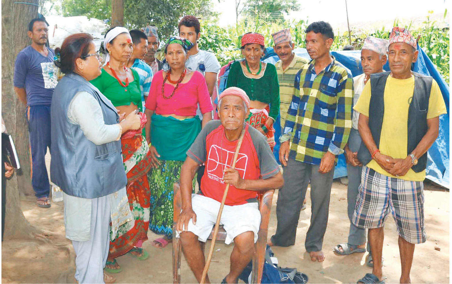
कर्णाली प्रदेश सभा सदस्यलाई पीडा सुनाउँदै वीरेन्द्रनगरस्थित महिला प्रशिक्षण केन्द्रका बाढीपीडित।

करिव २ हजार २ सय परिवार विस्थापित बने। 'पालको बसाइँले छोरेले विरामी भएर ज्यान गुमायो,' देउरुपाले भनिन्, 'सरकार फेरिए, हाप्पा पाल भने अर्कैसम्म फेरिएनन्।' भेरी किनारामा गिट्टी कुट्टे आए पनि विक्री नहुँदा थप सास्ती भएको उनले बताइन्। शिविरमा दैनिकजसो बालबालिका र वृद्ध विरामी भइरहन्छन्।