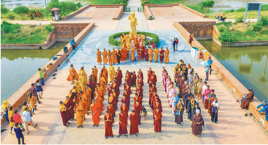
लुम्बिनीस्थित बेबी बुद्धमा प्रार्थना गर्दै विभिन्न मुलुकका पर्यटक ।