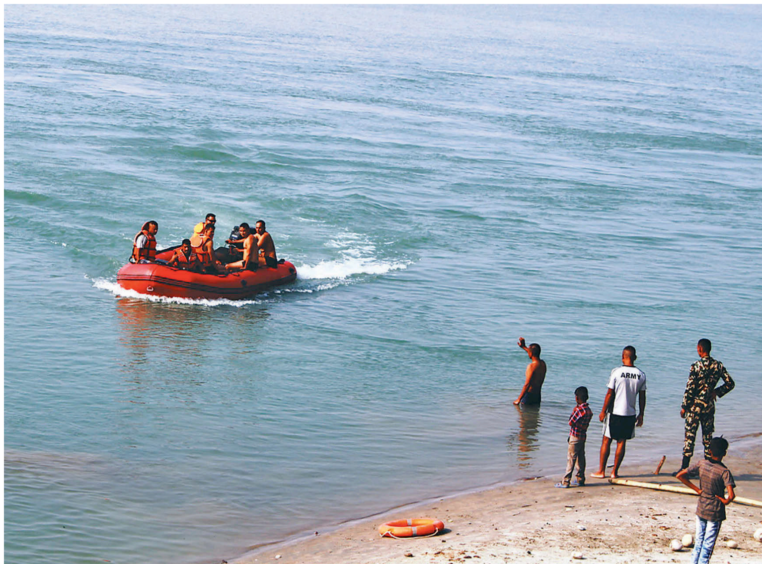
कञ्चनपुरको महाकाली नदीमा मोटरबोट चलाउने अभ्यास गर्दै नेपाली सेनाका जवान।

मासुको मूल्य यथावत जिल्लामा कुखुराको उत्पादन अत्यधिक भएर बिक्री नहुने अवस्था आए पनि मासुको मूल्य भने घटेको छैन। अहिले जिउंदो कुखुरा प्रतिकिलो २ सय ५० र तयारी मासु ४ सय ५० मा बिक्री हुँदै आएको छ।