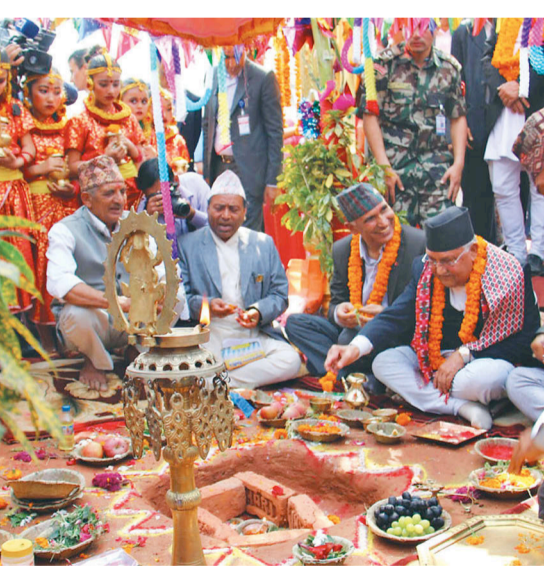
बुटवल-नारायणगढ सडक विस्तारको शिलान्यास गर्दै प्रधानमन्त्री केपी शर्मा ओली ।