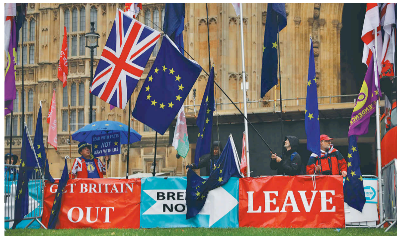
बेलायतको राजधानी लन्डनस्थित संसद् भवनअगाडि ब्रेक्जिटको विरोधमा गरिएको प्रदर्शन।