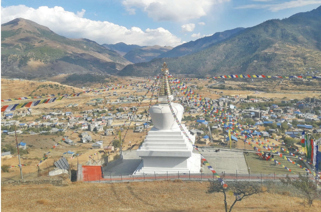
जुम्ला खलगास्थित सिंगापुर गाउँमा रहेको डुडुल बौद्धस्तूप ।