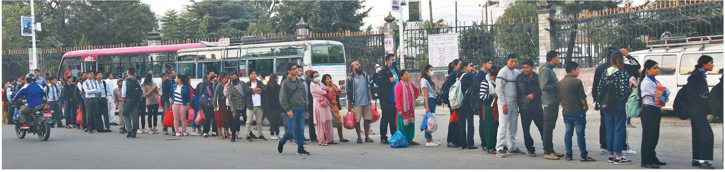
रत्नपार्कदेखि बानियाँटार चल्ने माइक्रोबस चढ्न लामबद्ध यात्रुहरू । उक्त रुटमा कान्तिपुर टिमले रिपोर्टिङ गर्दा १२ सिटको माइक्रोमा ३२ जनासम्म चढेको पाइयो ।

कोचाकोच यात्रु चढेपछि भित्र सास फेर्ने गाह्रो हुनेगरी उकुसमुकुस थियो । उभिने केही त खलखली पसिना निकालिरहेका देखिन्थे ।