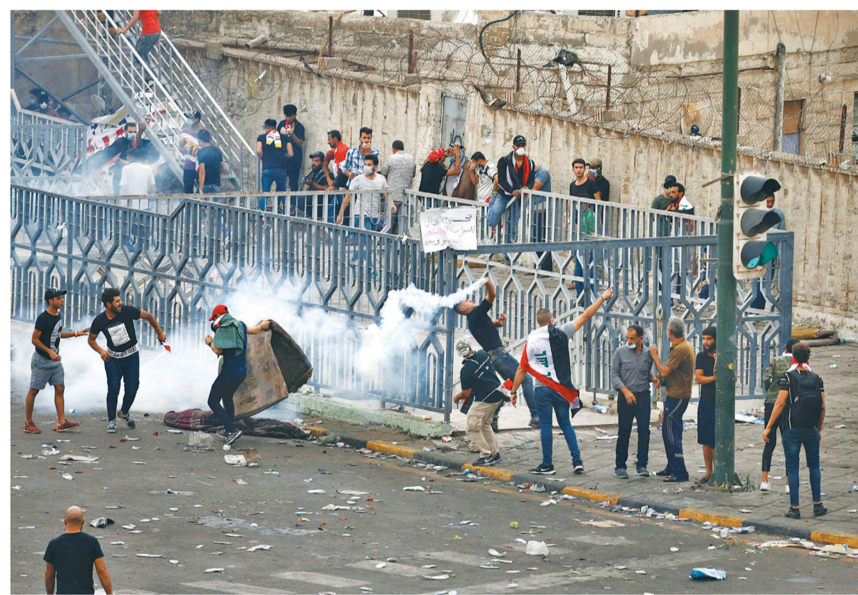
रोजगारीको माग गर्दै इराकको राजधानी बगदादमा शुकुबार गरिएको प्रदर्शन।

बगदाद (एजेन्सी)- इराकको राजधानी बगदादमा शुकुबार गरिएको प्रदर्शनमा प्रहरीले हस्तक्षेप गर्दा कम्तीमा २ जनाको मृत्यु भएको छ। रोजगार तथा सार्वजनिक सेवा सुधारको माग गर्दै बगदादमा केही दिन यता निर्भय प्रदर्शन गरिँदै आएको छ। प्रदर्शनकारीलाई भगाउन प्रहरीले शुकुबार अश्रुग्यास तथा रबरका गोली हालेको थियो। अन्तर्राष्ट्रिय सञ्चारमाध्यमका अनुसार प्रहरीले हालेको अश्रुग्यासको सेल लागेर २ प्रदर्शनकारीको मृत्यु भएको हो। घटनामा केही घाइते छन्। यसै महिनाको सुरुमा गरिएको यस्तै प्रदर्शनमा गरिएको प्रहरी दमनका कारण कम्तीमा १५० जना घाइते