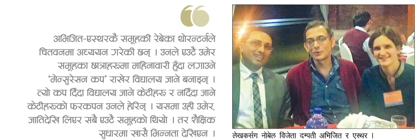
लेखकसँग नोबेल विजेता दम्पती अभिजित र एस्थर।

पहिलो हुने विद्यार्थीलाई सबै प्रोत्साहन र चाकडी गर्ने तर अरुलाई बेवास्ता गर्ने काम हुने गरेको छ। नेपालमा त भन्नु यो समस्याकै विषय छ। निजी विद्यालयहरूले त नजान्ने विद्यार्थीलाई भर्ना नै गर्दैनन्। ग्रेड वान, ग्रेड टु, ग्रेड थ्री भन्ने तहगत व्यवस्था भन्नु वाहिदात हो भने कुरा आयो। यदि दुई कक्षमा पढ्ने विद्यार्थीले पाँच कक्षा पढ्ने जतिकै ज्ञान राख्छ भने पाँच कक्षमा पढाउँने भन्ने तर्क उनीहरूको छ। तहगत व्यवस्था भए पनि विद्यालयवाहिर