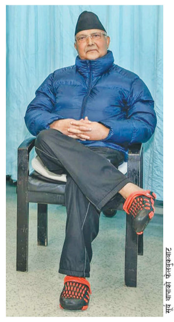
अस्पतालबाटै सरकार र दल चलाउँदै | पृष्ठ ३

जटिल शल्यक्रिया, संक्रमण, शरीरमा फोहोर बढी जम्मा हुनु आदि कारणले प्रधानमन्त्रीको मिर्गौलामा परेको भार घटाउन डायलिसिस गरिरहनुपर्ने चिकित्सकको