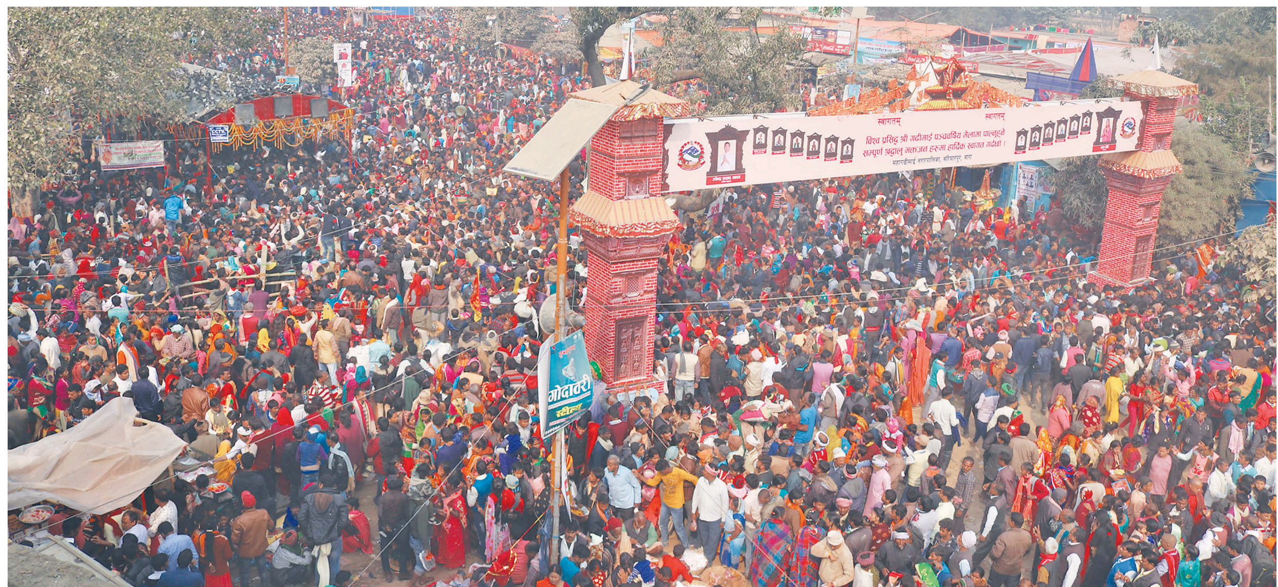
गढीमाई मेलाका दशरथको अवसरमा गढीमाईमा मेला गर्ने श्रद्धालुको घुईचो। मंगलबार यहाँ साढे ८ हजार पशु बलि दिइएको छ। बलिको विरोध भएपछि रंगशालामा तारबार गरेर आगन्तुकलाई भित्र पस्न र हेर्न मेला व्यवस्थापन समितिले रोक लगाएको छ। जबजंती हेर्न खोज्दा भीडमा लडेर ५१ जना घाइते भएका छन्।