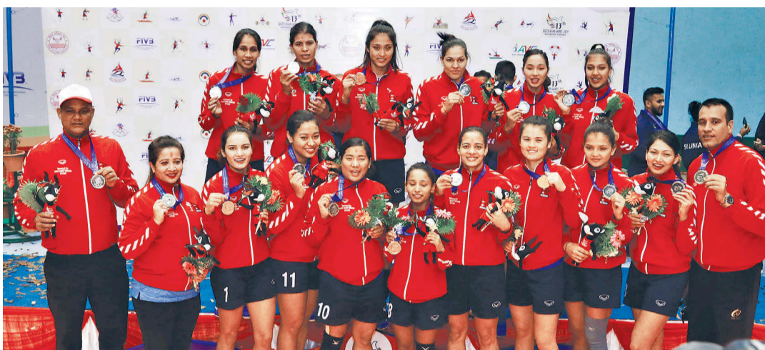
रजत पदकमा चित्त बुझाएको नेपाली महिला भलिबल टिम। मंगलवार फाइनलमा नेपाल भारतसँग पराजित भयो।

'आज हामी जितेको निकै नजिक पुगेर पनि पराजित रहन बाध्य रह्यौं। यसमा मलाई धेरै