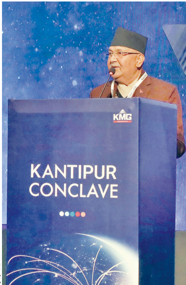
प्रधानमन्त्री केपी शर्मा ओली शुक्रबार कान्तिपुर कन्बलभमा सम्बोधन गर्दै ।

अब तिनले पर्यटन विकासमा पनि टेवा दिनेछन्।’ फन्ड २५ मिनेट लामो सम्बोधनमा ओलीले विगतदेखि नै उठाउँदै आएको रेलको प्रसंग छुट्टाएनन्। नेपालमा रेल ल्याउने कुरालाई निरन्तर जोड दिँदै आएका उनले दुवै छिमेकी मुलुकसँग नेपाल रेलका माध्यमबाट पनि जोडिने र यसले नेपालको यातायात क्षेत्रमा क्रान्ति ल्याउने बताए। त्यसले नेपालको अर्थतन्त्रलाई उकास्ने पनि उनले उल्लेख गरे। ‘रेलमार्गले नेपाललाई भूजडित मुलुक बनाउने छ,’ प्रधानमन्त्री ओलीले भने, ‘यस्ता उत्साही खालका धेरै परिणाम अहिले देखिएका छन्।’ प्रधानमन्त्री ओलीले दुई वर्षअघि नेतृत्व सम्हाल्दै गर्दा जनताले गरेको विश्वासलाई जिम्मेवारीपूर्वक ख्याल गर्दै विकासको यात्रालाई नेतृत्व प्रदान गरेको दावी गरे। ‘मेरो कार्यकालको मध्यांतर आइपुग्दा हामीले मुलुकमा सकारात्मक ऊर्जा सञ्चार गर्न सफल भएका छौं,’ उनले भने, ‘हामीले विकासका लागि राम्रो जग पनि खडा गरेका छौं।’ हाम्रो मुलुकले सही टुट्याक समातेको छ।’ उनले विकासको नमुनाका रूपमा अधि बढेका केही परियोजना उदाहरणका रूपमा पेश गरे। भैरहवा र पोखरा विमानस्थल चाँडै सम्पन्न हुँदैछन्। ती विमानस्थल हवाई कनेक्टिभिटीका लागि ‘गोमचेन्जर’ सपना अहिले कार्यान्वयनमा जान थालेको आशय मुख्य प्रार्थमिकतामा छ। यसले दुईपक्षीय र क्षेत्रीय उर्जा व्यापारको उज्वल भविष्य देखाएको छ। प्रधानमन्त्री ओलीले लामो समयको राजनीतिक संक्रमणकाल पश्चात् पछिल्ला दुई वर्षमा नेपालमा राजनीतिक विषय छोडेर विकास, रोजगार र सार्वजनिक हितवारे बहस हुन थाल्नु सकारात्मक भएको बताए।