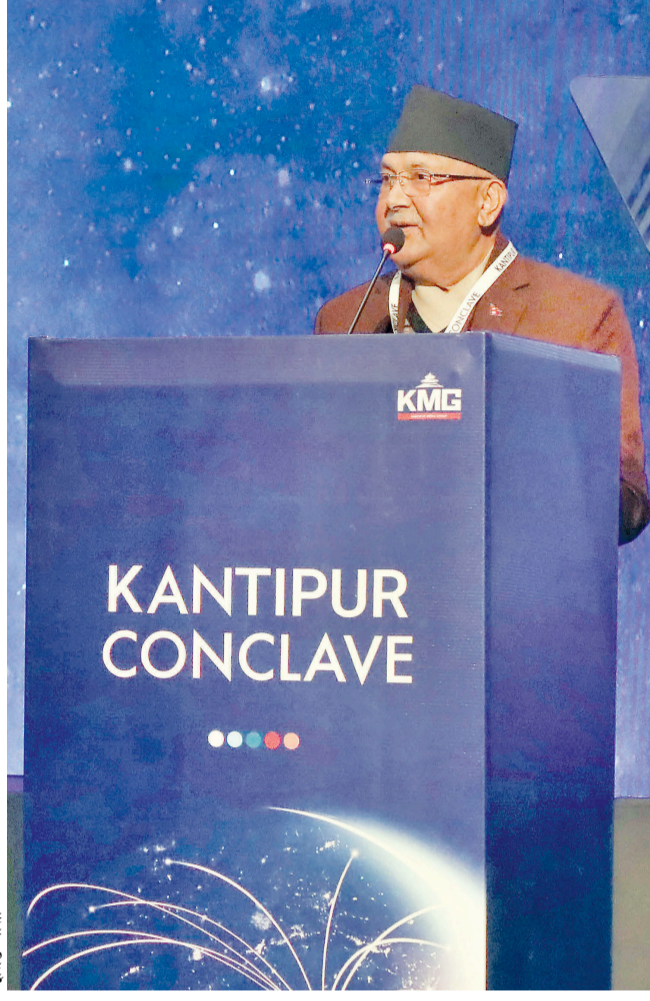
प्रधानमन्त्री केपी शर्मा ओली शुक्रबार कान्तिपुर कन्बलभमा सम्बोधन गर्दै ।

विज्ञ भन्छन्- ‘कनेक्टिभिटीलाई सभ्यता र अवधारणा निर्माणको आधार विन्दुका रूपमा समेत लिनुपर्छ’