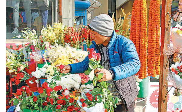
गुलाबका फूल मिलाउँदै ललितपुरको जावलाखेलका व्यवसायी ।