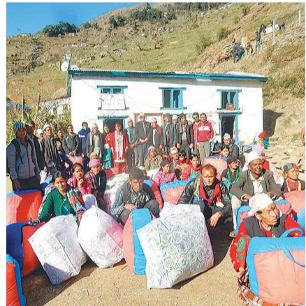
कालीकोटको नरहरिनाथ गाउँपालिकाले वितरण गरेको फाड्बर सिरक पाएका ज्येष्ठ नागरिक र अपांगता भएका व्यक्ति।