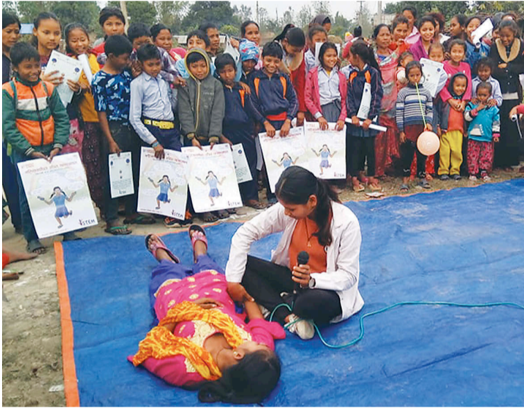
कैलालीको बेलवास्थित राष्ट्रिय माविका विद्यार्थी सुरक्षित गर्भपतनबारे सडक नाटक प्रस्तुत गर्दै ।