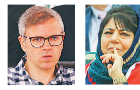
ओमार अब्दुल्लाह मेहबूबा मुफ्ती

खुलाइए पनि कति कश्मीरी जनता सुरक्षा निकायको हिरासतमा छन् भन्नेबारे भने यकिन छैन। भाजपाले भने कश्मीरमा कानून र व्यवस्था कायम गर्न यी सबै कदम आवश्यक रहेको जिकिर गर्दै आइरहेको छ। भारतको संविधानले कश्मीरलाई स्वधी वसोवास, सम्पत्तिको स्वामित्व र आधारभूत अधिकारबारे आफ्नै कानून बनाउने धारा '३७०' मार्फत सुनिश्चित गरेको थियो।