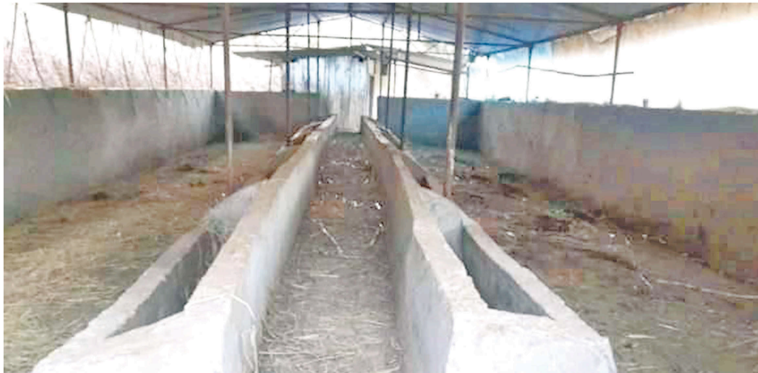
रुकुम पश्चिमको बाँफिकोट गाउँपालिकामा खाली भैसी फार्म।

दुई महिनाअघि गाउँपालिकाले ३ वटा वडामा सामूहिक बाख्रापालन र एउटा वडामा सामूहिक भैसीपालन फार्म सञ्चालनमा ल्याएको थियो