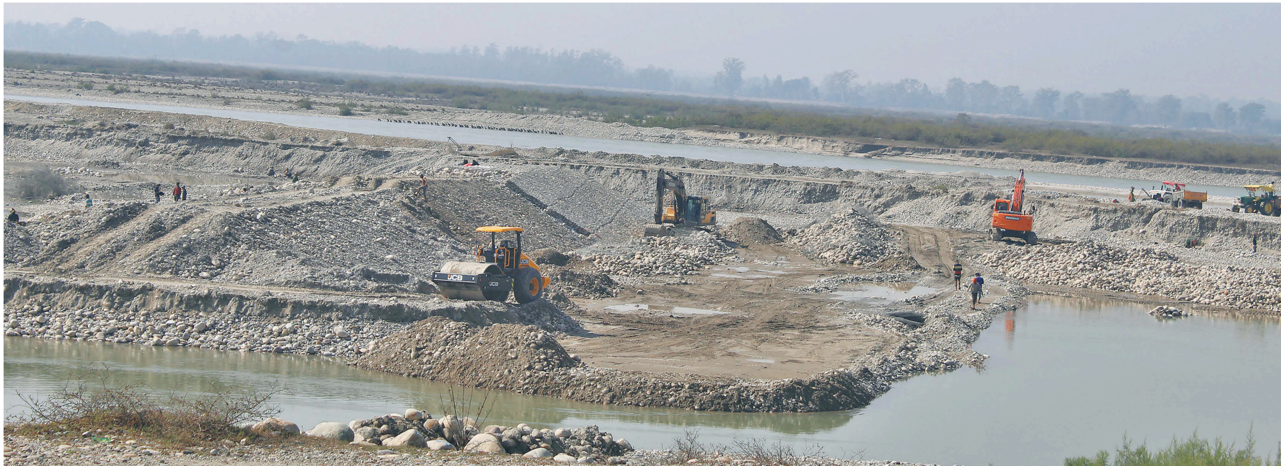
कञ्चनपुरको भीमदत्त नगरपालिकास्थित महाकाली नदीको भुजला घाटमा नियमविपरीत एस्काभेटर, डोजर, लोडरजस्ता ठूला साधन प्रयोग गरी उखनन गरिँदै ।