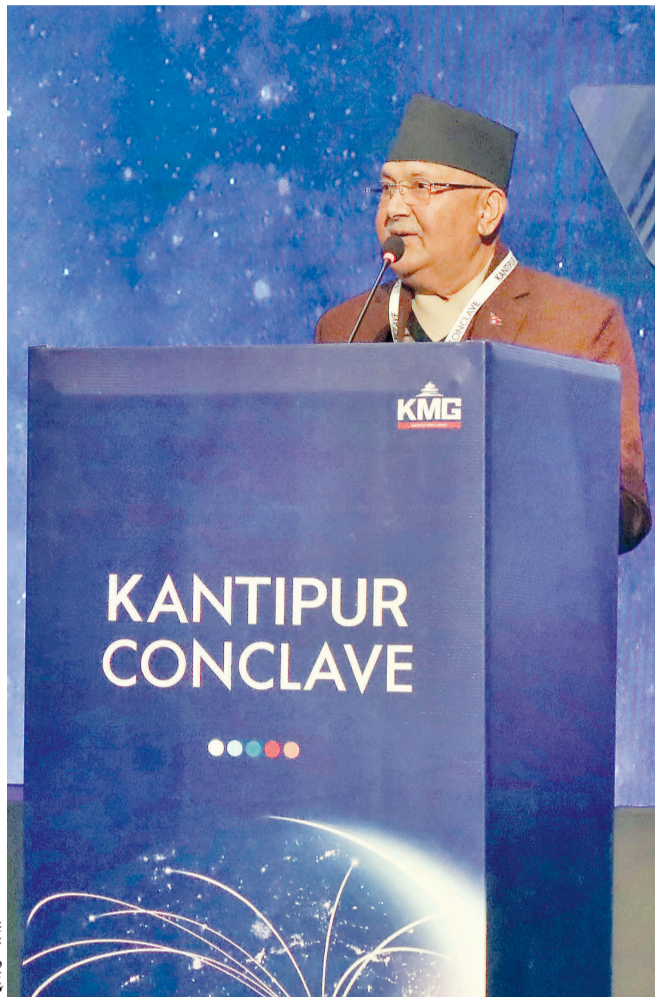
प्रधानमन्त्री केपी शर्मा ओली शुक्रबार कान्तिपुर कन्क्लेभमा सम्बोधन गर्दै ।

अब तिनले पर्यटन विकासमा पनि टेवा दिनेछन्।’ फन्ड २५ मिनेट लामो सम्बोधनमा ओलीले विगतदेखि नै उठाउँदै आएको रेलको प्रसंग छुट्टाएनन्। नेपालमा रेल ल्याउने कुरालाई निरन्तर जोडिँदै आएका उनले दुवै छिमेकी मुलुकसँग नेपाल रेलका माध्यमबाट पनि जोडिने र यसले नेपालको यातायात क्षेत्रमा क्रान्ति ल्याउने बताए। त्यसले नेपालको अर्थतन्त्रलाई उकास्ने पनि उनले उल्लेख गरे। ‘रेलमार्गले नेपाललाई भूजडित मुलुक बनाउने छ,’ प्रधानमन्त्री ओलीले भने, ‘यस्ता उत्साही खालका धेरै परिणाम अहिले देखिएका छन्।’ प्रधानमन्त्री ओलीले दुई वर्षअघि नेतृत्व सहाइ गर्दा जनताले गरेको विश्वासलाई जिम्मेवारीपूर्वक ख्याल गर्दै विकासको यात्रालाई नेतृत्व प्रदान गरेको दावी गरे। ‘मेरो कार्यकालको मध्यांतर आइपुग्दा हामीले मुलुकमा सकारात्मक ऊर्जा सञ्चार गर्न सफल भएका छौं,’ उनले भने, ‘हामीले विकासका लागि राम्रो जग पनि खडा गरेका छौं।’ हाम्रो मुलुकले सही ट्युचक समातेको छ।’ उनले विकासको नमुनाका रूपमा अधि बढेका केही परियोजना उदाहरणका रूपमा पेश गरे। भैरहवा र पोखरा विमानस्थल चाँडै सम्पन्न हुँदैछन्। ती विमानस्थल हवाई कनेक्टिभिटीका लागि ‘गोमचेन्जर’ सपना अहिले कार्यान्वयनमा जान थालेको आशय मुख्य प्रार्थामकतामा छ। यसले दुईपक्षीय र क्षेत्रीय उर्जा व्यापारको उज्वल भविष्य देखाएको छ। प्रधानमन्त्री ओलीले लामो समयको राजनीतिक संक्रमणकाल पश्चात् पछिल्ला दुई वर्षमा नेपालमा राजनीतिक विषय छोडेर विकास, रोजगार र सार्वजनिक हितबारे बहस हुन थाल्नु सकारात्मक भएको बताए।