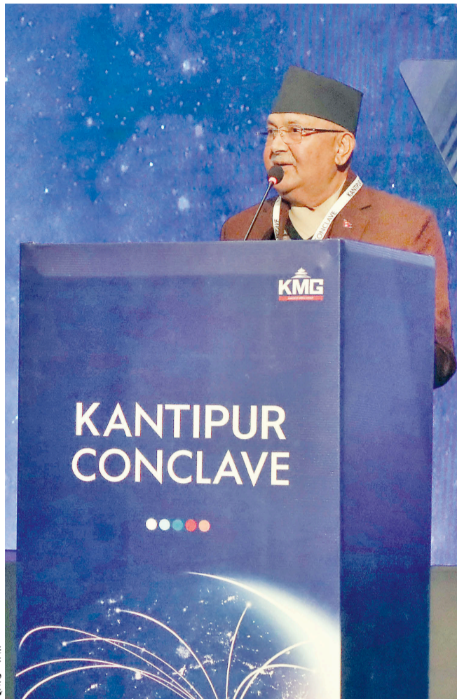
प्रधानमन्त्री केपी शर्मा ओली शुक्रबार कान्तिपुर कन्क्लेभमा सम्बोधन गर्दै ।

अब तिनले पर्यटन विकासमा पनि टेवा दिनेछन्।’ फन्ड २५ मिनेट लामो सम्बोधनमा ओलीले विगतदेखि नै उठाउँदै आएको रेलको प्रसंग छुट्टाएनन्। नेपालमा रेल ल्याउने कुरालाई निरन्तर जोडिँदै आएका उनले दुवै छिमेकी मुलुकसँग नेपाल रेलका माध्यमबाट पनि जोडिने र यसले नेपालको यातायात क्षेत्रमा क्रान्ति ल्याउने बताए। त्यसले नेपालको अर्थतन्त्रलाई उकास्ने पनि उनले उल्लेख गरे। ‘रेलमार्गले नेपाललाई भूजडित मुलुक बनाउने छ,’ प्रधानमन्त्री ओलीले भने, ‘यस्ता उत्साही खालका धेरै परिणाम अहिले देखिएका छन्।’ प्रधानमन्त्री ओलीले दुई वर्षअघि नेतृत्व सम्हाल्दै गर्दा जनताले गरेको विश्वासलाई जिम्मेवारीपूर्वक ख्याल गर्दै विकासको यात्रालाई नेतृत्व प्रदान गरेको दावी गरे। ‘मेरो कार्यकालको मध्यांतर आइपुग्दा हामीले मुलुकमा सकारात्मक ऊर्जा सञ्चार गर्न सफल भएका छौं,’ उनले भने, ‘हामीले विकासका लागि राम्रो जग पनि खडा गरेका छौं।’ हाम्रो मुलुकले सही ट्युचक समातेको छ।’ उनले विकासको नमुनाका रूपमा अधि बढेका केही परियोजना उदाहरणका रूपमा पेश गरे। भैरहवा र पोखरा विमानस्थल चाँडै सम्पन्न हुँदैछन्। ती विमानस्थल हवाई कनेक्टिभिटीका लागि ‘गोमचेन्जर’ सपना अहिले कार्यान्वयनमा जान थालेको आशय मुख्य प्रार्थमिकतामा छ। यसले दुईपक्षीय र क्षेत्रीय उर्जा व्यापारको उज्वल भविष्य देखाएको छ। प्रधानमन्त्री ओलीले लामो समयको राजनीतिक संक्रमणकाल पश्चात् पछिल्ला दुई वर्षमा नेपालमा राजनीतिक विषय छोडेर विकास, रोजगार र सार्वजनिक हितवारे बहस हुन थाल्नु सकारात्मक भएको बताए।