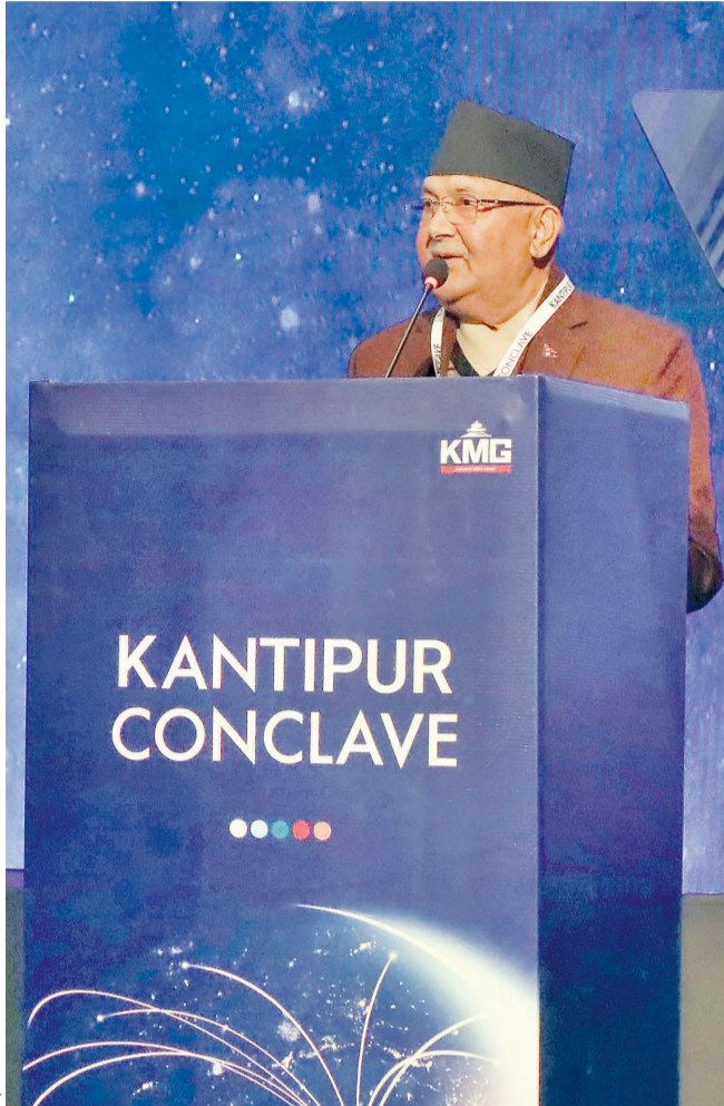
प्रधानमन्त्री केपी शर्मा ओली शुक्रबार कान्तिपुर कन्क्लेभमा सम्बोधन गर्दै ।

विज्ञ भन्छन्- ‘कनेक्टिभिटीलाई सभ्यता र अवधारणा निर्माणको आधार विन्दुका रूपमा समेत लिनुपर्छ’