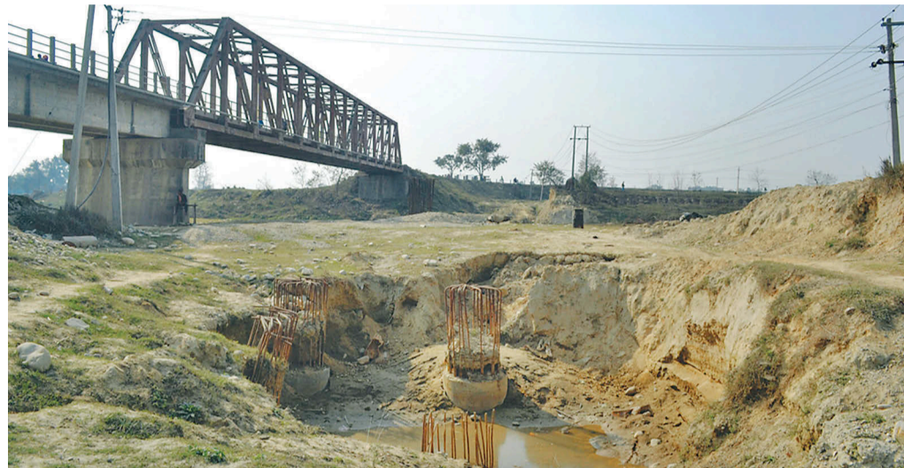
पप्पु/लुम्बिनी जेभीले ठेक्का लिएको पसाको विन्ध्यवासिनी नजिकैको तिलावे पुल ।