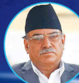
Pushpa Kamal Dahal (Prachanda) Former Prime Minister of Nepal, Chairman of the Nepal Communist Party