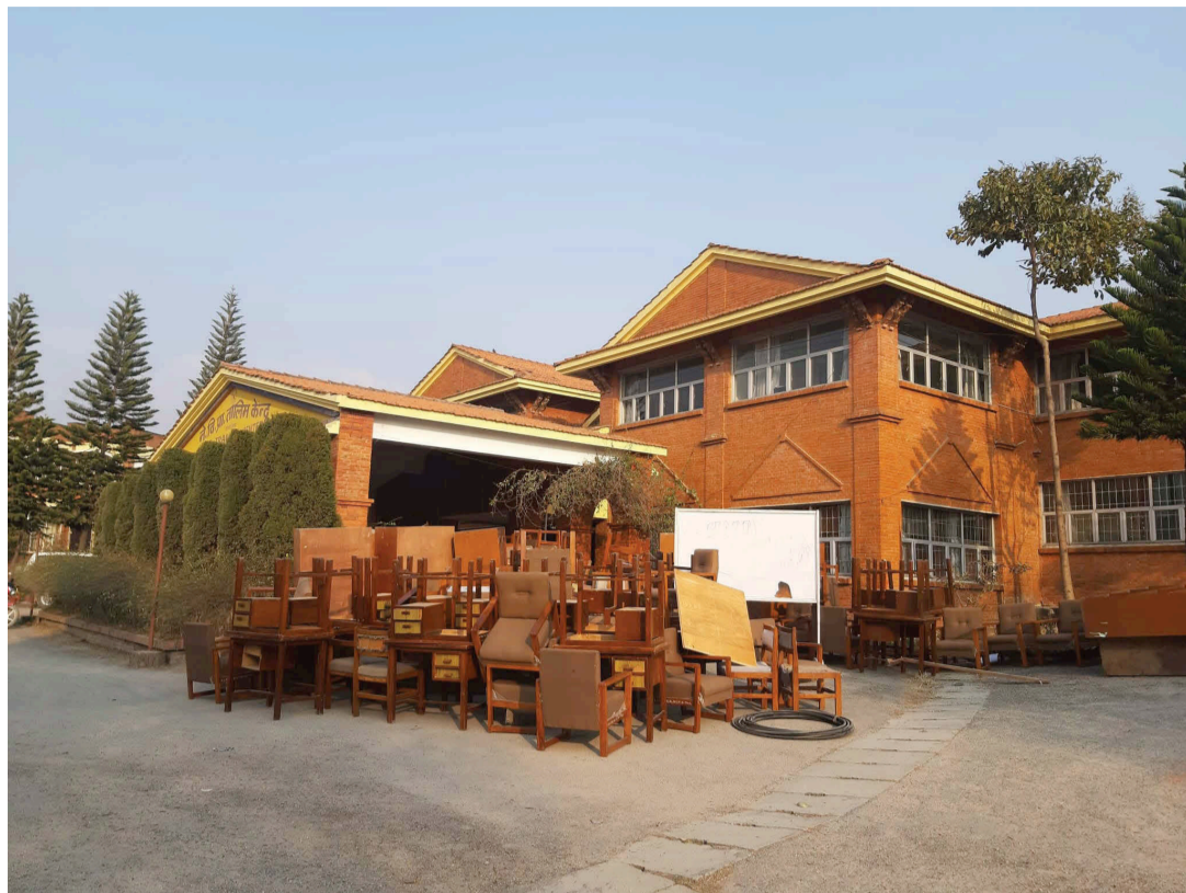
क्वारेन्टाइनका लागि भक्तपुरको खरिपाटीस्थित विद्युत् प्राधिकरणको तालिम केन्द्र भवन खाली गरिँदै कामदार । वातावरण तथा सामाजिक अध्ययन विभाग र होटलको भवनका ५० कोठा खाली गरिनेछ ।