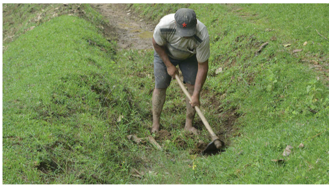
ढुंगामाटाले पुगिएको खारखोला सिंचाइ योजनामा श्रमदान गर्दै स्थानीय कृषक।