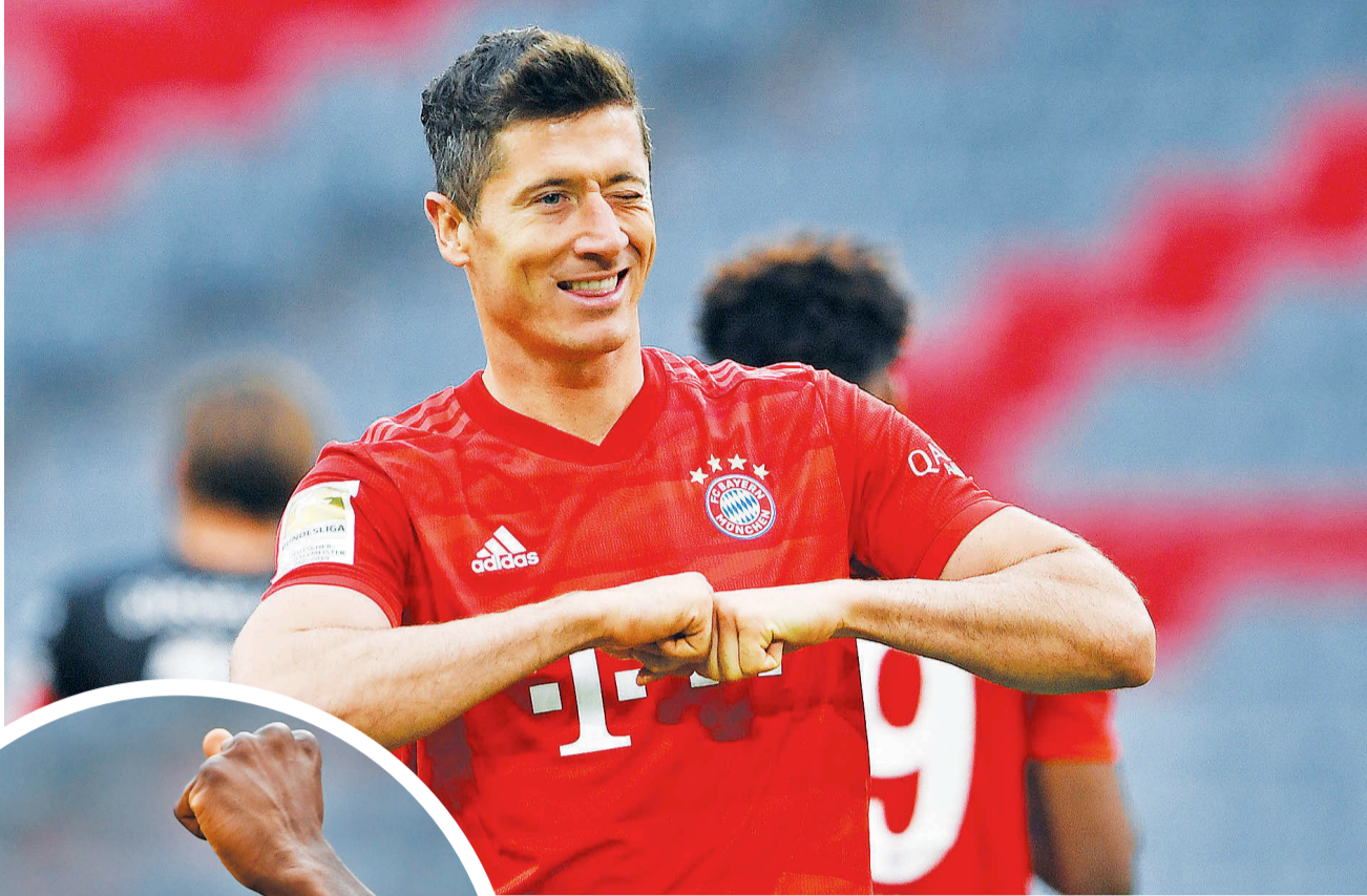
बुन्डेसलिगामा गोल गरेपछि बायर्नका रोबर्ट लेवान्डोस्की । उनले फोर्टुना डुसलडोर्फविरुद्ध ५-० को जित पाउँदा दुई गोल गरेका थिए । सामाजिक दूरी पालना गर्नुपर्ने भएपछि खेलाडीले गोलको खुसी मनाउने तरिका (तल) ।

तर एलिजाज एरिनामा यसपल्ट भएको खेलमा भने बायर्नविरुद्ध ऊर्संग कुनै उत्तर थिएन । सन् २०१८ मा