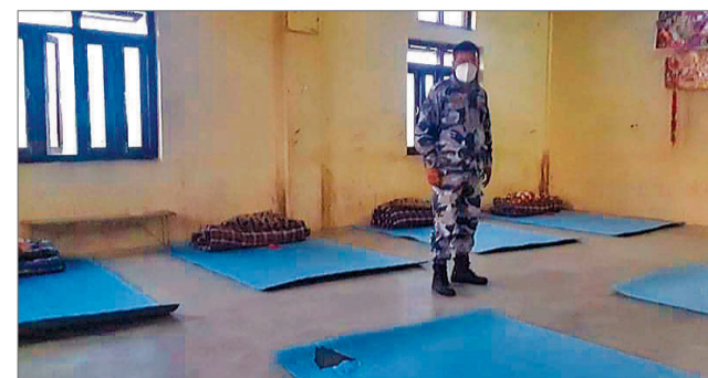
↑ कतै भुइँमा, कतै गोठमा ↓

व्यवस्थापनमा समस्या भएपछि, सम्भावित संक्रमित रहेको स्थानका क्वारेन्टाइनमा रहेका व्यक्तिको स्वाव परीक्षणमा ढिलाइ भइरहेको आरोप लाग्न थालेको छ। स्थानीय सरकारले अहिले जहाँ खाली भवन र कोठा पायो, त्यही संक्रमितलाई आइसोलेसनमा राखिरहेका छन्। धेरै संक्रमित रहेका जिल्लामा साविकका क्वारेन्टाइन स्थलमै कोठा खोजेर संक्रमितलाई राख्न थालिएको छ। बाँकेमा विद्यालयका बेन्च जोडेर आइसोलेसनमा बेड बनाइएको छ। खजुरास्थित सुशील कोडराला प्रखर क्यान्सर अस्पताल र नेपालगन्जस्थित लायन्स डेन्टल अस्पताल भएपछि, कोहलपुरको पिपरीस्थित कृषि विकास बैँकको तालिम हलमा ४१ जना राखिएको छ। त्यहाँ पनि भएपछि, स्थानीय तहले पंखा र वती नभएका कोठामा राख्न थालेका छन्।