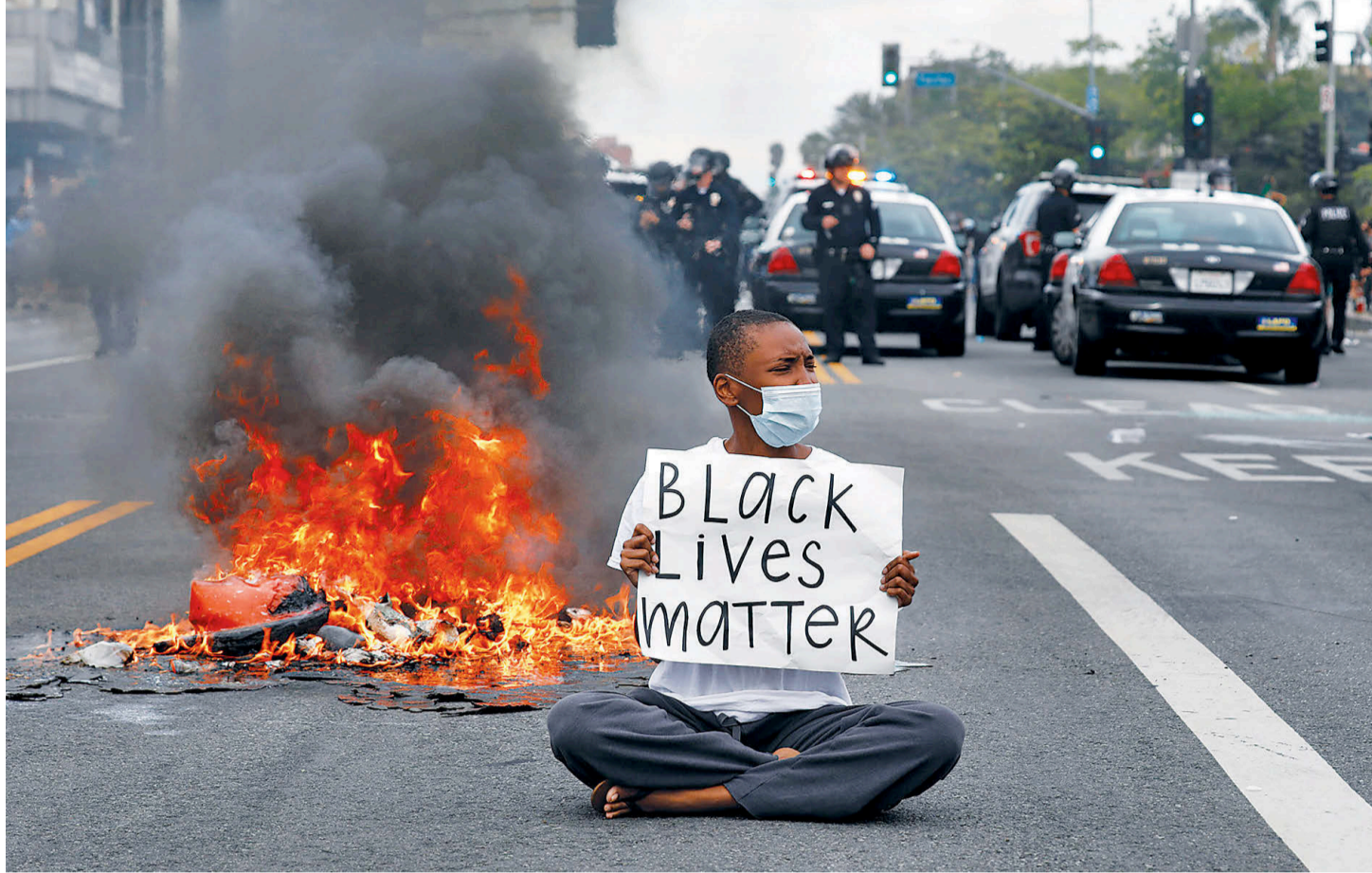
अमेरिकाको लस एन्जलसमा गरिएको विरोध प्रदर्शन।

कहाँ के भयो ? अमेरिकाका कम्तीमा ३० वटा सहरमा ठूला प्रदर्शनहरू भए। एट्लान्टामा कफ्यु उल्लंघन गर्ने ७० जनालाई प्रहरीले पक्राउ गरेको छ। हिंसात्मक प्रदर्शनपछि एट्लान्टामा शनिवार साँझ ९ बजेदेखि कफ्यु लगाइएको थियो। प्रहरीले शनिवारको तुलनामा आइतबार प्रदर्शनकारीको संख्या निकै घटेको जनाएको छ। सियाटलमा गरिएको प्रदर्शनका क्रममा प्रहरीले कम्तीमा २७ जनालाई नियन्त्रणमा लिएको छ। सियाटल प्रहरीका