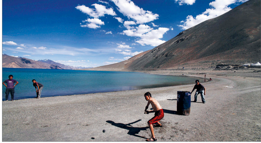
भारत-चीन सीमामा पर्ने लद्दाखस्थित पानगोड्या ताल।

भारत र चीनबीच करिब पैतिस सय किलोमिटर लामो सीमा छ। जसमध्ये केही भूभागमा दुई मुलुकबीच दशकौंदेखि विवाद रहँदै आएको छ। कतिपय भूभागमा त दुवै देशले आफ्नो दावी गर्दै आएका छन्। भारतको तर्फबाट उक्त क्षेत्र निगरानी सेना र आईटीवीपीले गर्छन्। संवेदनशील क्षेत्रमा भारतीय सेनाले निगरानी गर्छ भने अन्य ठाउँमा इन्डो-तिब्बत बोर्डर पोलिस (आईटीवीपी) ले नै सीमा सुरक्षा हेर्दै आएको छ। सीमा विवादलाई नै लिएर सन् १९६२ मा दुई मुलुकबीच युद्धसमेत भएको थियो। भारतले नराम्ररी पराजय भोगेको उक्त युद्धपछि पनि सीमा विवाद भने टुंगिएको छ। पछिल्लो विवाद भनेको लद्दाखस्थित सीमा क्षेत्रलाई लिएर हो। जम्मु-