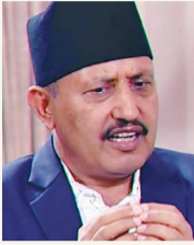
गिरिराजमणि पोखरेल शिक्षामन्त्री

शिक्षामन्त्री गिरिराजमणि पोखरेलले बजेट बक्तव्यमा उल्लेखित सामुदायिक विद्यालयको पूर्वाधारसहितका सामग्री र शैक्षिक गुणस्तर सुधारको जिम्मेवारी निजी विद्यालयलाई दिने कार्यक्रम शिक्षा मन्त्रालयको नभएको बताएका छन्। शिक्षामन्त्रीले आइतबार विज्ञापित प्रकाशित गरेर उक्त कार्यक्रम शिक्षा