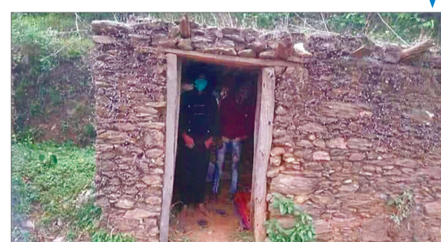
कपिलवस्तुको महाराजगन्ज नगरपालिकाले जानकी माविमा बनाएको आइसोलेसन सेन्टर (माथि), जहाँ भुइँमै म्याट ओछ्याएर बनाइएका १६९ 'शय्या' मध्ये ४७ बेडामा संक्रमितलाई राखिएको छ। यस्तै देलेखको भैरवी गाउँपालिकाले आइसोलेसन बनाएको भैरवीगोठ (तल), जहाँ आरडीटी परीक्षणमा एन्टीबडी पोजिटिभ देखिएका चार स्थानीयलाई राखिएको छ।