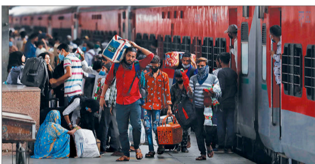
भारतको महाराष्ट्रबाट रेल चढेर आइतबार प्रयागराज पुगेका प्रवासी मजदुर।

कोभिड-१९ को संक्रमण फैलन नरोकिएपछि भारतमा पाँचौ चरणको लकडाउन जुन ३० सम्मका लागि जारी गरिएको छ। यस अवधिमा जोखिमपूर्ण क्षेत्रमा बाहेक अधिकांश व्यावसायिक गतिविधि मुचार्क भएका छन्। पछिल्लो समय लकडाउन खुकुलो पारिसँगै भारतमा संक्रमितको संख्या भन्नु बढेको छ। तर अर्थतन्त्रमा गम्भीर असर पुग्न थालेपछि भारत सरकार लकडाउन खुकुलो पार्न चाड्य भएको हो। जनस्वास्थ्यविद्हरूले भारतमा संक्रमण अझै उच्च चिन्टमा पुगिसकेको बताएका छन्। उनीहरूका अनुसार जुन जुलाई महिनामा भारतमा संक्रमितको