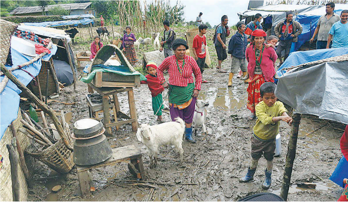
बेलाबेलाको कालिञ्चोक-५ मा षट्टै खोलाको बाढीले घर बनाएपछि विस्थापित परिवारको आश्रय । बारीमा अस्थायी छात्रा हालैका १६ परिवार बिजोगसँग बसेका छन् ।

'बेलाबेला खोज जाओ भन्दा विद्यालयमा बसेका प्रहरी टैनिङ' उनले भने, 'अब भेटिँदैन भनेर टारेका छन्, लास नभेटेसम्म मरेको कि जिउँदो कसरी पत्त्याउनु?' प्रहरी प्रशासनले पीडितको चासो राख्ने छाडिसकेको उनले टिप्पणी गरे । 'अहिले त १० जना प्रहरी गाउँमा आउजाउ गरिरहन्छन्, खोलाका खोज्ने कोही छैन,' उनले