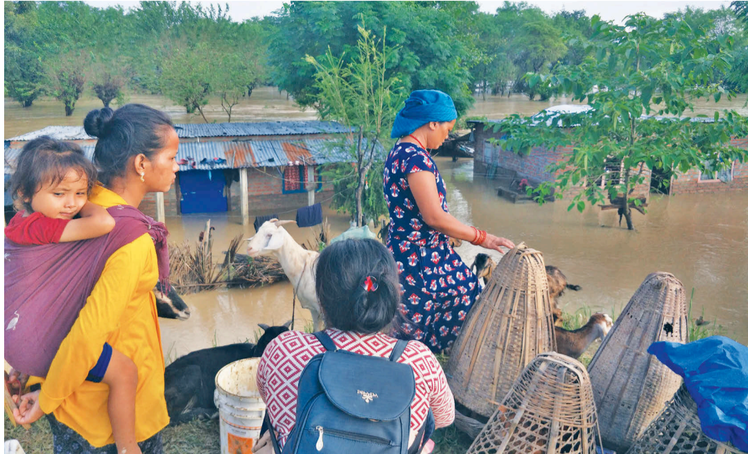
रूपन्देहीको ओमसलिया-५, पिपरिवहामा शनिवार रोहिणी नदीमा आएको बाढीले घर बगाएपछि विस्थापित भएका स्थानीय ।