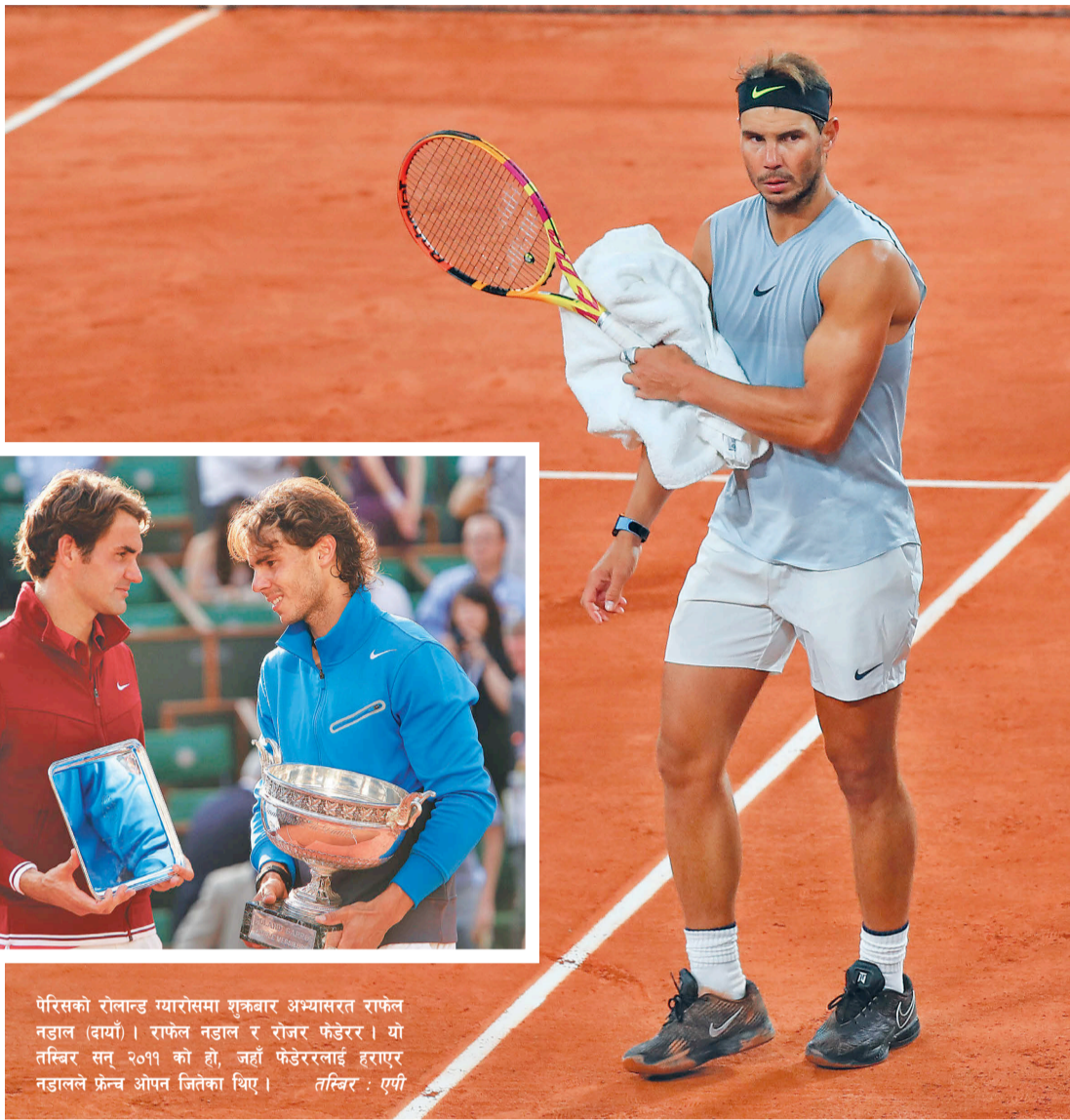
पेरिसको रोलाण्ड ग्यारोसमा शुक्रवार अभ्यासरत राफेल नडाल (दायाँ) । राफेल नडाल र रोजर फेडेरर । यो तस्वीर सन् २०११ को हो, जहाँ फेडेररलाई हराएर नडालले फ्रेंच ओपन जितेका थिए ।

नडालले जितेका १२ फ्रेंच ओपनमध्ये प्रत्येक अवसरमा उनले तयारीका रूपमा कुनै न कुनै अर्को स्कोर्ट प्रतियोगिता जितेका छन् । यसपल्ट भने यस्तो भएन । कोरोना भाइरस संक्रमणको महामारीले गर्दा खासै प्रतियोगिता नै भएन, खेलेको एकमात्र प्रतियोगितामा पनि उनी पराजित रहे । संयोग कस्तो भने त्यो प्रतियोगिताको उपाधि नोभाक