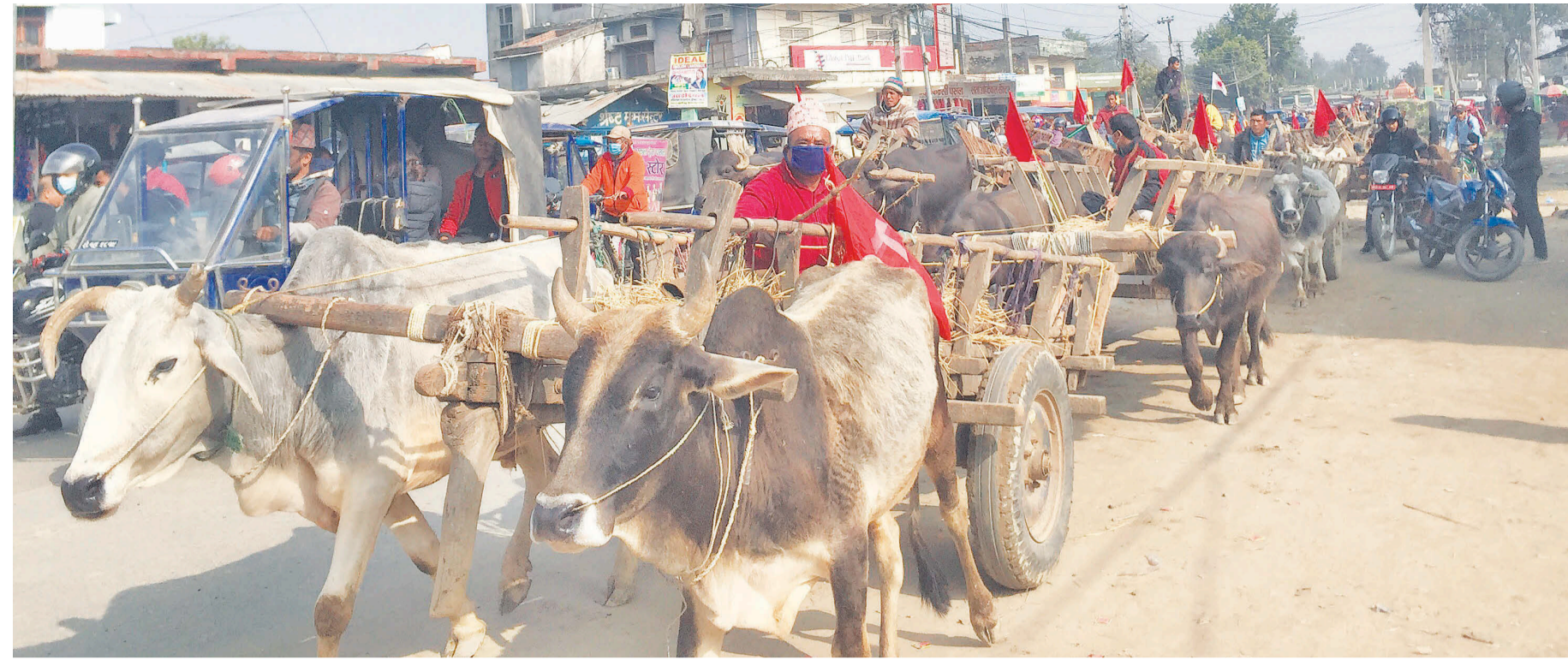
नेकपा दाहाल-नेपाल समूहिकट अनेरास्ववियूले आइतवार धनगढीमा गरेको बयलगाडासहितको विरोध प्रदर्शन । प्रधानमन्त्री केपी शर्मा ओलीले ०६२/६३ को जनआन्दोलनमा 'गणतन्त्र आउनु भनेको बयलगाडामा अमेरिका पुग्नुजस्तै हो' भन्ने अभिव्यक्ति दिएको भन्दै व्याघ्रस्वरूप बयलगाडा च्याली निकालेका हुन् ।