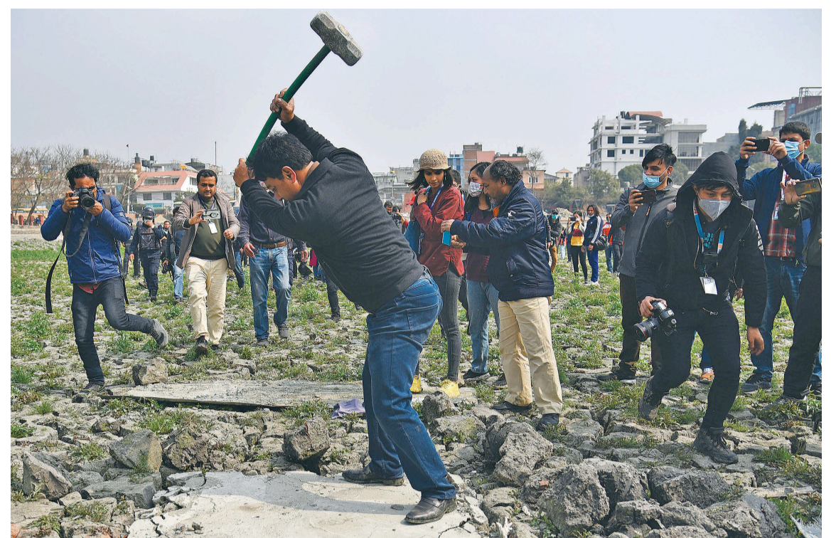
कमलपोखरी पुनर्निर्माणका क्रममा पोखरीको बीचमा बनाइएको कंक्रीट संरचना भत्काउँदै बृहत् नागरिक आन्दोलनका अभियन्ता।