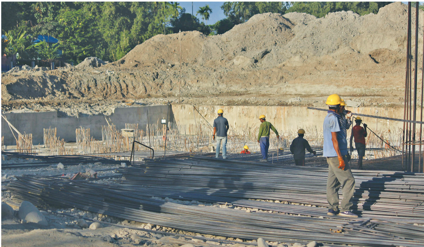
प्रधानमन्त्री केपी शर्मा ओलीको गृहजिल्ला भन्नाको दमकमा निर्माणाधीन भ्यू टावर। शिलान्यास भएको चार वर्ष हुँदा यसको प्रगति २५ प्रतिशत मात्र छ। भ्यू टावर निर्माण भने २०७९ पुससम्म सक्नुपर्नेछ।

प्रधानमन्त्री ओलीले नै मोरङको कटहरी गाउँपालिका-१ महेशपुरमा निर्मित एकीकृत तरकारी तथा फलफूल थोक