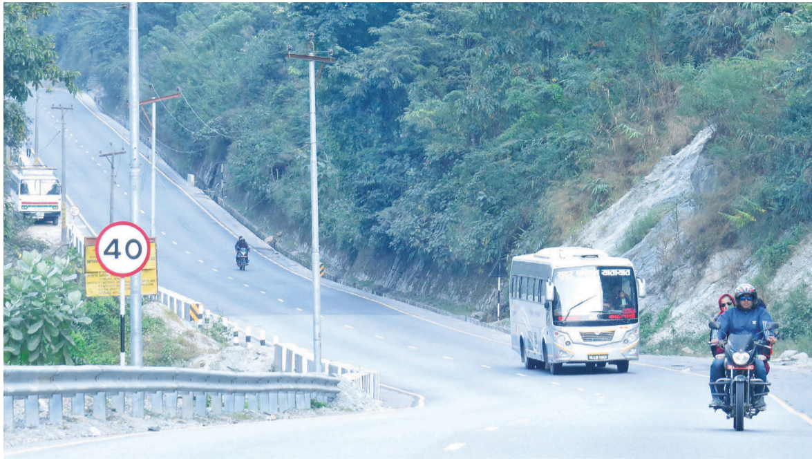
चितवनको नारायणगढ-मुग्लिङ सडक।

प्रदेश ट्राफिक प्रहरी कार्यालयले नारायणगढ-मुग्लिङ सडक विस्तार हुनुअघिको तीन वर्ष र विस्तारपछिको अढाइ वर्षमा भएका दुर्घटनाको संख्या विश्लेषण गरेको छ। एसपी कोइरालाका अनुसार विस्तारअघि २०७२/७३ देखि २०७४/७५ सम्म २ हजार २ सय ६६ वटा साना-ठूला दुर्घटना भएको तथ्यांक छ। यी दुर्घटनामा ४ सय ४२ जनाको मृत्यु र ९ सय ५६ जना घाइते भएका थिए। सडक विस्तारपछि २०७५/७६ देखि चालु आवको पहिलो ६ महिनासम्म ३ सय ४५ वटा दुर्घटना हुँदा ५६ जनाको मृत्यु र १ सय ३१ जना घाइते भएका छन्। २०७६/७७ मा ८ सय ९८ दुर्घटना भएका थिए। जसमा १ सय ७० जनाको मृत्यु र ३ सय २ जना घाइते भएका थिए। तर गत साउनदेखि पुससम्ममा दुर्घटना संख्या जम्मा ४४ छ। मृत्यु हुने ४ जना र घाइते हुनेको संख्या १९ छ। 'जबकि यो अवधिमा अन्य सडकहरूमा दुर्घटना संख्या अघिल्ला वर्षहरूको भन्दा बढेको छ,' कोइरालाले भने। दुर्घटना बढी हुनुमा सडकको दुरवस्था पनि प्रमुख कारक मानिन्छ। सडकको स्तरवृद्धिसँगै नारायणगढ-मुग्लिङ सडकमा दुर्घटना घटेको उनले दावी गरे।