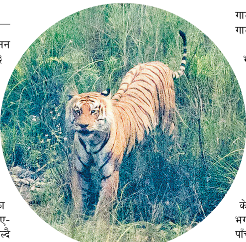
बर्दिया निकुञ्जमा आइतबार दिउँसो देखिएको बाघ।