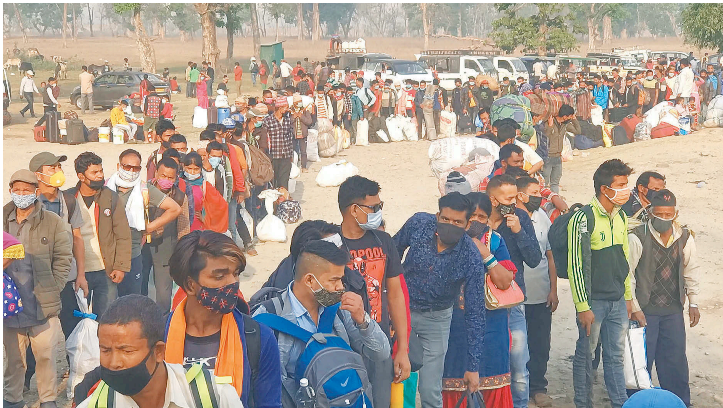
कञ्चनपुरको गड्डाचौकी नाकामा भारतबाट फर्किएका नेपाली।

भारतबाट घर फर्किने केही नेपालीमा संक्रमण देखिएको जिल्ला स्वास्थ्य कार्यालयले जनाएको छ। नेपाल-भारत सीमा स्वीडहामा राखिएको हेल्थ डेस्कमा भारतबाट फर्किने १ सय २४ जनाको एन्टिजेन परीक्षण गर्दा १० जनामा संक्रमण देखिएको छ। हेल्थ डेस्कमा १५ मिनेटमा रिपोर्ट दिन सक्ने प्रविधि व्यवस्था गरिएको छ तर जनशक्ति अभाव छ। सरकारले एक जना स्वास्थ्य र पाँच जना स्वास्थ्यकर्मी पठाएको छ। नेपालगन्जको स्वास्थ्य शाखाले दुई स्वास्थ्यकर्मी परिचालन गरेको छ। भारतबाट दैनिक पाँच सयको हाराहारीमा नेपाली घर फर्किरहेका छन्। उनीहरू सबैको स्वास्थ्य परीक्षण सम्भव नभएको सीमामा खटिएका