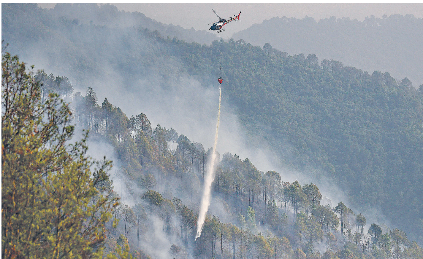
शिवपुरी-नागार्जुन राष्ट्रिय निकुञ्जमा आइतबार लागेको डढेलो हेलिकप्टरबाट पानी खसालेर निभाइँदै।

● निभाउन बाम्बी बकेटसहित हेलिकप्टर प्रयोग ● आइतबार ३ सय ९७ ठाउँमा डढेलो