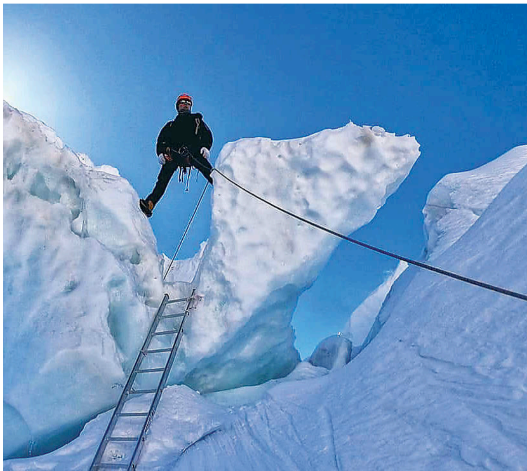
बसन्तकालीन आरोहणका लागि सगरमाथा आधार शिविरमा बाटो बनाउँदै गाइड।

खुम्बु क्षेत्रमा युरोपेली मुलुक, अमेरिकाकावास्तविकता आएका विदेशीहरू सगरमाथा आरोहणका लागि त्यहाँको हावापानीसँग अनुकूल हुन अन्यास गरिरहेका छन्। लोत्से, अन्नपूर्ण, धौलागिरि, नुप्ते, मकालु, तिलिचोलगायतका ६ हजार मिटर अग्ला अन्य हिमालतर्फ पनि विदेशी आरोहीहरू घमाघम गइरहेका छन्। गत वर्ष यही बेला लकडाउनका कारण हिमाली क्षेत्रमा सन्नाटा थियो। तर यस वर्षको बसन्तकालीन हिमाल आरोहणका लागि विदेशी पर्यटकको आगमन दिनहुँ बढ्दै