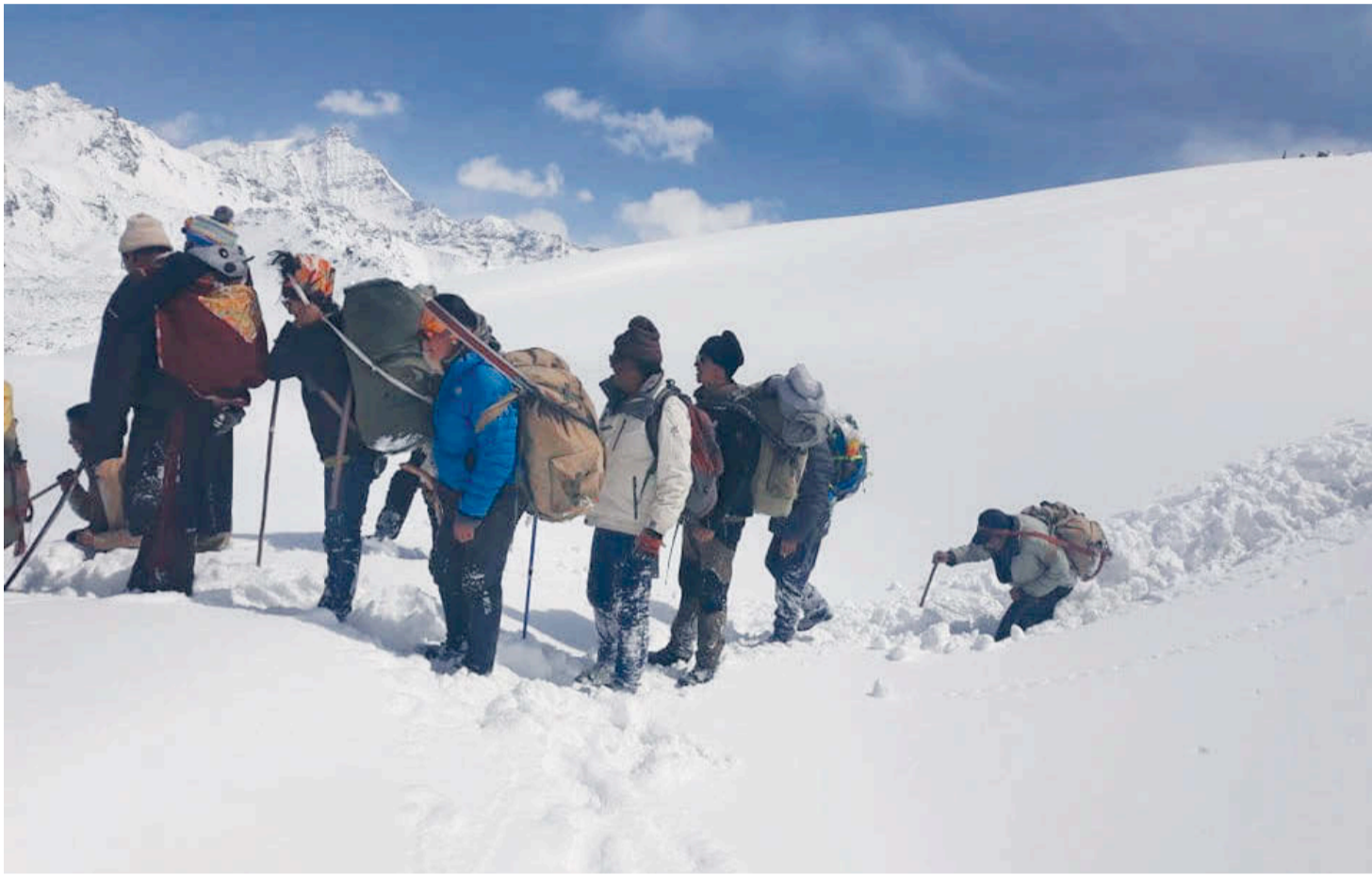
सिमकोट पुनका लागि फर्कंदै ५ हजार मिटर उचाइको न्यालु लेक छिचोलेर नाम्बा गाउँपालिका-६ का बासिन्दा ।

हिमालपारिको गाउँ लिमीका लागि ११ योजनामा बजेट विनियोजन भए पनि सबै अधुरा