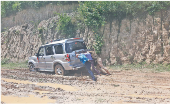
अछामको लुंग्रामा सडक अवरुद्ध भएपछि गाडी धकेल्दै यात्रु ।

नयाँ सडक निर्माण मात्रै होइन, पुराना सडकको मर्मतमा पनि डोजर फैल्यो प्रयोग भइरहेको छ। तर, कुनै पनि स्थानीय तहले डोजर प्रयोगको मापदण्ड भने बनाएका छैनन्। 'कतिपय जनप्रतिनिधिका आफ्नै डोजर छन्। आफ्नो फाइदाका लागि जथाभावी प्रयोग गरिरहेका छन्। पानीका मुहान सुक्ने, वाढीपहिरो जाने जस्ता वातावरणलाई असर पार्ने क्रामा