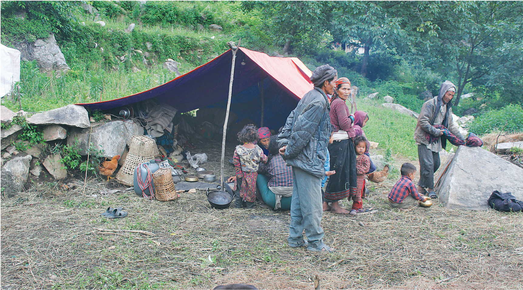
बाजुराको हिमाली गाउँपालिका-५ क्युडी गाउँका पहिरोपीडित ।

● प्रतिपरिवार ३० किलो चामल राहत ● ओत लाग्ने पाल पनि छैन