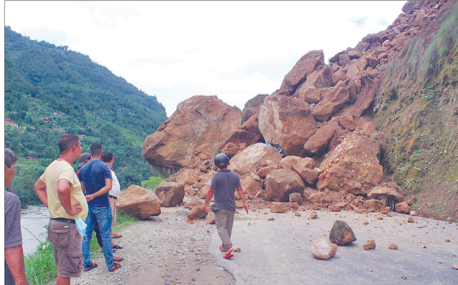
मध्यपहाडी लोकमार्गअन्तर्गत पर्वतको कुश्मा-१ नयाँपुलमा बिहीबार खसेको पहिरो ।