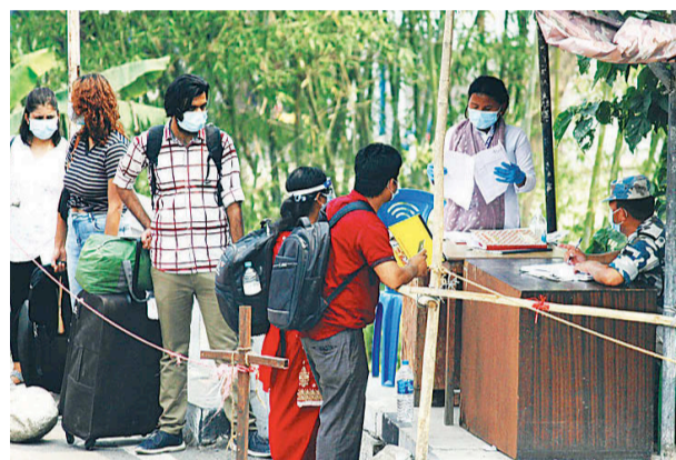
पूर्वी नाकामा भारतीय नागरिकलाई पीसीआर रिपोर्टका आधारमा मात्र प्रवेश दिइएको छ।

काँकडभिट्टा (कास) - पूर्वीनाकामा भारतीय यात्रीको प्रवेशमा गरिएको कडाइ जारी छ। प्रमुख जिल्ला अधिकारी रहेको कोरोना विपद् व्यवस्थापन केन्द्रको वैशाख ८ को निर्णयले भारतीय नागरिक प्रवेशमा कडाइ गरेको थियो।