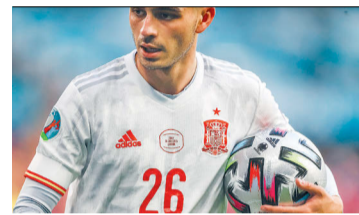
पराजित रह्यो । तर स्पेनले तय गरेको सेमिफाइनल यात्राका सबैभन्दा मुख्य खेलाडीमा उनी पनि थिए ।

गोलका लागि प्रयास गर्ने खेलाडीमा उनी समग्रमै अगाडि छन् । अनि गोलमा सहयोगी भूमिका खेल्नेमा दोस्रो स्थानमा पर्छन् । स्पेनका लागि गतिलो खेल्नेमध्ये एक फेरान टोरेस पनि रहे । उनी २१ वर्षका मात्र भए, उनले यही प्रतियोगितामा स्पेनका लागि दुई गोल गरे । युरो २०२० खेल मैदानमा उत्रेबा स्पेनमाथि चर्को दबाव थियो । अफ्रिभन्दा स्पेनले यतिको गर्न सक्छ भन्दा प्रश्न गर्ने उत्तिकै थिए । धेरैलाई टिममाथि शंका थियो ।