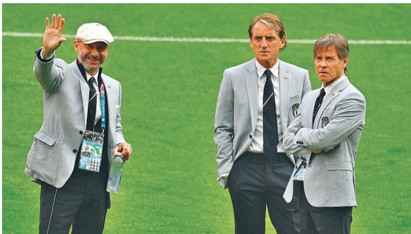
इटालियन प्रशिक्षक रोबर्टो मान्चिनी (बीच) र टिम प्रमुख जियानलुका भियाली (बायाँ) ।

पछि वेम्बलीमै उनीहरूले सफलता चाखे । भियालीले सन् २००० मा चेल्वी व्यवस्थापकका रूपमा एएफ कप जिते । सन् २०११ मा मान्चिनीले यही उपाधि म्यानचेस्टर सिटीका लागि जिते । सन् २०१९ मा यो जोडी फेरि एकै स्थानमा आइपुगे,