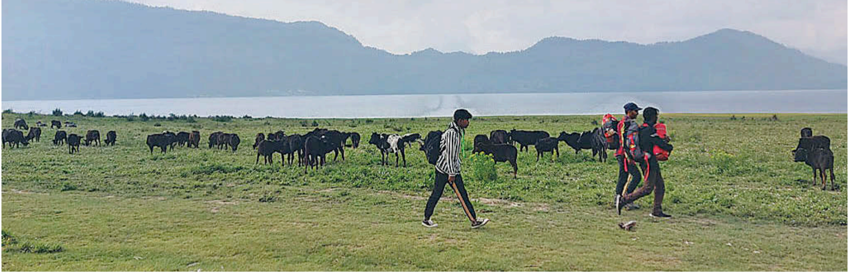
कर्णालीको प्रमुख पर्यटकीय स्थल रारातालवरिपरि चर्दै पशुचौपाया। कोरोनाका कारण पर्यटक नआउँदा रारा क्षेत्र चरनस्थलका रूपमा परिणत भएको छ।

अधिल्ला दुई आर्थिक वर्षमा साइकल लेनका लागि विनियोजन गरेको भन्दा ४ करोड रूपैयाँ फ्रिज