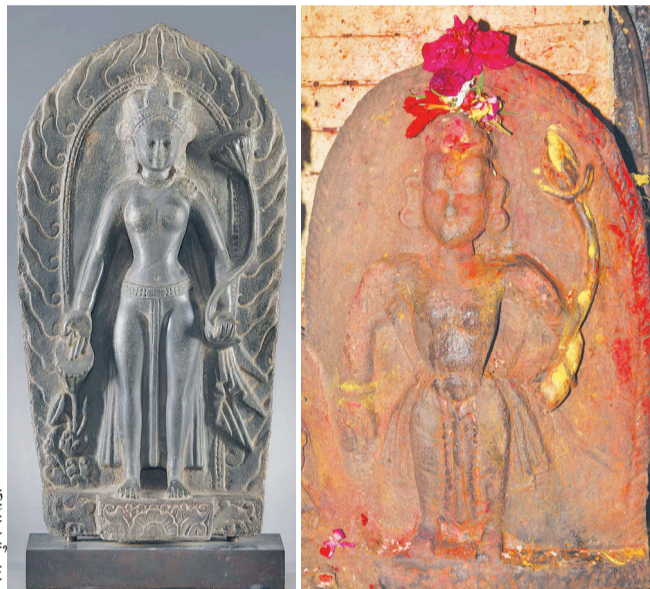
हाल अमेरिकाको कनेटिकटस्थित येल युनिभर्सिटीमा रहेको पार्वतीको मूर्ति (बायाँ) र चोरीपछि नित्य पूजा नरोक्न राखिएको प्रतिलिपि मूर्ति।