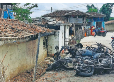
गैतहटको चन्द्रपुर-८ बस्तीपुरमा फडपपछि स्थानीयले जलाएका मोटरसाइडकल।

चन्द्रपुर-८ बस्तीपुरमा विहीवार राति भएको फडपमा स्थानीयले सात वटा मोटरसाइडकल जलाइदिएका छन्। एक दर्जन मोटरसाइडकलमा बाहिरबाट आएकाहरूले गाउँमा होहल्ला गर्न थालेपछि स्थानीय प्रतिकारमा उत्रिएका थिए। त्यसपछि दुवै पक्षबीच फडप र घण्टा फडप भएको हो। घटनामा चार जना स्थानीय घाइते छन्। प्रहरीले केहीलाई नियन्त्रणमा लिएर अनुसन्धान थालेको छ। राति नै ठूलो संख्यामा सुरक्षाकर्मी पुगेर स्थिति नियन्त्रणमा लिएको थियो।