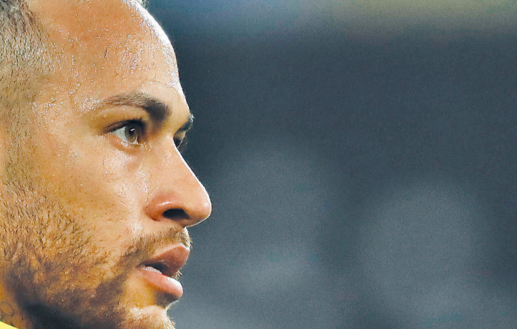
ब्राजिलका नेयमर र अर्जेन्टिनाका लियोनल मेसी ।

युवा स्टार नेयमरको ब्राजिल प्रतियोगिताको डिफिन्डिङ च्याम्पियन पनि हो । उसलाई फेरि उपाधि जित्नबाट छेक्ने काम लियोनल मेसीको अर्जेन्टिनाले गर्नेछ । उत्तिकै राम्रो तथ्य के छ भने यी दुई फुटबलका परम्परागत महाशक्तिहरू संयुक्त रूपमा सातपल्ट विश्वकप जितेका छन् भने २३ पल्ट कोपा अमेरिका । सन् १९९३ यता अर्जेन्टिनाले कोपा जित्न सकेको छैन । मेसीले न त आफ्नो देशका लागि कुनै ठूलो उपाधि हात पार्न सकेका छन्, जितिकै ठूलो स्टार भए पनि । मेसीले तीनपल्ट कोपा अमेरिकीको फाइनल खेल्नसकेका छन्, २००७, २०१५ र २०१६ मा । तिनै