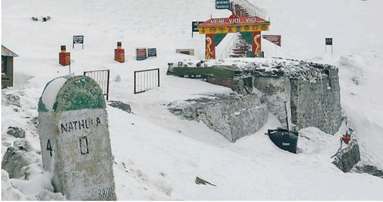
भारत-चीन सीमा नाका नाथुला।

अर्थतन्त्रमा विश्वकै हस्ती मुलुकहरू चीन र