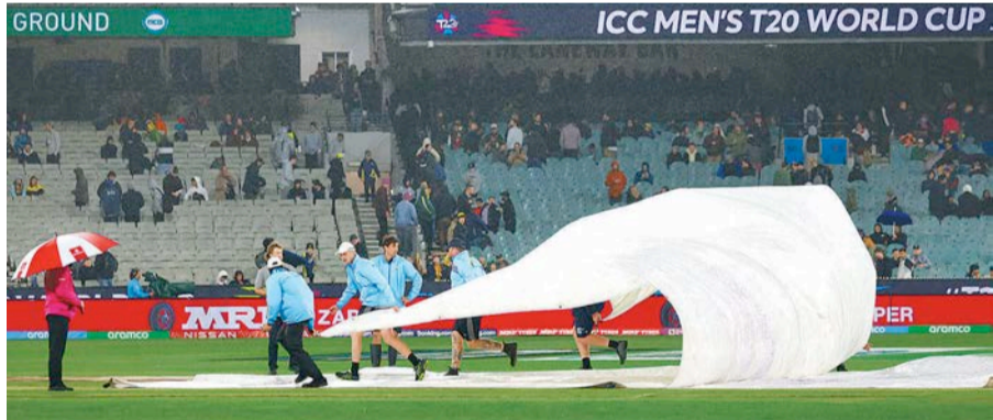
वर्षाका कारण मेलबर्न क्रिकेट मैदानको विकेटलाई कभर बिछ्याइँदै।

ती कामदारलाई प्रचण्ड गर्मीका बेला लामो समय काम गराउने तथा तिनीहरूको कमजोर बसाइबारे पनि धेरै प्रश्न गरिन्छ। यस्तै आफूले पाउनुपर्ने पारिश्रमिक नपाउँदा आजाब उठाउने कामदारलाई देश निकाला गरेको आरोप पनि कतारमाथि लागेको छ। यी आरोप पनि कतारी सरकारले कामदारले पाउनुपर्ने न्यूनतम पारिश्रमिकबारे नियम बनाउँदै प्रतिकूल स्थितिमा काम नगराउने नियम पनि बनाएको छ। तर यित्तले पनि धेरैको चित्त भने बुझेको छैन।