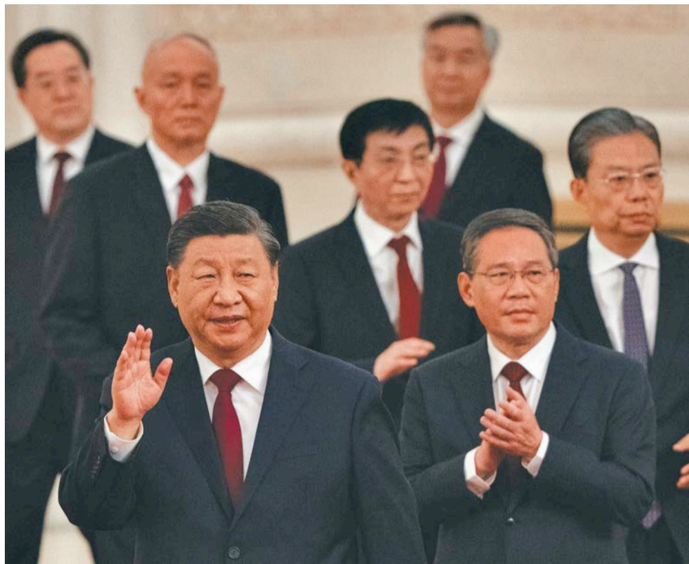
राष्ट्रपति सी चिनफिङसहित चिनियाँ कम्युनिस्ट पार्टीको सात सदस्यीय पोलिटब्युरो स्ट्याण्डिङ कमिटी।

नियाँ कम्युनिस्ट पार्टी (सीपीसी) को २० औं राष्ट्रिय महाधिवेशनको उपलब्धिबारे नेपालमा पनि जानकारी दिइएको छ। असोज ३० बाट सुरु भएको महाधिवेशन राष्ट्रपति सी चिनफिङलाई महासचिवमा चयन गर्दै कात्तिक ५ मा सकिएको थियो। महाधिवेशनले सीलाई 'चेयरम्यान' माओपिछि सीपीसी र चीनको दोस्रो सर्वोच्च नेताका रूपमा पुऱ्याएको चर्चा छ। महाधिवेशन सकिएको भोलिपल्ट नै 'नयाँ यात्रा, साभा गन्तव्य' अभियान सुरु भएको उल्लेख गर्दै चाइना सेन्ट्रल रेडियो एन्ड टेलिभिजनको एसिया अफ्रिका सेक्टर र नेपाल-चीन युथ फ्रेंड्सिप एसोसिएसनले संयुक्त रूपमा काठमाडौंमा कार्यक्रम आयोजना गरेको हो। चिनियाँ सरकारी टेलिभिजन सीपीसीको २० औं राष्ट्रिय महाधिवेशनका प्रतिनिधि आन सियाओयुले केन्द्रीय रेडियो तथा टेलिभिजन स्टेसनमा उपस्थित तथा भर्चुअल रूपमा काठमाडौंबाट सहभागी अधिकारीलाई महाधिवेशन समापन र उपलब्धिबारे जानकारी दिएका थिए।