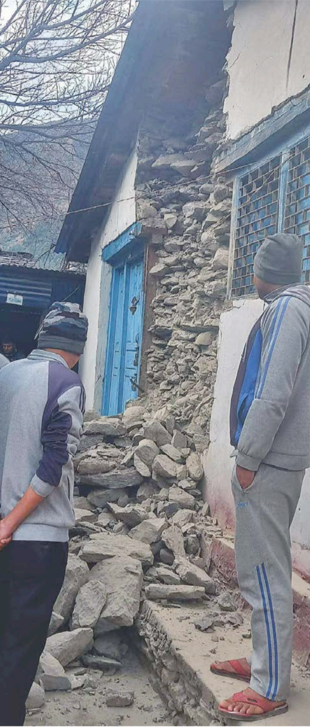
भूकम्पले भत्किएको बफाइको कृषि ज्ञान केन्द्र भवन ।