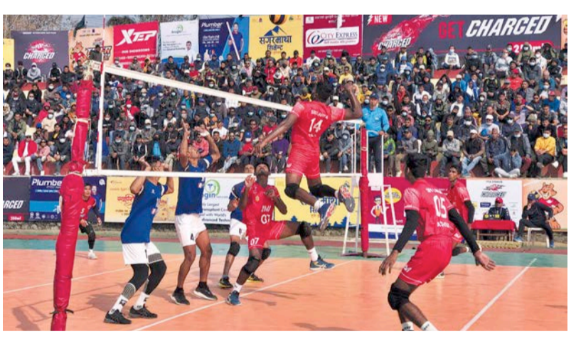
टाइगर कप भलिबलमा पुलिसविरुद्ध स्पाइड हार्ने सेन्ट जोसेफका खेलाडी।