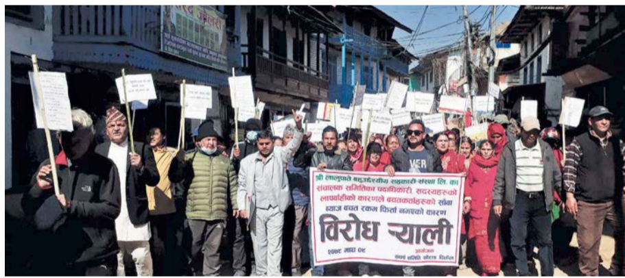
खोटाङको दिक्तेलस्थित लालुपाते बहुउद्देश्यीय सहकारी संस्थामा गरिएको बचत फिर्ता गर्न माग गर्दै दिक्तेलमा गरिएको प्रदर्शन।