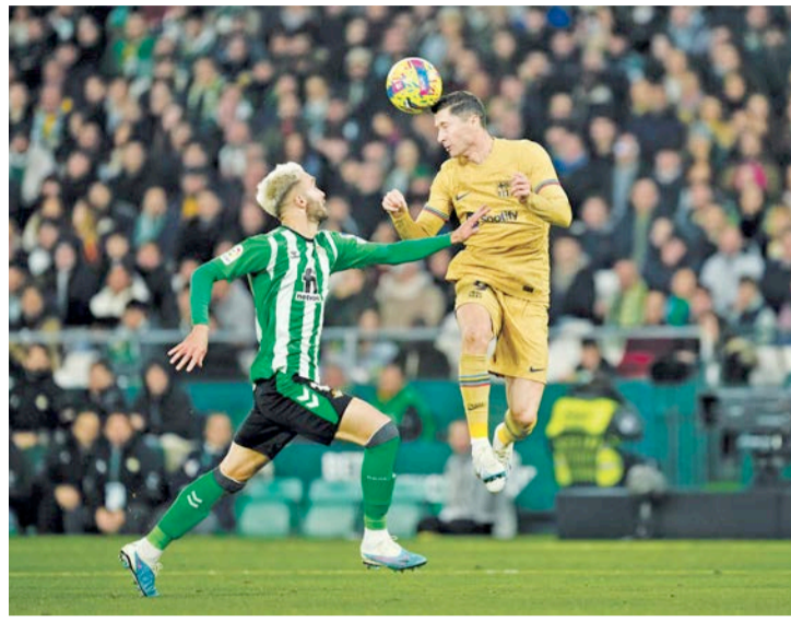
सेभिया ला लिगामा बार्सिलोनाका रोबर्ट लेवान्डोस्की (पहेँलो) को हेडर रोक्ने प्रयासमा रियल बेटिसका जर्मन फेज्जला।

उनले थपे, 'निकै कठिन अवस्थामा हामीले धेरै राम्रो प्रदर्शन गर्छौं। नतिजाप्रति मात्रै होइन, हामीले जसरी खेल्छौं, यसमा धेरै खुसी