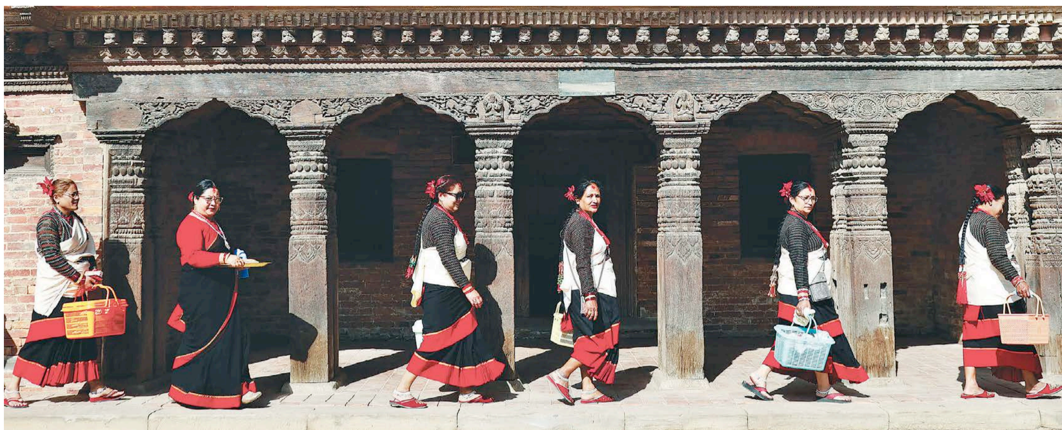
भीमसेन जात्राका अवसरमा बिहीवार ललितपुरको पाटन दरबार क्षेत्रमा परम्परागत नेवारी पोसाकमा महिला। टोलटोलमा रहेका भीमसेनका मन्दिरमा पूजाआजा गर्दै यो पर्व मनाइन्छ।