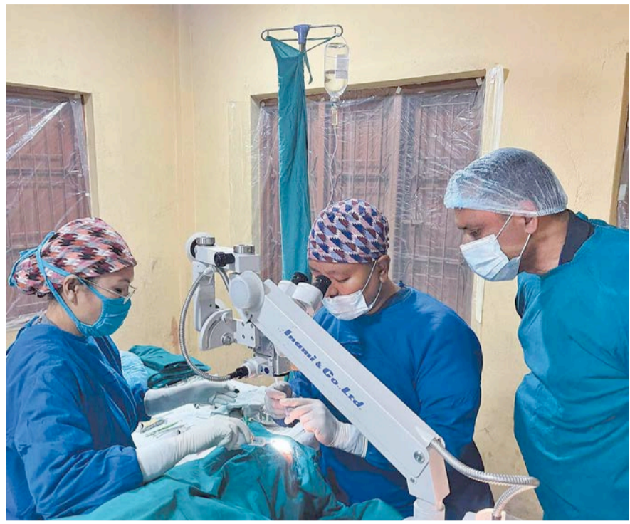
पाल्पाको पूर्वखोला गाउँपालिका-३, रिङनेरह पूर्वखोलामा आयोजित शिविरमा वृद्धवृद्धाको आँखा चेकजाँच तथा शल्यक्रिया गरिँदै ।