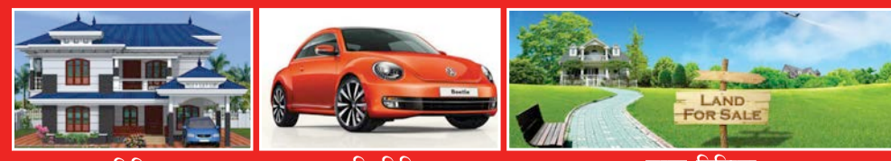
घर बिक्रीमा गाडि बिक्रीमा जग्गा बिक्रीमा

श्याम स्वेत: रु. ३०००/-* स्पट कलर: रु. ३५००/-* मल्टि कलर: रु. ५०००/-*