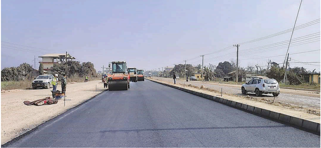
पूर्वपश्चिम राजमार्गअन्तर्गत पूर्वी नवलपरासीको भेंडावारीदेखि पश्चिम हर्कपुरसम्म ११ सय मिटर एक लेन सडक कालोपत्र गरिँदै। चिनियाँ ठेकेदार कम्पनीले काम थालेको ४३ महिनापछि यो सडक कालोपत्र गरेको हो।

गत साउनमा निर्माण सम्पन्न गर्नुपर्ने १ सय १४ किलोमिटर सडकखण्डको बुधबारसम्म २३ प्रतिशत मात्र काम