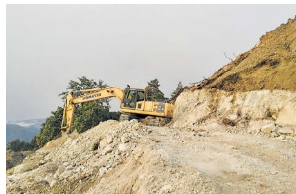
लमजुङको बागलुडपानी-घलेगाउँ सडक फराकिलो बनाइँदै।