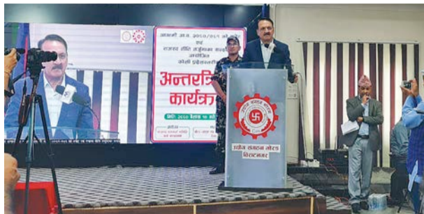
तस्विर : कान्तिपुर

निजी, राजनीतिक र कर्मचारी क्षेत्रले हरेक विषयमा विज्ञता मात्र प्रदर्शन गर्ने तर अपनो जिम्मेवारी पूरा नगर्दा मुलुक समस्यामा परेको उनको भनाइ छ।