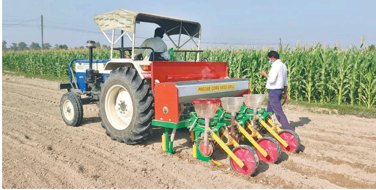
प्रिसिजन मेज प्लान्टरबाट मकैको वीउ छर्दै जितपुर सिमरा उपमहानगरपालिका-११ खेडीलका किसान।