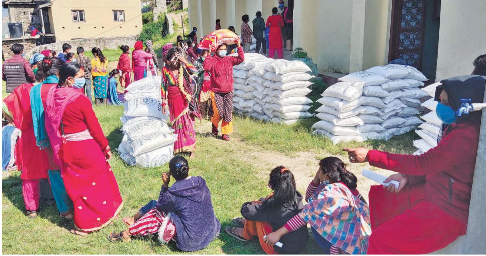
खाना भनेकै सेतो चामल

लेक र घरनाजिक उनको पाखोवारीमा ३ बोरा मकै, २ बोरा कोदो, ३ बोरा आलु, ५० बोरा फापर र ४० किलो सिमी पनि उत्पादन भएको छ तर उनी तिनलाई खाद्यान्नका रूपमा लिंदैनन्। भन्छन्, 'खाना भनेको त भातै हो, त्यसैले अरू अन्न बेचेर पनि चामलै किन्छौं।' बाँकी पृष्ठ ११