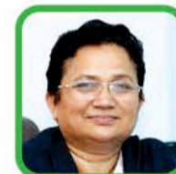
पम्फा मुसाल पूर्वऊर्जामन्त्री