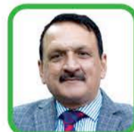
प्रकाशशरण महत अर्थमन्त्री