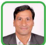
शक्ति बस्नेत ऊर्जामन्त्री