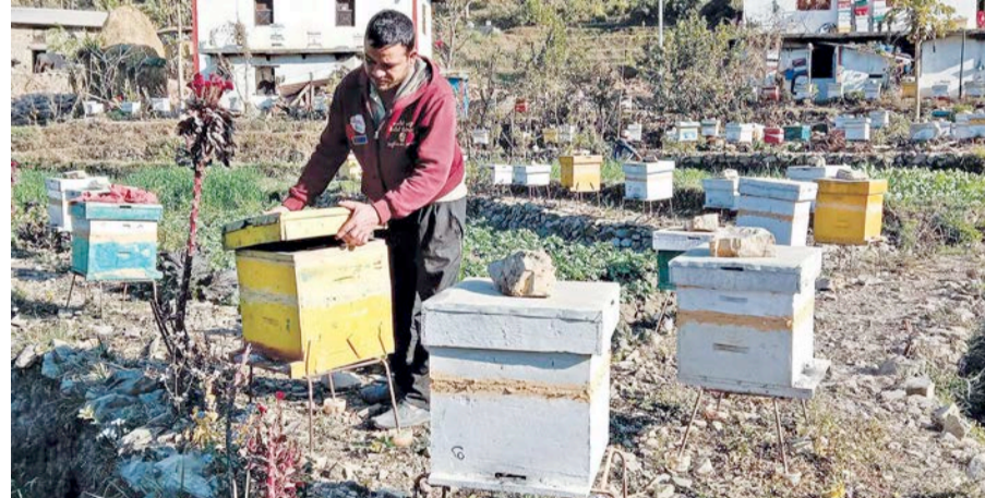
आफूले पालेका मोरीको रेखदेख गर्दै सल्यानको कालीमाटी गाउँपालिकाका किसान।