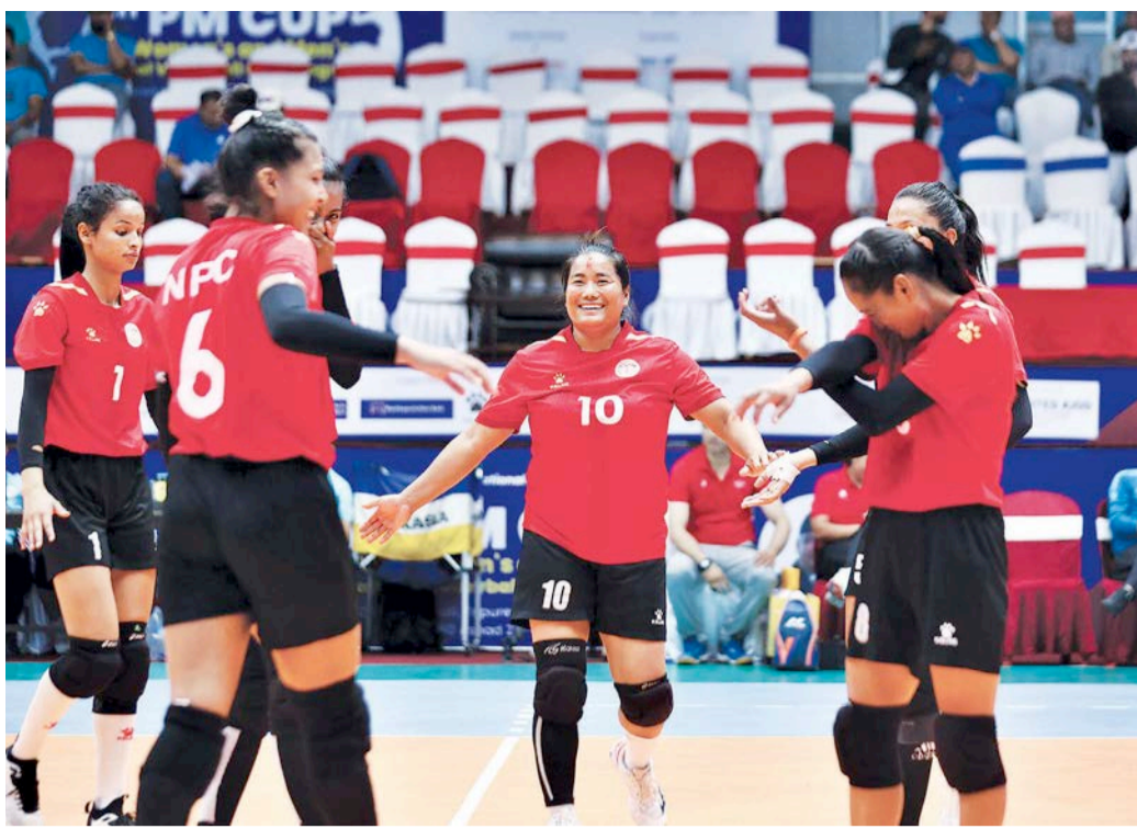
राष्ट्रिय लिग भलिबलको महिलातर्फ गण्डकी प्रदेशविरुद्ध अंक बटुलेपछि नेपाल पुलिस क्लबका खेलाडी।