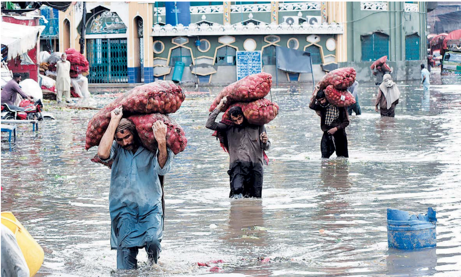
तस्बिर : सिन्द्धा

रूट नेदरल्यान्ड्समा सबैभन्दा बढी समय प्रधानमन्त्री हुने व्यक्ति समेत हुन्। उनी सन् २०१० देखि त्यहाँको प्रधानमन्त्री छन्। अहिलेको गठबन्धनको सरकार २०२२ को जनवरीमा मात्र गठन भएको हो। नेदरल्यान्ड्सको संसद १५० सदस्यीय रहेको छ भने सरकार बनाउन ७६ सांसदको समर्थन चाहिन्छ। रूटलाई भीभीडीका ३४ सहित ७७ सांसदको समर्थन थियो। गठबन्धनमा रहेका डी-६६ को २४, क्रिस्चियन डेमोक्रेटिक अपिलको १४ र क्रिस्चियन युनियनका ५ सांसद छन्। प्रतिपक्षमा पार्टी फर फ्रिडम (पीभीडी) का १७ सहित ७७ सांसद छन्। नेदरल्यान्ड्समा धेरै दलको प्रतिनिधित्व हुने भएकोले पनि एउटै दलले बहुमत ल्याउने अवस्था भने न्यून छ।