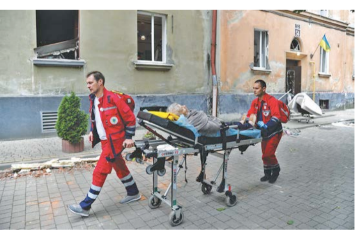
रुसी आक्रमणमा परी घाइते भएका युक्रेनको उद्धार गरिँदै।

किभ (एजेन्सी)- रुस र युक्रेनबीच युद्ध सुरु भएको ५ सय दिन पुगेको छ। रुसले सन् २०२२ फेब्रुअरी २४ मा युक्रेनमाथि आक्रमण सुरु गरेको थियो। त्यसयता मात्र युद्धमा मर्नेको संख्या ९ हजारभन्दा बढी पुगेको संयुक्त राष्ट्रसंघले जनाएको छ। राष्ट्रसंघका अनुसार मृत्यु हुनेमध्ये ५ सय बालबालिका छन् भने हजारौं व्यक्ति घाइते भएका छन्। युक्रेनस्थित संयुक्त राष्ट्रसंघीय मानवअधिकार अनुगमन मिसनले शुक्रवार यस्तो तथ्यांक सार्वजनिक गर्दै ठूलो मानवीय क्षति भएकामा दुःख व्यक्त गरेको छ। साथै मृत्यु भएकाहरूको यकिन संख्या सरकारी आधिकारिक तथ्यांकभन्दा धेरै नै हुन सक्ने उक्त संगठनले जनाएको छ। शनिवार मात्रै पूर्वी युक्रेनको लिमानमा रुसी आक्रमणमा परी ८ जनाको मृत्यु भएको वीवीसीले उल्लेख गरेको छ। रुसले पूर्वी दोनेत्स्कको आवासीय क्षेत्रमा मिसाइल आक्रमण गरेको हो। घटनामा १२ जना घाइते भएका छन्। यसअघि गत युक्रेनको पश्चिमी सहर ल्भिभमा विहीवार मिसाइल आक्रमणकै क्रममा १० जना मारिनुका साथै ३७ जना घाइते भएका थिए। गत जुन २७ मा पूर्वी युक्रेनको कामातेस्कमा रुसी सेनाको मिसाइल आक्रमणबाट चार बालबालिकासहित १२ जना नागरिक मारिएका थिए। रुसले गत वर्षको फेब्रुअरीमा युद्ध सुरु गर्दा चाँडै अन्त्य हुने अपेक्षा गरेको थियो। तर, १६ महिना बितिसक्दा पनि युद्ध सकिने