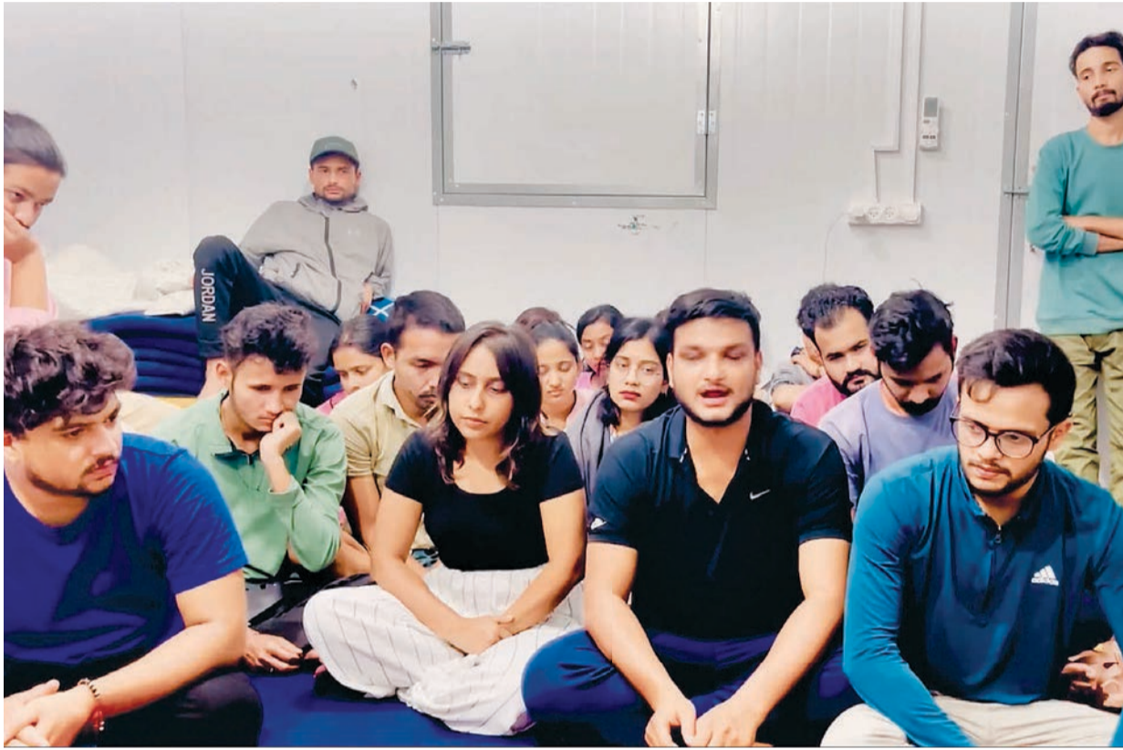
इजरायलको सुरक्षित स्थान मानिएको रामत नेगेभको कृषि फार्मा राखिएका ५५ नेपाली विद्यार्थी। उनीहरूलाई जोखिमयुक्त स्थान नैतिभोतको कृषि फार्माबाट सोमवार उद्धार गरिएको थियो।