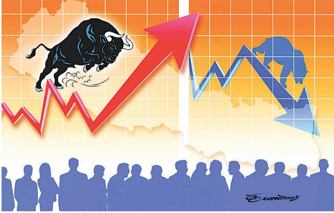
■ राज बजेट (काठमाडौं)

अघिल्लो वर्षको तुलनामा गत आर्थिक वर्षमा नेप्से परिसूचक घट्यो, कारोबार रकममा पनि उल्लेख्य गिरावट