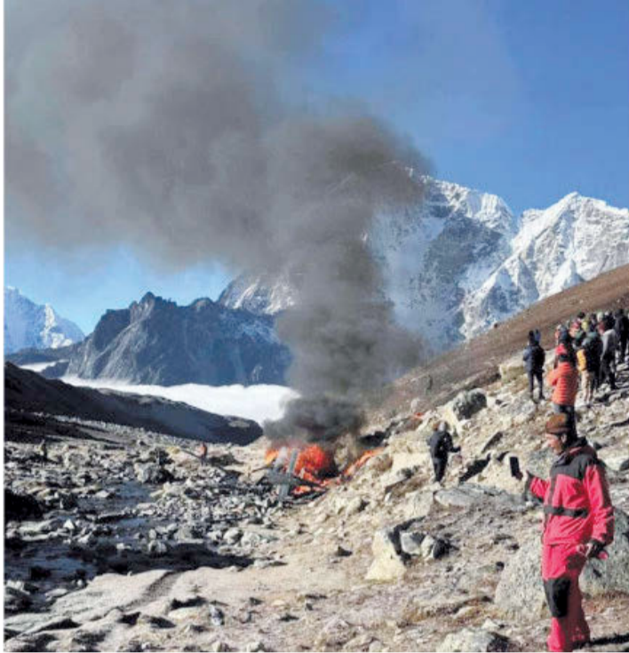
सोलुखुम्बुको लोबुचेमा शनिवार मनाइ एयरको दुर्घटना भएको हेलिकोप्टर।

शनिवारको दुर्घटनासँगै छोटो तथा दुर्गम उडानका लागि सहज मानिने हेलिकोप्टर दुर्घटना यो वर्ष सर्वाधिक भएको छ। मनाइको हेलिकोप्टर दुर्घटनासँगै