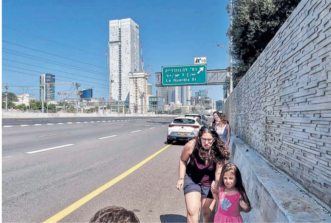
युद्धप्रस्त इजरायलको तेलअभिभवा शनिवार हवाई हमलाको पूर्वसूचना (साइरन) आएपछि सुरक्षित स्थानतिर भाग्दै स्थानीय।

विद्यार्थी लिन इजरायल पुगेका परराष्ट्रमन्त्री एनपी साउदले समकक्षीसँगको संवादमा पनि नेपाली विद्यार्थीको शव यथासक्य छिटो पठाउने व्यवस्था मिलाउन आग्रह गरेका थिए। बाँकी पृष्ठ ८