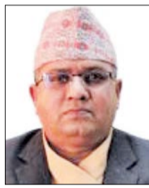
सुनसम्बन्धी प्रतिवेदन मन्त्रालयको अभिलेखमा हेर्दा कतै भेटिएन