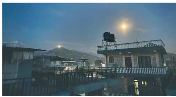
पोखराको संगमटोलबाट आवाको डाँडामा देखिएको हाई मास्ट लाइट।

नेपाल विद्युत् प्राधिकरणले 'उज्यालो सहर अभियान' अन्तर्गत पोखरा महानगरपालिकासँगको