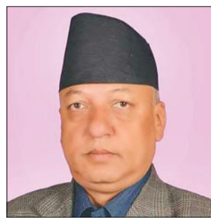
उम्मेदवार मनोनयनको अघिल्लो दिनसम्म आवश्यक रणनीति लिन्छौं, मतदाताको विश्लेषण भइरहेको छ

राष्ट्रिय सभा निर्वाचनलाई लक्षित गरी प्रमुख दलसँग वार्ताको ठोका खुले राखेको बताए। 'अहिले कोसँग वार्ता गर्ने भन्ने टुंगो छैन। एमालेलागत दलसँग छलफल गर्न सकिन्छ,'