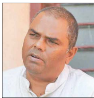
सम्मानजनक सिट बाँडफाँट हुनुपर्छ, समझदारी हुन नसके एमालेसँग छलफल गर्न सकिन्छ