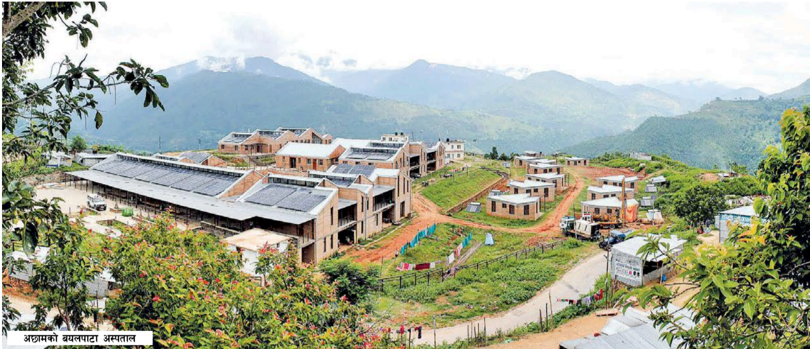
अख्तियारको बयलपाटा अस्पताल