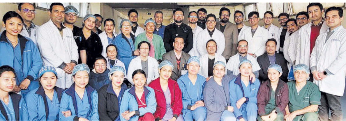
कलेजो प्रत्यारोपणमा संलग्न त्रिवि शिक्षण अस्पतालका स्वास्थ्यकर्मी । १० भन्दा बढी स्वास्थ्यकर्मीको टोलीले गत पुस २७ मा प्रत्यारोपण गरेको थियो ।

विश्वमै कठिन मानिने कलेजो प्रत्यारोपण नेपालमा २०७३ सालदेखि सुरु भएर पनि यसअघिसम्म विदेशी विज्ञहरूकै भर थियो