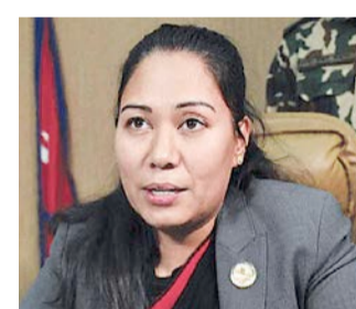
सुमना श्रेष्ठ, शिक्षामन्त्री

निजामती कर्मचारीसह सरकारी सूचनामा पहुँच हुने गरी उत्प्रेरकको नाममा 'वाहिरिया' को खटपटन गराउन लागिएको भन्दै शिक्षा मन्त्रालयका