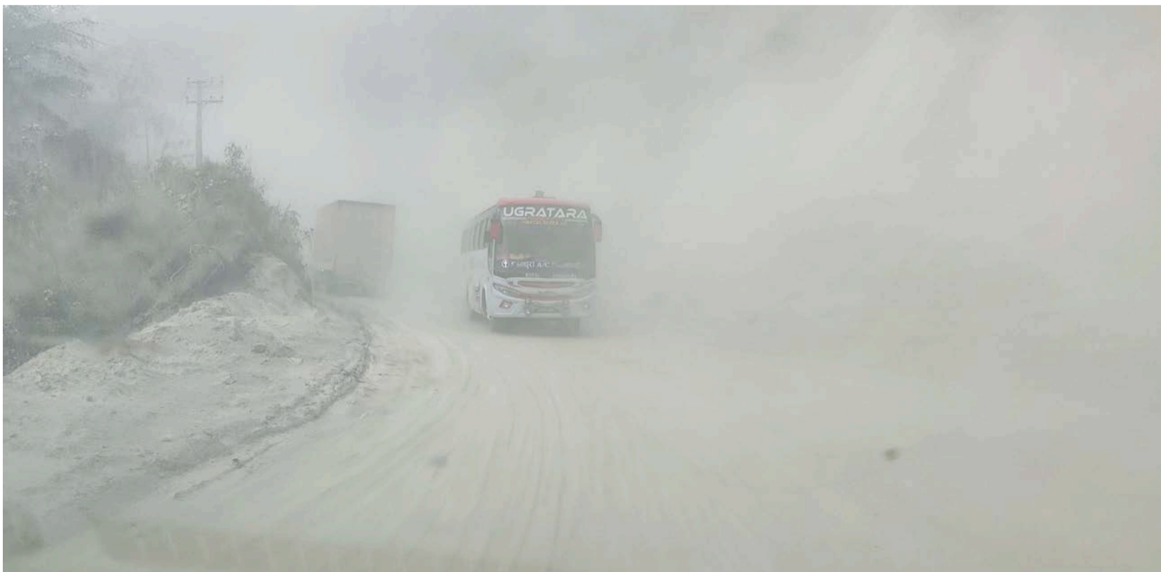
नारायणगढ-बुटवल सडकअन्तर्गत धुलामै दाउन्ने खण्डमा गुडिरहेका सवारी । दाउन्नेको १४ किमि खण्डमा सडक अस्तव्यस्त हुँदा यात्रुले सास्ती भोग्दै आएका छन् । धूलो उडेर नजिकैसमेत नदेखिँदा दिनुहुँजसो दुर्घटना हुने गरेको छ ।

दाउन्ने अड्यारो खण्ड भएकाले काम गर्ने गाह्रो भएको उनले सुनाए । उनले भने, 'बढी समस्या यही खण्डमा भएकाले एकैचोटि नभई ३ घण्टा पूर्वबाट पश्चिम आउने र ३ घण्टा पश्चिमबाट पूर्व जाने सवारी आवागमन रोकेर कामलाई गति दिन सुझाव दिएका छौं । बाँकी पृष्ठ >>>