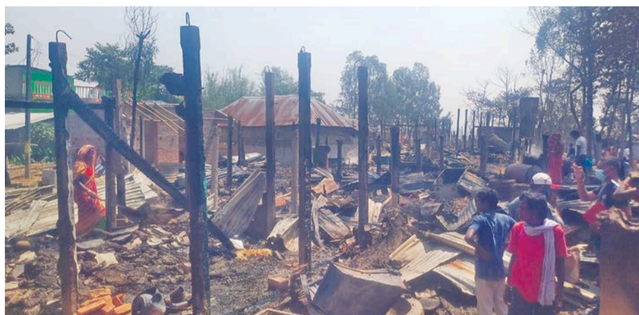
सप्तरीको महादेवा-१ चिमटीमा मंगलबार आगलागीमा जलेका घर।