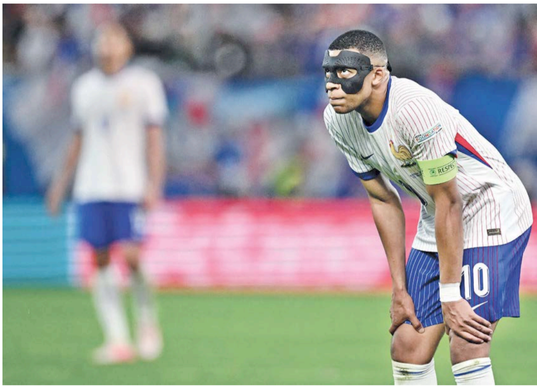
फ्रान्सका कप्तान केलियन एम्बाप्पेलाई पनि युरो २०२४ मा निसाना सही लगाउन गाह्रो परिरहेको छ ।

फ्रान्ससँग अत्यधिक प्रतिभाशाली खेलाडीको कुनै कमी छैन, तर पनि टिमले रोमाञ्चक फुटबल खेलेरहेको छैन