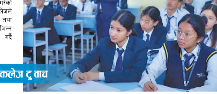
कलेज टु वाच

त्यसका साथै, कलेजले औपचारिक शिष्टाचारका कारण हाम्रो कलेजका