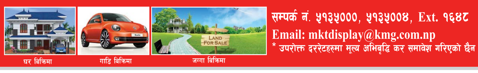
घर विक्रिमा, गाडी विक्रिमा, जग्गा विक्रिमा

श्याम स्वेत: रु. ३०००/-* स्पट कलर: रु. ३५००/-* मल्टि कलर: रु. ५०००/-* सम्पर्क नं. ५१३५०००, ५१३५००४, Ext. १६४८ Email: mktdisplay@kmg.com.np * उपरोक्त दररेटहरूमा मूल्य अभिवृद्धि कर समावेश गरिएको छैन ।