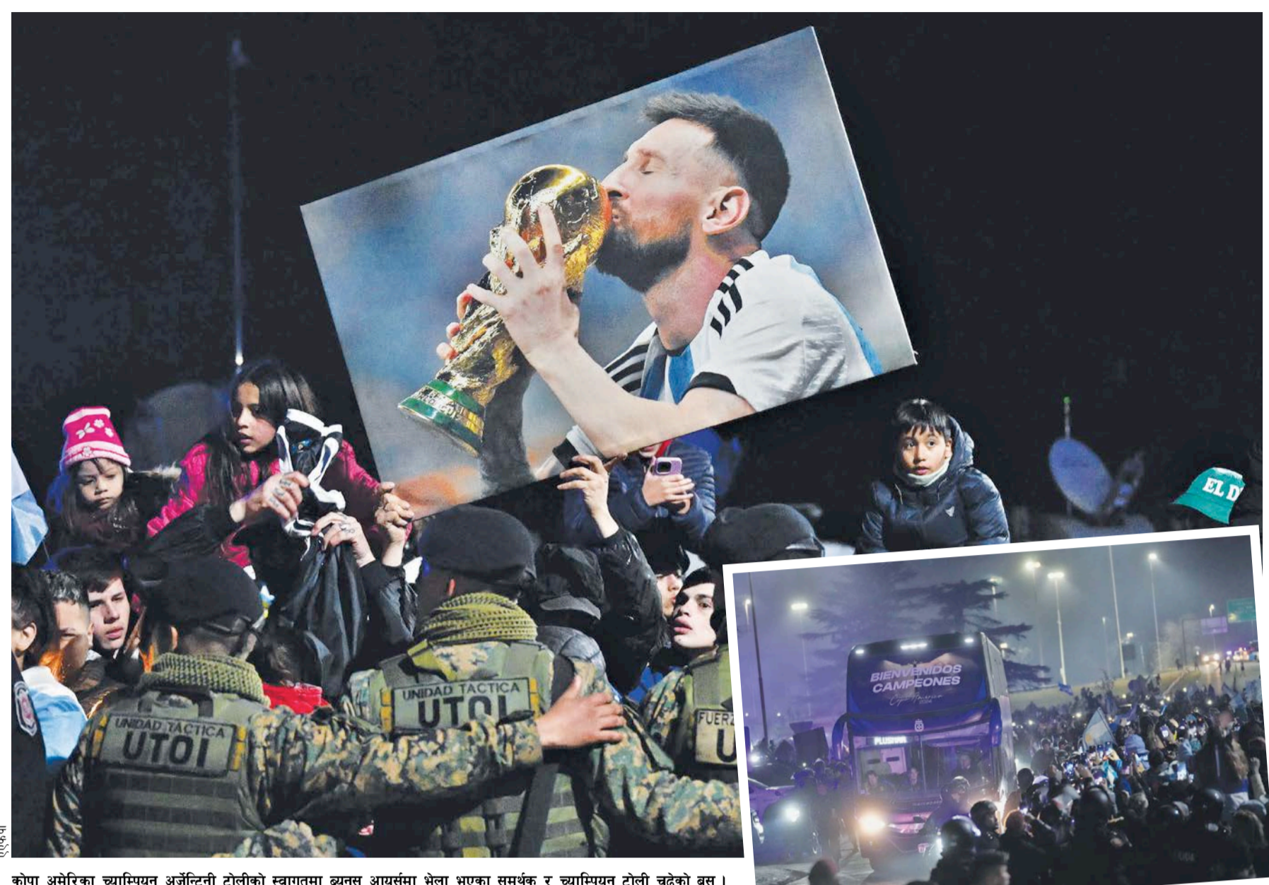
कोपा अमेरिका च्याम्पियन अर्जेन्टिनी टोलीको स्वागतमा ब्युनस आयर्समा भेला भएका समर्थक र च्याम्पियन टोली चढेको बस ।

अहिले धेरै अर्जेन्टिनीले आफ्नो दुःख बिर्सका छन् र कोपा अमेरिका जितमा हाँस्ने मौका पाएका छन्