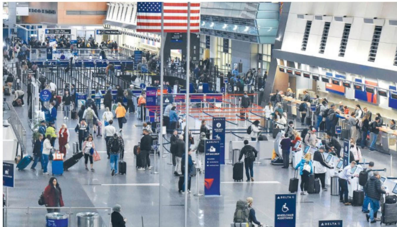
मानसुवेदसंस्थित बोस्टन लोगन अन्तर्राष्ट्रिय विमानस्थलमा 'चेकइन' गर्दै यात्रुकहरू । अमेरिकी सरकार 'सटडाउन' को अवस्थामा पुगेपछि यहाँको हवाई सेवा निकै प्रभावित हुँदै आएको छ । यसै सप्ताहलाई मात्रै हजारौं उडानहरू रद्द वा प्रभावित भएको बताइएको छ ।

सदनका रिपब्लिकन र डेमोक्रेट्सबीच बजेटका प्राथमिकता र स्वास्थ्य प्रावधानलाई लिएर मतान्तर हुँदा चालु आर्थिक वर्षका लागि नयाँ बजेटमा सहमति जुट्न सकेन । फलस्वरूप १ अक्टोबर २०२५ देखि अमेरिकी सरकारले इतिहासकै सबैभन्दा लामो 'सटडाउन' खेप्नुपरेको छ । आइतबार राति भएको मतदानमा नयाँ बजेटका पक्षमा विपक्षी ट डेमोक्रेटिक सिनेटरसहित ६० मत पुगेपछि ८० दिनदेखिको 'सटडाउन' अन्त्य हुने देखिएको छ ।