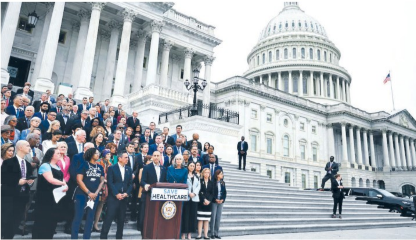
सरकारी 'सटडाउन' हुनु एकदिन अघि ३० सेप्टेम्बरमा अमेरिकीका वाणिज्य, डीसीस्थित क्यापिटल हिलमा रहेको संसद भवनअघि पत्रकार सम्मेलन गर्दै डेमोक्रेटिक सिनेटरहरू ।

बन्द गर्न सकिने अतिरिक्त विद्यार्थीको छ । कतिपय ठाउँमा यसको सेवा सुस्त बन्दै गएको छ । उचित व्यवस्थापनको अभावमा राष्ट्रिय पार्क बन्द छन् । र, एयर कन्ट्रोलसमा समस्या देखिएपछि 'फेडरल एभियसन एडमिनिस्ट्रेशन' (एफएए) ले उडान कटौती गरेको छ । 'सटडाउन' ले कूल गार्हस्थ्य उत्पादन बढिलाई सुस्त बनाएको छ । आर्थिक डेटा रिपोर्टिङ प्रभावित भएकाले धितोको अनुमान लगाउन विज्ञहरूलाई पनि मुस्किल पारिरेहेको छ ।