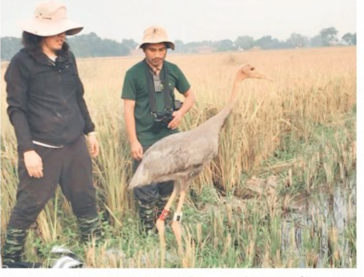
कपिलवस्तुमा सारसलाई 'जीपीएस ट्याग' जडान गरिँदै।

बल्ल पखेटा तान्न सिकेका आकर्षक बचेरा माउको अघिपछि गर्दै आहारा टिप्न सिक्दै छन्। विचकै दुर्लभ पन्डी सारसका बचेरा हुकिंगेर अहिले उड्न सक्ने भएका छन्। मिहिनेत र सघर्ष गरेर सारसले हुकिंगेरका बचेरा अब साता-दस दिनमा पहिलो उडानको तयारीमा हुँदा सारसबारे अध्ययन गर्न नेपालमा पहिलो पटक 'जीपीएस ट्याग' जडान गरिएको छ। रूपन्देहीमा तीन र कपिलवस्तुमा तीन बटामा करिव एक सय दिनका सारसमा 'जीपीएस ट्याग' र 'क्लर रिड' लगाइएको हो।