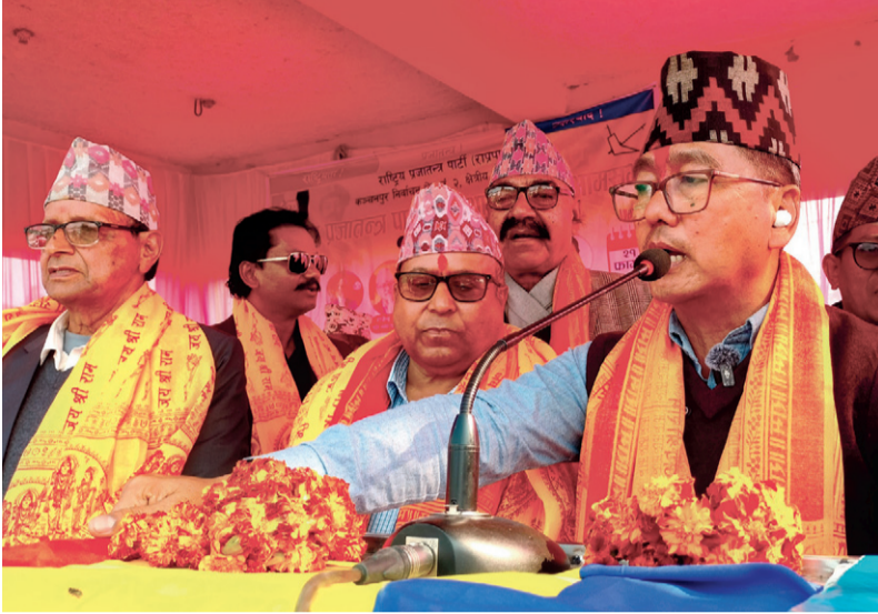
कञ्चनपुरमा मंगलबार आयोजित चुनावी सभामा राप्रपा अध्यक्ष राजेन्द्र लिड्डेन।

एमालेले अध्यक्ष केपी शर्मा ओली आफ्नै निर्वाचन क्षेत्र फाका-५ मा व्यस्त रहनेछन्। राष्ट्रिय स्वतन्त्र पार्टीका वरिष्ठ नेता बालेन्द्र शाह