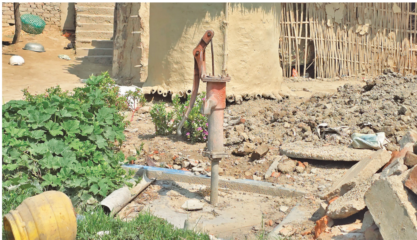
रौतहटको मौलापुर-६, पथराबुधराममा पानी आउन छाडेपछि बन्द भएको चापाकल।