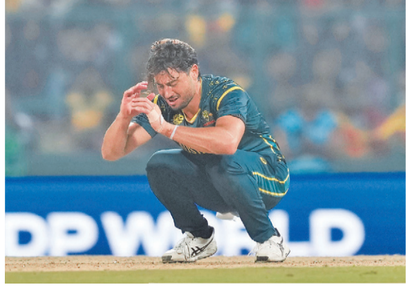
अस्ट्रेलियाका मार्क्स स्टोडिस।

मुम्बई- जिम्बावे र आयरल्यान्डबीच ट्वान्टी-२० विश्वकप अन्तर्गत समूह 'बी' को क्यान्डीमा हुनुपर्ने खेल वर्षा कारण रद्द भएपछि यसले प्रतियोगितामा अस्ट्रेलियाको यात्रा टुंग्याइएको छ। नतिजापछि जिम्बावे सुपर एटका लागि छनोट भएको छ। यो समूहबाट यसअघि नै सहआयोजक श्रीलंका अर्को चरण पुगिसकेको छ। अस्ट्रेलिया भने अब चाँडै घर फर्कनेछ। अस्ट्रेलियाले जिम्बावे र श्रीलंकाविरुद्धको खेलमा हार भोगेको थियो। टोलीका लागि यो हार निकै महँगो सावित भयो। जिम्बावेले अस्ट्रेलियालाई हराउनु जारी विश्वकपको अहिलेसम्मकै सबैभन्दा ठूलो अप्रत्यासित नतिजा मानिएको छ। अस्ट्रेलिया सन् २००९ यता पहिलो पटक ट्वान्टी-२० विश्वकपको दोस्रो चरण पुग्न अक्षम रह्यो। क्यान्डीमा हुनुपर्ने उक्त खेल भने वर्षाले एक बल पनि सम्भव भएन। यो नतिजापछि श्रीलंका ६ र जिम्बावे ५ अंकमा रह्यो। त्यस पछाडि आयरल्यान्डको ३ र अस्ट्रेलियाको २ अंक छ। ओमान भने अंकविहीन छ। अस्ट्रेलियाले हात पारेको एकमात्र जित आयरल्यान्डविरुद्ध हो। अब बिहीवार जिम्बावेले श्रीलंकाको सामना गर्नेछ। यो नतिजाले समूह विजेताको निर्णय गर्नेछ। शुक्रवार अस्ट्रेलियाको अन्तिम खेल ओमानविरुद्ध छ। यो नतिजाले समूहको समीकरणमा कुनै ठूलो परिवर्तन ल्याउने छैन। आयरल्यान्डले भने आफ्नो सबै चार खेल खेलेको छ। टोलीका लागि पनि अब घर फर्कने बाटो खुलेको छ।