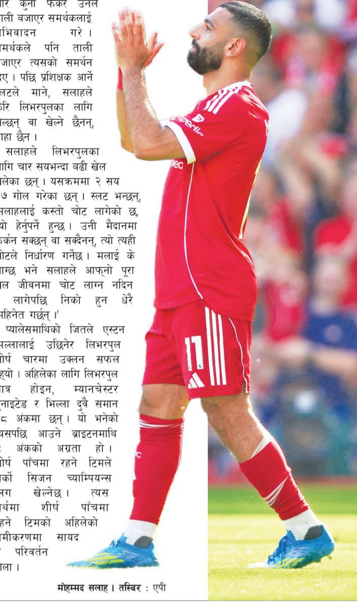
मोहम्मद सलाह।

सलाहले लिभरपुलका लागि चार सयभन्दा बढी खेल खेलेका छन्। यसक्रममा २ सय ५७ गोल गरेका छन्। स्लट भन्छन्, 'सलाहलाई कस्तो चोट लागेको छ, त्यो हेर्नुपर्ने हुन्छ। उनी मैदानमा फर्कन सक्छन् वा सक्दैनन्, त्यो त्यही चोटले निर्धारण गर्नेछ। मलाई के लाग्छ, भने सलाहले आफ्नो पूरा खेल जीवनमा चोट लाग्न नदिन र लागेपछि निको हुन धेरै मिहिनेत गर्छन्।' प्यालेसमाथिको जितले एस्टन भिल्लालाई उछिनेर लिभरपुल शीर्ष चारमा उक्लन सफल रह्यो। अहिलेका लागि लिभरपुल मात्र होइन, म्यानचेस्टर युनाइटेड र भिल्ला दुवै समान ५८ अंकमा छन्। यो भनेको त्यसपछि आउने ब्राइटनमाथि ८ अंकको अग्रता हो। शीर्ष पाँचमा रहने टिमले अर्को सिजन च्याम्पियन्स लिग खेल्नेछ। त्यस अर्थमा शीर्ष पाँचमा रहने टिमको अहिलेको समीकरणमा सायद नै परिवर्तन होला।