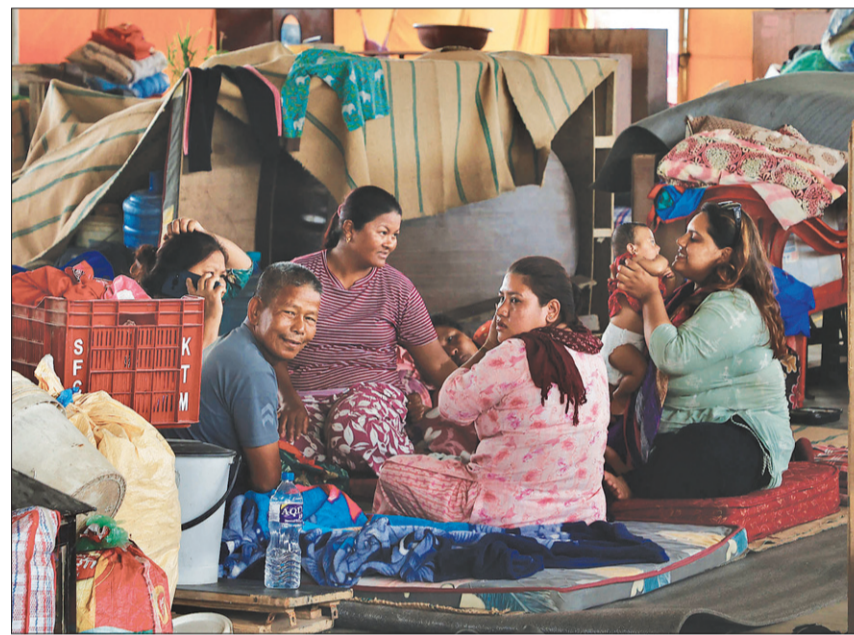
सुकुमवासी बस्तीमा डोजर लगाएर हटाइएपछि कीर्तिपुरस्थित राधास्वामी सत्संग नेपालको भवनमा राखिएका विस्थापित ।