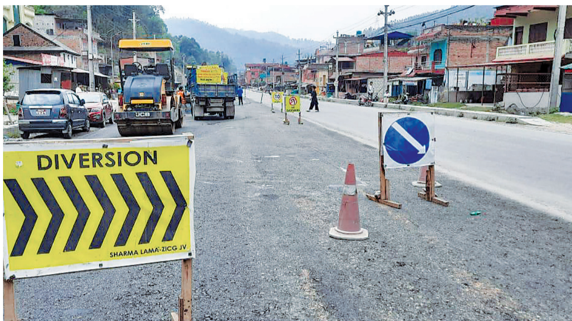
बिटुमिन अभावले कालोपत्र हुन नसकेपछि काम थप्प भएको नौबिसे-मलेखु सडक खण्ड ।

कालोपत्र गर्ने सिजनमै काम ठप्प बनेपछि राष्ट्रिय गौरव र रणनीतिक महत्त्वका आयोजनासमेत प्रभावित, चालु आर्थिक वर्षको लक्ष्य भेटाउन नसकिने आयोजना प्रमुखहरूको भनाइ