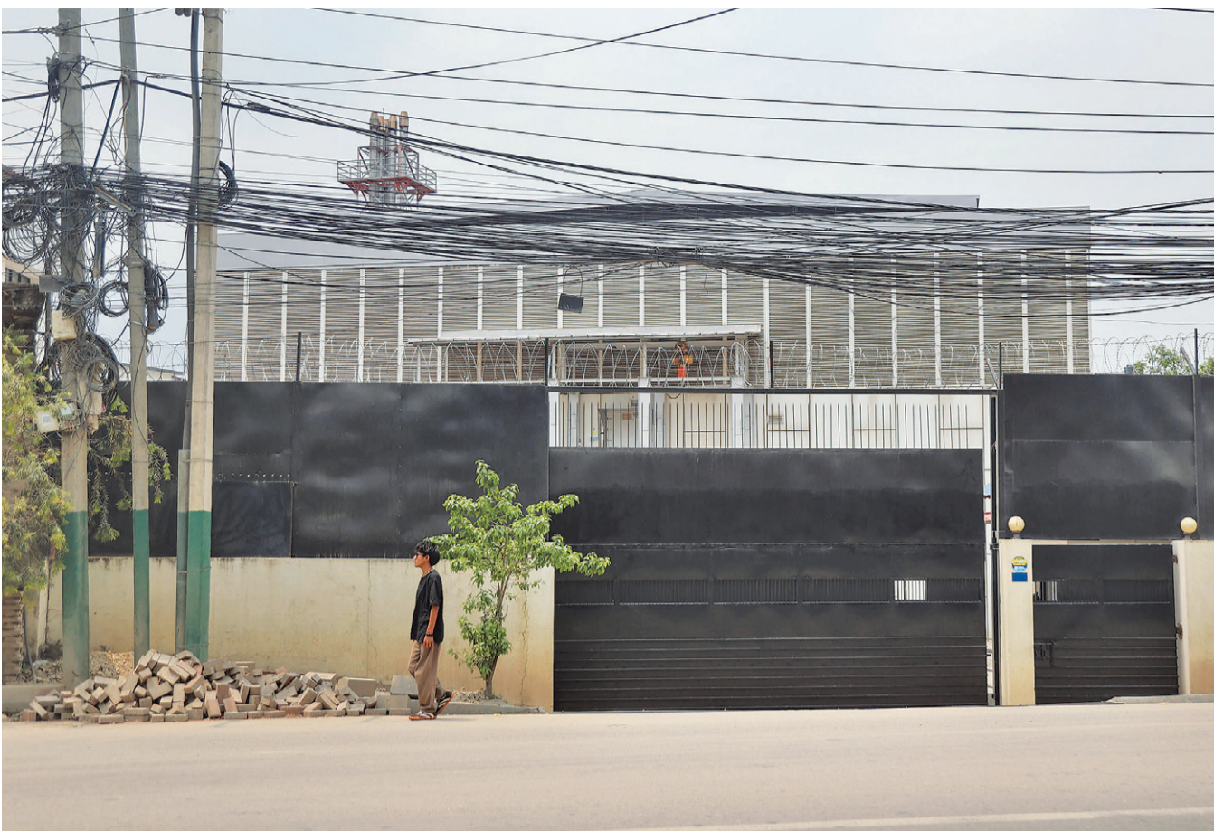
ललितपुरको नक्खुस्थित एनसेल डेटा सेन्टर ।

सत्तारूढ दलले अर्थतन्त्रलाई रूपान्तरण गर्न डेटा सेन्टरजस्ता डिजिटल पूर्वाधारमा जोड दिइरहेका, यी संरचनाहरू निर्माण हुने क्षेत्रका स्थानीय समुदायसँग तिनले पार्ने असरको विरोध गर्ने कुनै कानुनी आधार छैन