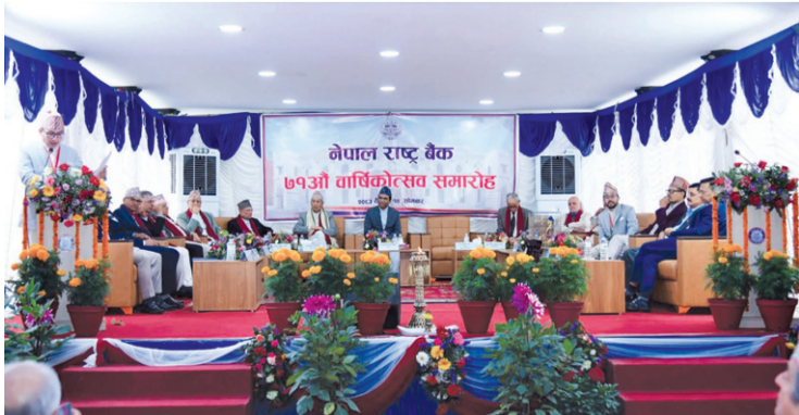
काठमाडौंमा सोमबार आयोजित नेपाल राष्ट्र बैंकको ७१ औं वार्षिकोत्सव समारोह।