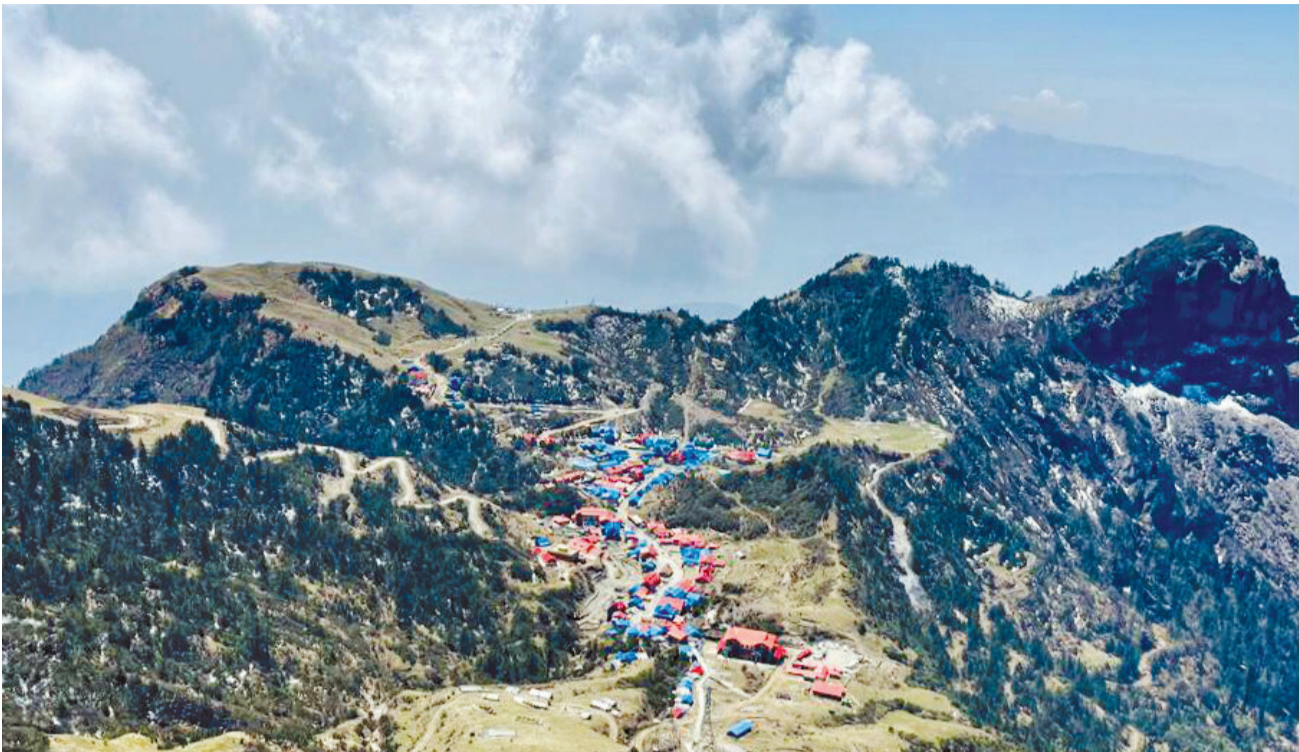
दोलखा कालिञ्चोकको फेदीमा रहेको कुरी बजार ।

त्यसैले अब गेजले अध्ययन गरेको समय रहेन । उतिबेला जनसंख्या निर्यात गर्ने पहाडले अब जनसंख्या निर्यात गर्न सक्दैन । पहाडमा सन्तान उत्पादनको क्रम न्यून भइसकेको छ । पहाडमा जन्मिएका बच्चाबच्ची हुर्कँदा अत्नै पुगिसकेका हुन्छन्- चाहे शिक्षाका लागि होस् वा स्वास्थ्यका लागि अथवा रोजगारीका लागि नै किन नहोस् । त्यसैले अब पहाड जनसंख्या निर्यात होइन, आयात गर्ने समयको प्रतीक्षामा छ । पहाड कसरी रित्तियो भने २०६८ को जनगणनामा २७ वटा