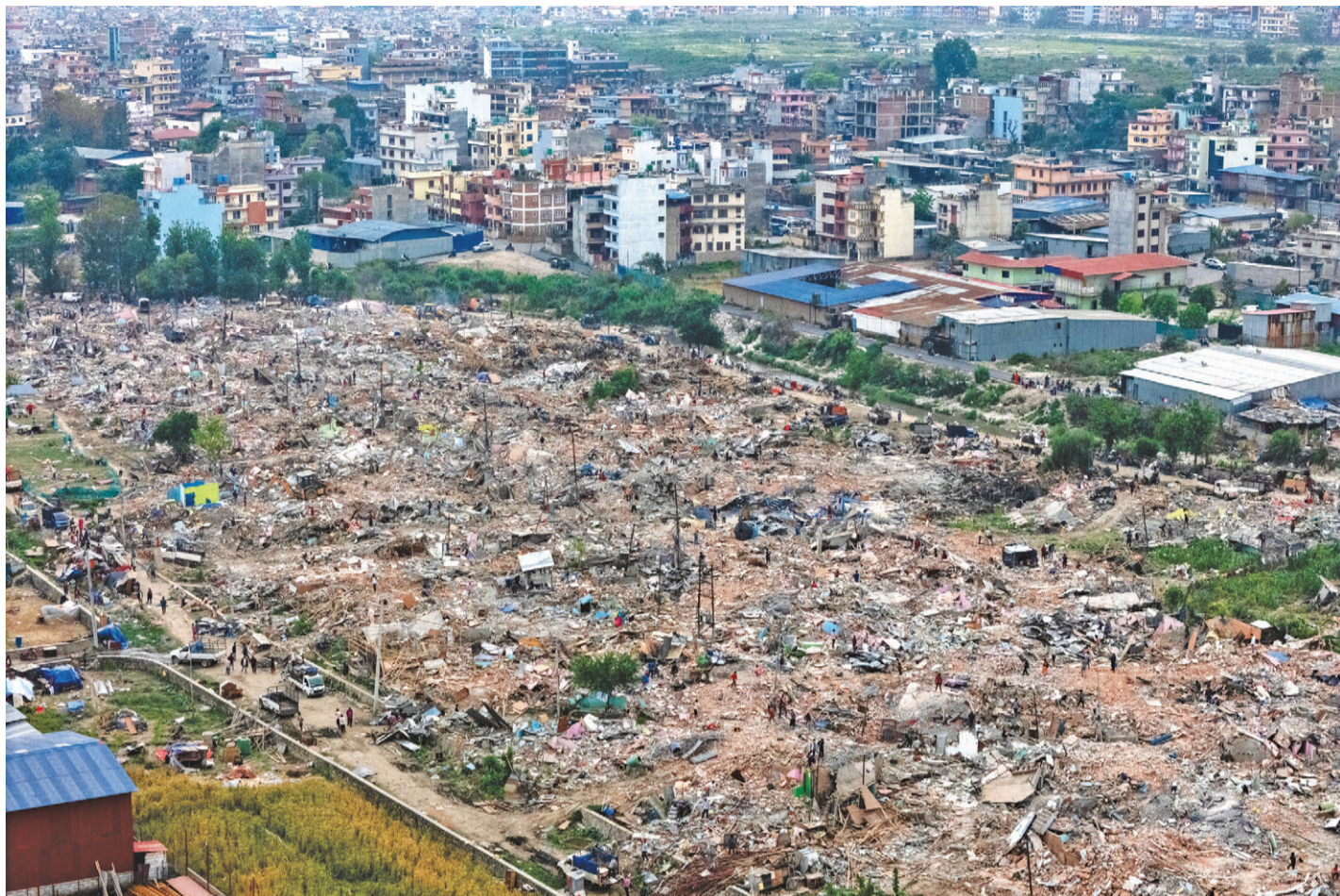
भक्तपुरको मनोहरस्थित सुकुमवासी बस्ती भत्काइएपछिको दृश्य ।

स्थानीय तहको कार्यक्षेत्रभित्र पर्ने विषयमा सेनाले तथ्यांक माग्नु संवैधानिक अभ्यास र संघीयताको मर्मविपरीत भएको मोरङ, सुनसरी, भ्रपा र बर्दियाका १३ पालिका प्रमुखहरूको भनाइ