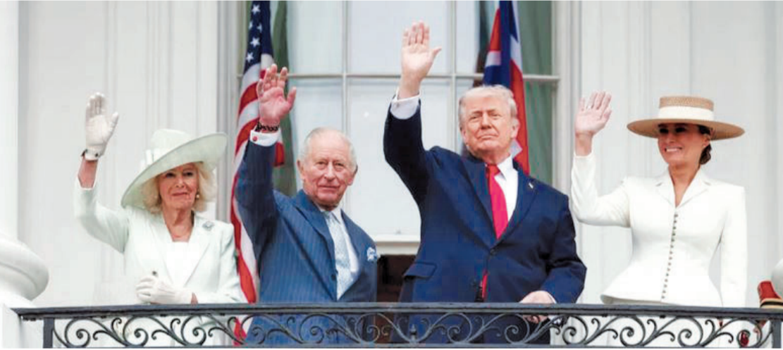
अमेरिकाको चारदिने भ्रमणका क्रममा ह्वाइट हाउसमा बेलायतका राजा चार्ल्स तृतीय तथा रानी क्यामिला, साथमा राष्ट्रपति डोनाल्ड ट्रम्प र पत्नी मेलनिया।

अमेरिकी संघीय संसद (कांग्रेस) लाई सम्बोधन गर्दै राजा चार्ल्सले लोकतान्त्रिक मूल्य, कानुनी शासन र शक्ति सन्तुलनको सिद्धान्तप्रति बेलायतको प्रतिबद्धता दोहोर्‍याए