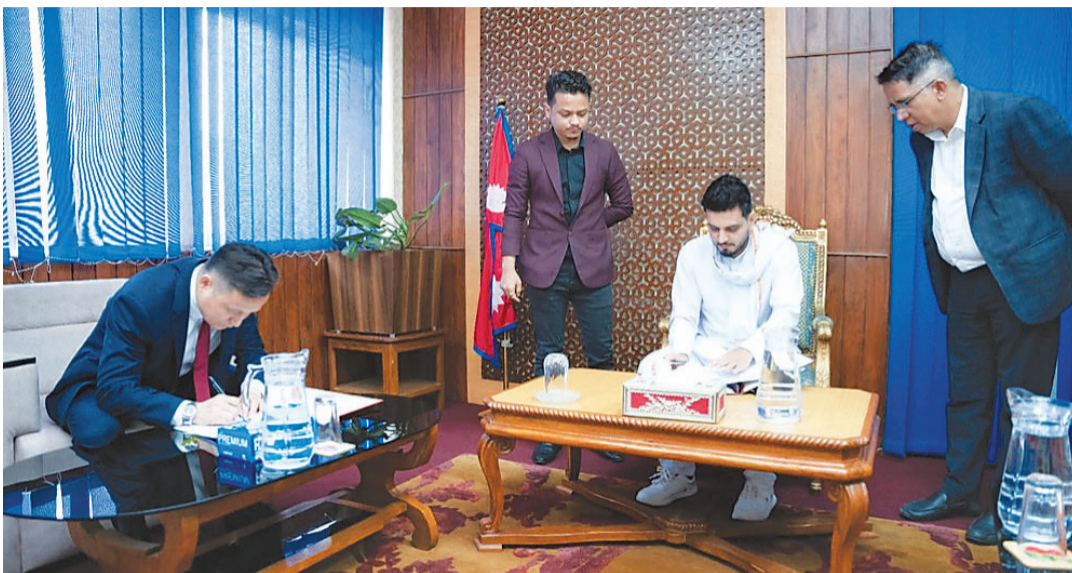
भौतिक पूर्वाधार तथा यातायात र सहरी विकासमन्त्री सुनील लम्साल र नेपालका लागि चिनियाँ राजदूत चाङ माओमिङ बुधवार सम्भौतापत्रमा हस्ताक्षर गर्दै।

चक्रपथ दोस्रो खण्ड विस्तारका लागि आयोजना कार्यान्वयन सम्भौतापत्रमा हस्ताक्षर भएको छ। यससँगै सडक विभागलाई ठेक्का प्रक्रिया अघि बढाउन बाटो खुलेको हो। भौतिक पूर्वाधार तथा यातायात र सहरी विकासमन्त्री सुनील लम्साल र नेपालका लागि चिनियाँ राजदूत चाङ माओमिङबीच बुधवार सम्भौतापत्रमा हस्ताक्षर भएको हो।