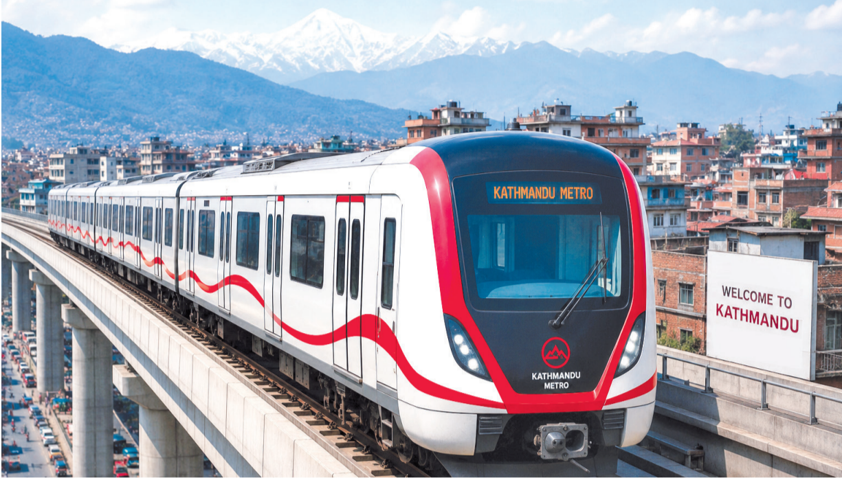
एआई निर्मित तस्वीर

मेट्रो रेल तथा मोनोरेल विकास आयोजनाले अन्तर्राष्ट्रिय परामर्शदाता छनोट गर्न १ असारसम्म समय राखेर १ जेठमा सूचना आहवान