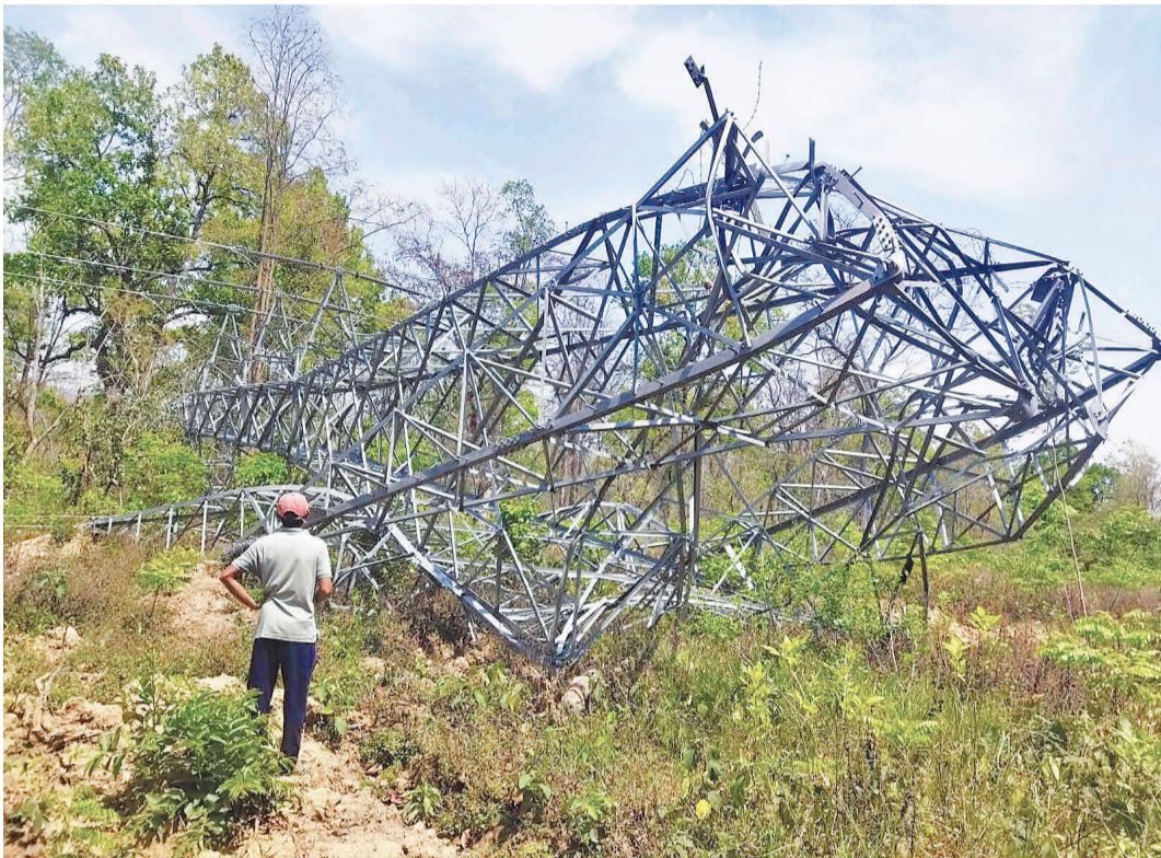
वैशाख अन्तिम साता आएको हावाहुरीका कारण ढलेको कोहलपुर-सुर्खेत १३२ केभी विद्युत् प्रसारण लाइनको टावर।