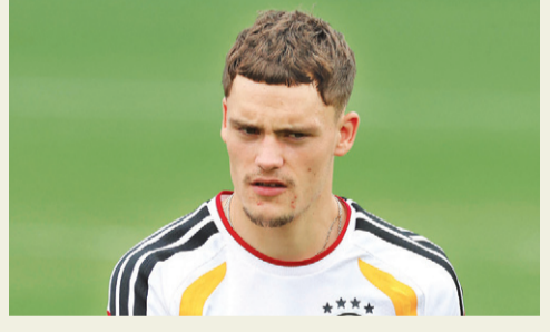
फ्लोरियन विट्ज (जर्मनी)

फ्लोरियन विट्ज पहिलो पटक विश्वकपमा खेल्नरहेका छन्। एसीएल चोटका कारण घोषित जर्मन टोलीमा भए पनि उनले २०२२ को विश्वकप गुमाएका थिए। २०२१ मा राष्ट्रिय टोलीबाट 'डेब्यु' गरेयता उनले निकै राम्रो प्रभाव पार्दै आएका छन्। तर जर्मन राष्ट्रिय टोलीबाट उनले आफ्नो पहिलो गोलका लागि २०२४ को मार्चसम्म कुनैपरेको थियो। जर्मनीले फ्रान्सविरुद्ध २-० को जित पाएको खेलमा विट्जले सात सेकेन्डमै गोल गरेका थिए, जुन जर्मन इतिहासकै सबैभन्दा छिटो भएको गोल हो। त्यसयता उनले राष्ट्रिय टोलीबाट ४१ खेलमा ११ गोल गरिसकेका छन्। २०२० मा वायर लेभरकुसेनबाट व्यावसायिक फुटबल खेल्न सुरु गरेपछि उनी जर्मन फुटबलको निकै ठूलो प्रतिभा बनेका थिए। उनी अहिले जर्मन फुटबलको सबैभन्दा राम्रा एट्याकिङ मिडीफल्डर मानिन्छन्। २०२३-२४ को सिजनमा लेभरकुसेनलाई अपराजित रहेर बुन्डेसलीगा उपाधि दिलाउँदा उनले ४९ खेलमा १८ गोल गरेका थिए। त्यसपछि २३ वर्ष उनी फुट्दै १२ करोड युरोमा लिभरपुल गए, जसले उनलाई विश्वकै छैटौँ महंगा खेलाडी बनाएको थियो। गत सिजनमा उनले लिभरपुलबाट ३३ खेलमा ५ गोल गरेका थिए।