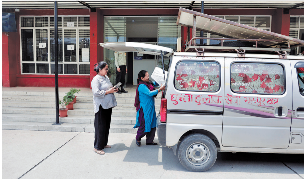
यातायात व्यवस्था विभागमा शुक्रबार स्मार्ट लाइसेन्स लिन आएका हुलाक सेवा विभागका कर्मचारी। हुलाकले लाइसेन्स लिएर विभिन्न जिल्लामा पठाउने गरेको छ।

पुरानो मितिका २९ लाख लाइसेन्समध्ये १८ लाख २ हजार २ सय ४८ छापियो