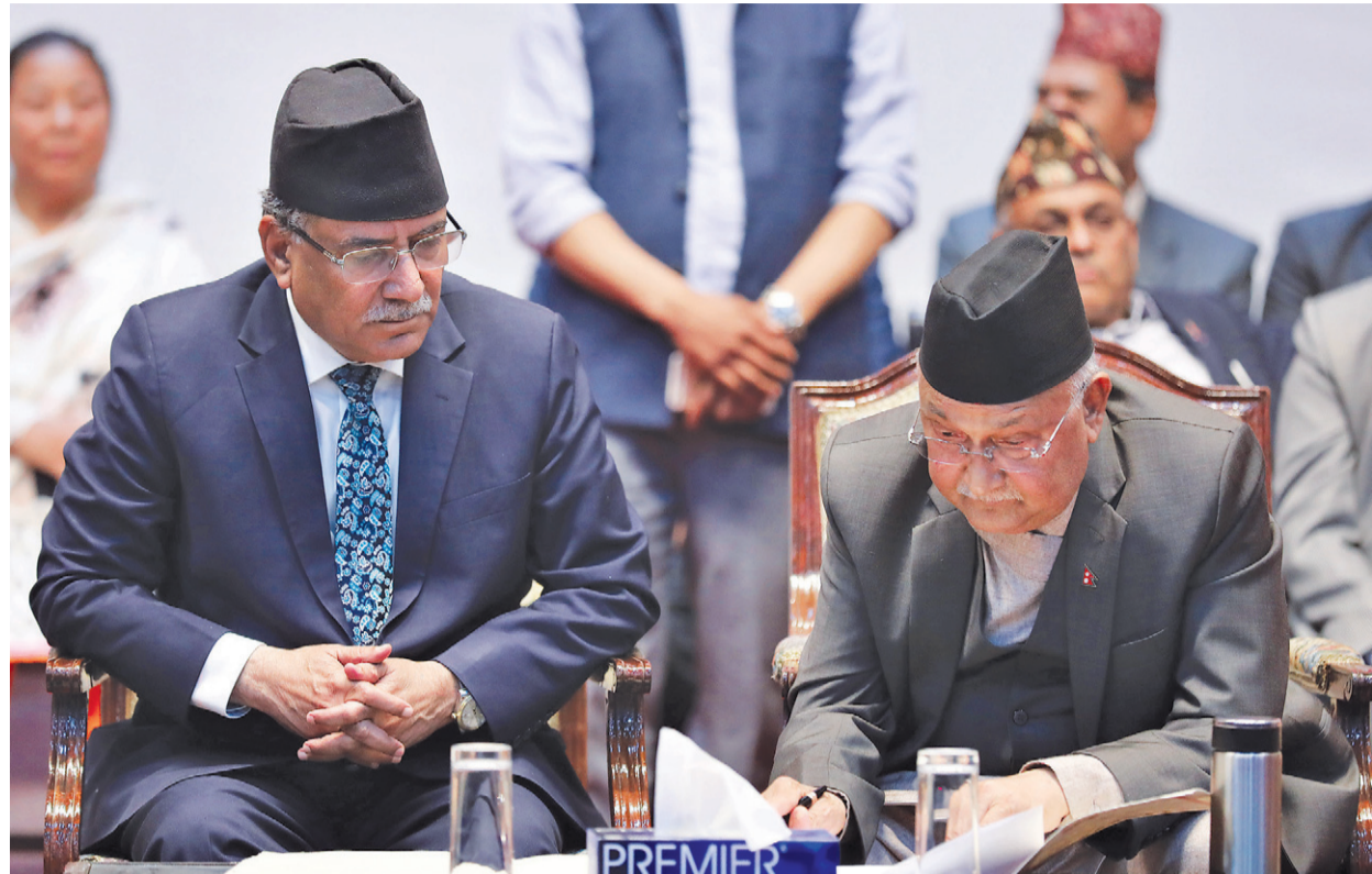
३ जेठ २०७५ मा एमाले र तत्कालीन माओवादीबीच पार्टी एकताको सहमतिपत्रमा हस्ताक्षर गरिँदै ।