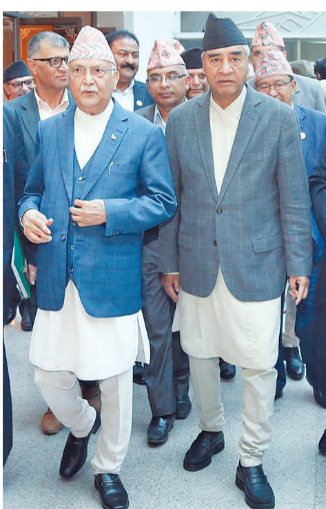
एमाले अध्यक्ष केपी शर्मा ओली ३० असार २०८१ मा प्रधानमन्त्रीमा दावी गर्न काठमाडौँमा तत्कालीन सभापति शेरबहादुर देउवासँग राष्ट्रपति कार्यालय जाँदै ।

ओलीले नयाँ संविधान लेखनलाई निष्कर्षमा पुर्‍याउन अधिकतम सहमति निर्माणमा भूमिका निर्वाह गरे । संविधान जारी भएपछि देशको नेतृत्व गर्ने उनको आकांक्षा थियो । संविधान घोषणा भएको तीन सातापछि, उनले प्रधानमन्त्रीको