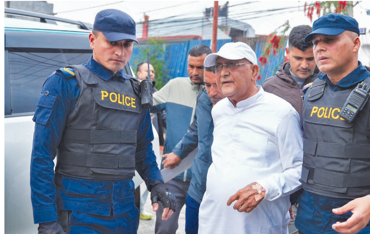
गत १४ चैतमा पकाउ परेका केपी शर्मा ओली सर्वोच्च अदालतको आदेशले २६ चैतमा रिहा भएको केही दिनपछि त्रिभुवन विश्वविद्यालयमा बाहिरिँदै ।

गत भदौको संकटका बेला प्रधानमन्त्रीबाट राजीनामा दिन सुभाव आउँदा सुरुमा ओली भन्दै थिए, 'म राजीनामा दिनेवाला छैन', २१ फागुनको चुनावमा लज्जास्पद पराजयपछि पार्टीभित्र नेतृत्व परिवर्तनको आवाज उठिरहेका बेला उनी भन्दै छन्, 'बीचमै भोला फालेर म हिँड्दिन'