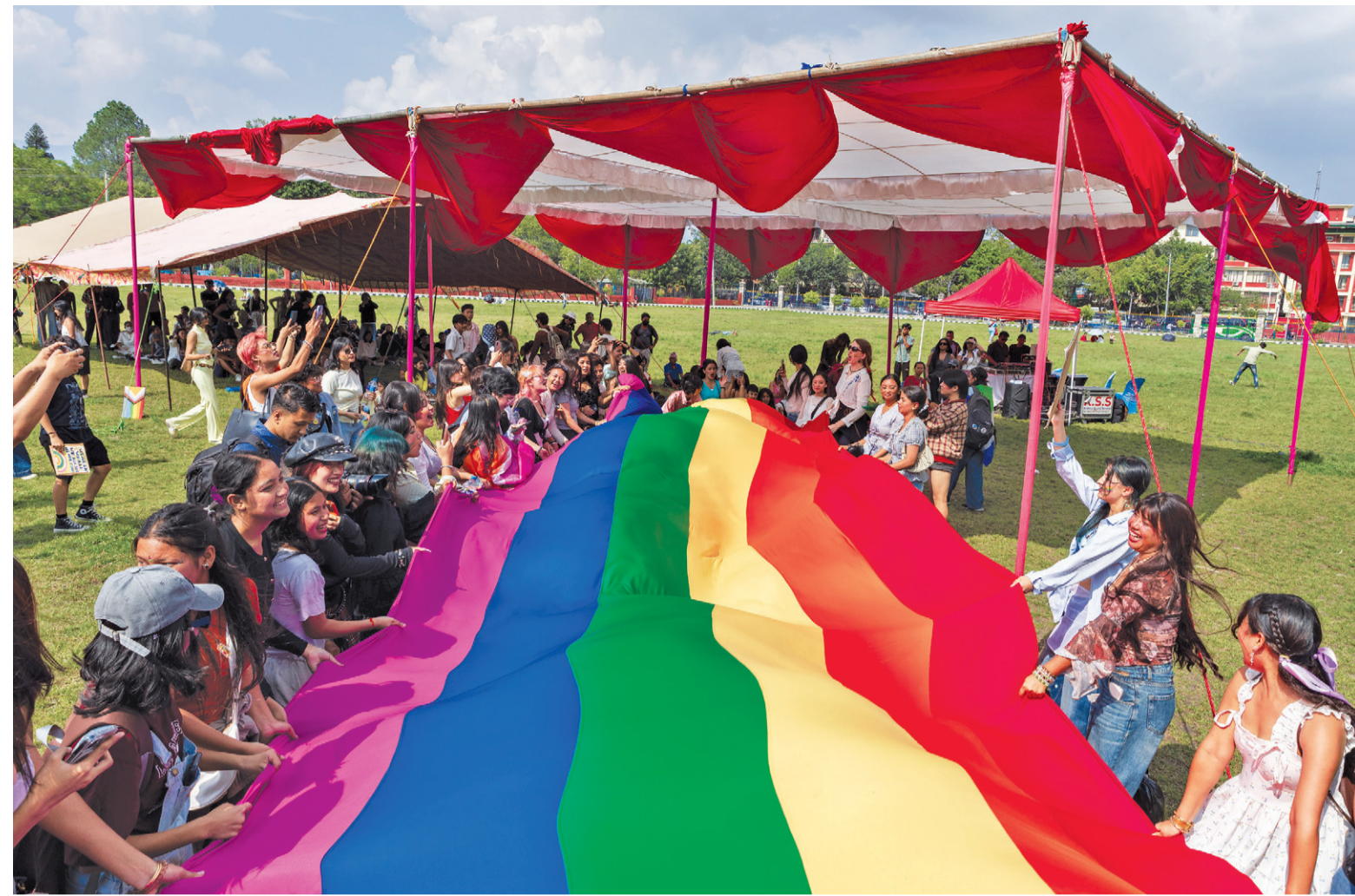
काठमाडौंमा शनिवार आयोजित 'प्राइड परेड' मा सहभागी यौनिक तथा अल्पसंख्यक समुदाय र सर्वसाधारण ।