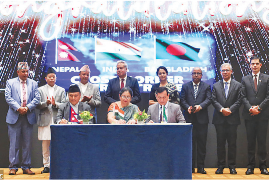
नेपालमा उत्पादित बिजुली बंगलादेशमा विक्री गर्न असोज २०८१ मा त्रिपक्षीय सम्झौतापत्रमा हस्ताक्षर गर्दै नेपाल विद्युत् प्राधिकरण, भारतको एनटीपीसी विद्युत् व्यापार निगम र बंगलादेश पावर डेभलपमेन्ट बोर्डका अधिकारीहरू। फाइल तस्बिर : कान्तिपुर

यसपल्ट ४० मेगावाट मात्रै बिजुली बंगलादेश पठाइने