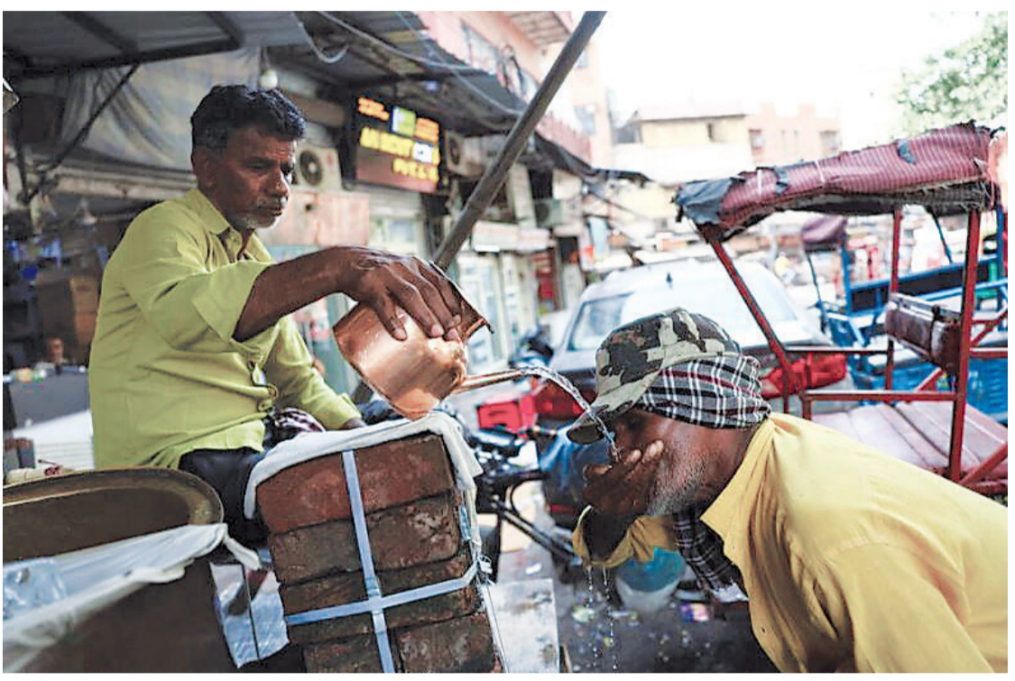
भारतको राजधानी नयाँदिल्लीमा गर्मी बढेसँगै नि:शुल्क वाडिएको पानी पिउँदै रिक्ता चालक।