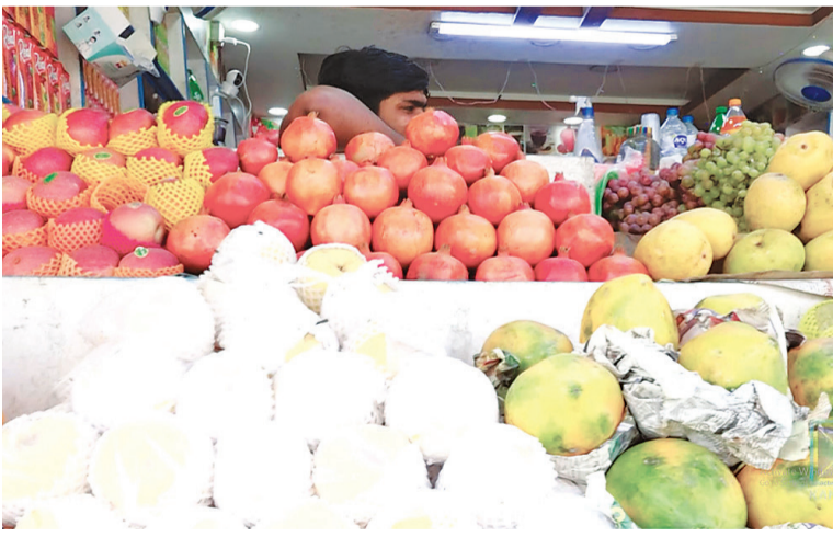
तिस्वर : कान्तिपुर

नेपालमा पोषणसम्बन्धी विभिन्न निकायले प्रतिव्यक्ति वार्षिक ९१ देखि ९२ लिटर दूध