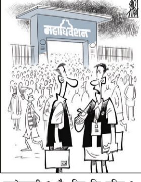
उम्मेदवारी ? छै, विम् कि नदिम् ?... सांसदमा जित्ने जस्तो सजिलै जित्न सकिएला र, मान्यज्यू ?