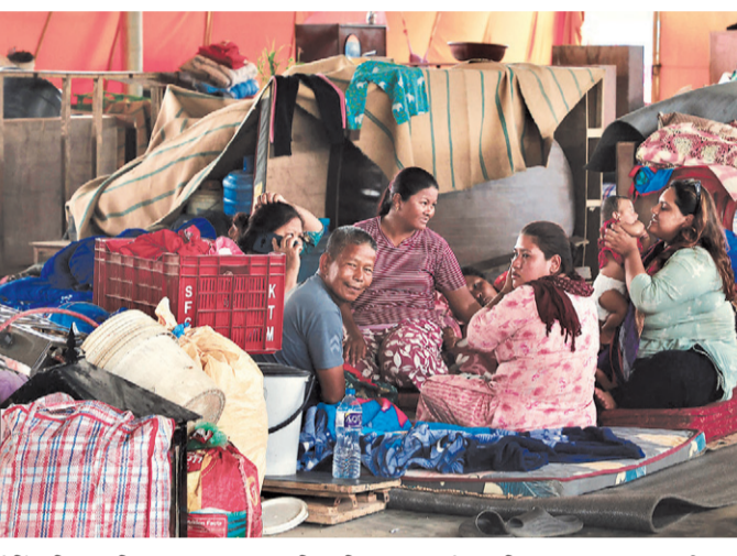
कीर्तिपुरस्थित होलिडिड सेन्टरमा रहेका विस्थापित सुकुमवासी ।

विस्थापित सुकुमवासी भन्ने अन्यायमा, भन्छन्, 'सरकारबाट जग्गा पाइएला भन्ने आस गरिरहेका बेला बसिरहेको ठाउँसमेत छाडनुपर्ने भयो, कहाँ जाने ? के गर्ने ? चिन्तामा पन्यौ'