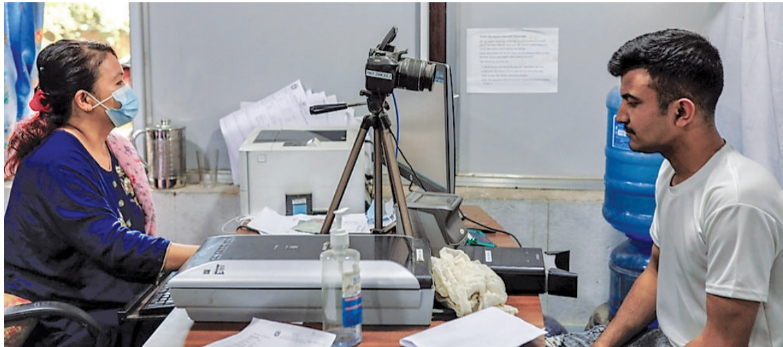
राष्ट्रिय परिचयपत्र बनाउन तस्वीर खिच्दै।