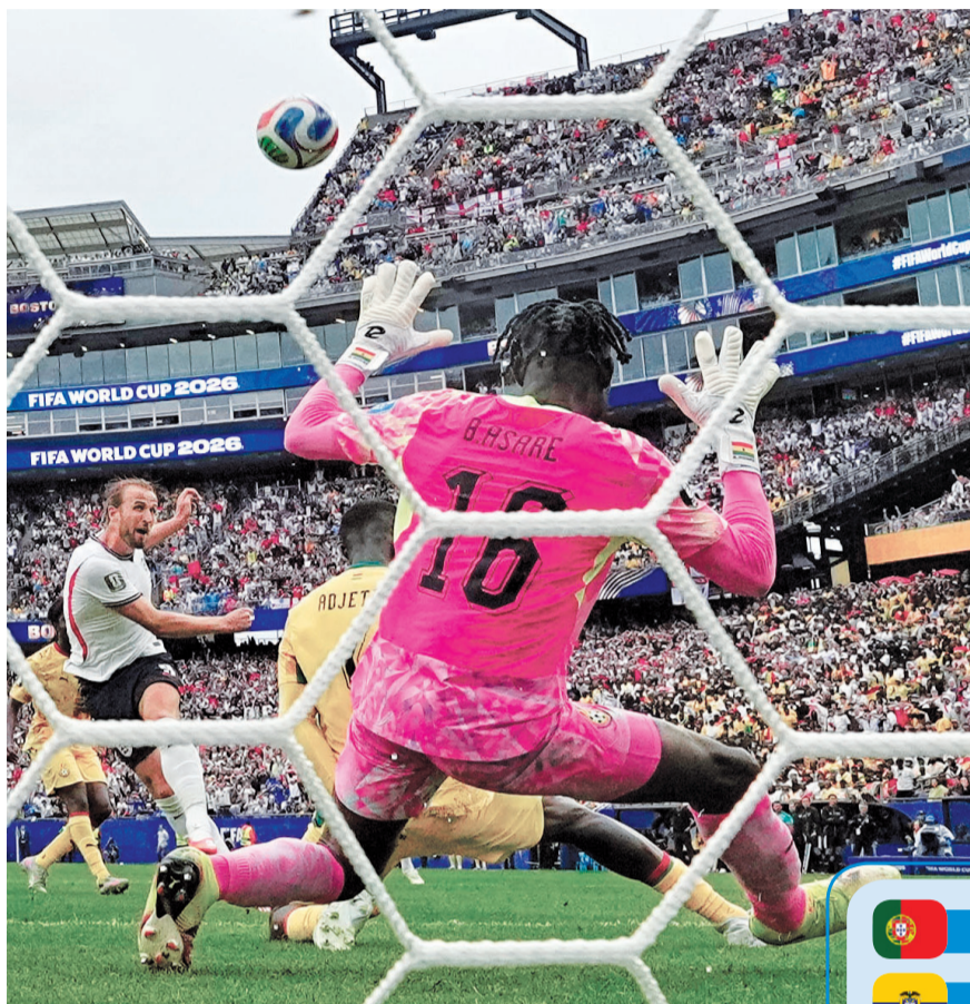
घानाविरुद्ध गोलको प्रयास गर्दै इंग्ल्यान्डका ह्यारी केन।

खेलिरहेको इरान सुरुआती दुवै खेलमा अपराजित छ। यी दुई बराबरीका लागि इरानले सबैको राम्रो खेलेको छ। लगातार तेस्रो बराबरीले पनि इरानलाई नकआउट चरण पुग्नेछ, उल्कट एक