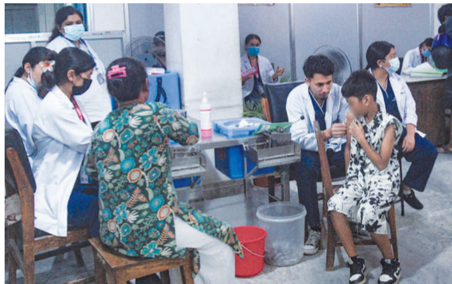
काठमाडौंको टेकुस्थित शुक्रराज ट्रिपिकल तथा सरुवा रोग अस्पतालमा केही दिनअघि रेबिजको खोप लगाइँदै।

देशभरका सरकारी अस्पतालमा रेबिजविरुद्धको खोपको चरम अभाव भए पनि यसबारे सूचना बाहिर ल्याउन स्वास्थ्य तथा खाद्य सुरक्षा मन्त्रालयले कडा रोक लगाएको