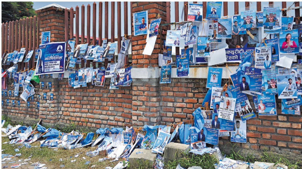
चितवनमा जारी रास्वपाको महाधिवेशनस्थलमा जथाभावी छरफट्ट प्रचार सामग्री र महाधिवेशन प्रतिनिधिहरू।