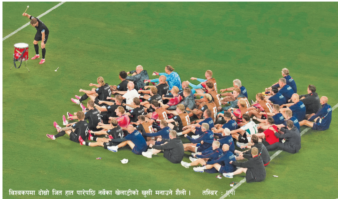
विश्वकपमा दोस्रो जित हात पारेपछि नर्वेका खेलाडीको खुसी मनाउने शैली।

विश्वकप २०२६ को लिग चरणमा सबैले समान दुई खेल खेल्दा सम्भवतः यी मोडहरू उत्कृष्ट हुन सक्छन्