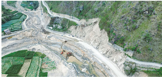
बाढीले क्षति गरेको बीपी राजमार्ग।