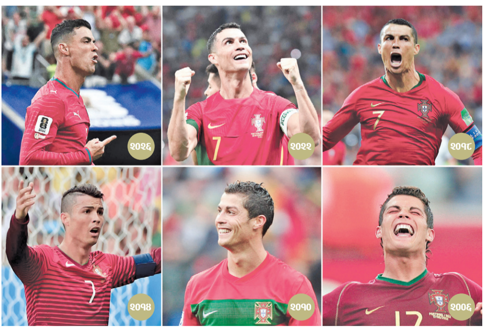
६ फरक विश्वकपमा गोल गर्दा पोर्चुगलका क्रिस्टियानो रोनाल्डो।