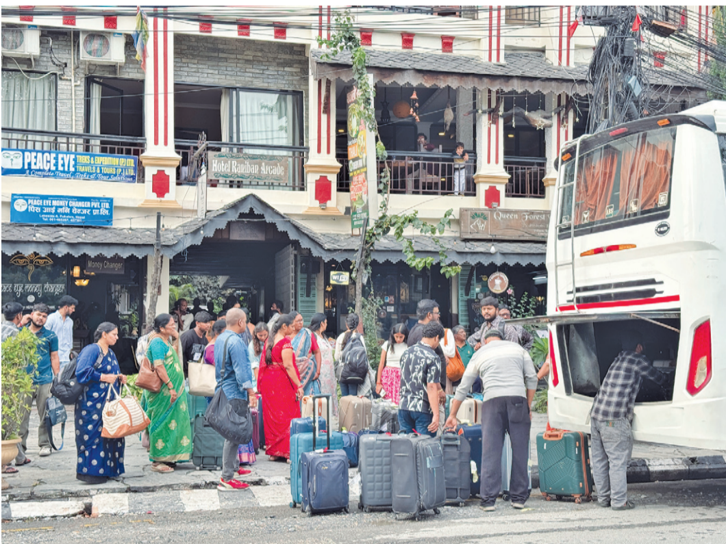
पोखराको लेक्साइडमा भारतीय पर्यटक ।