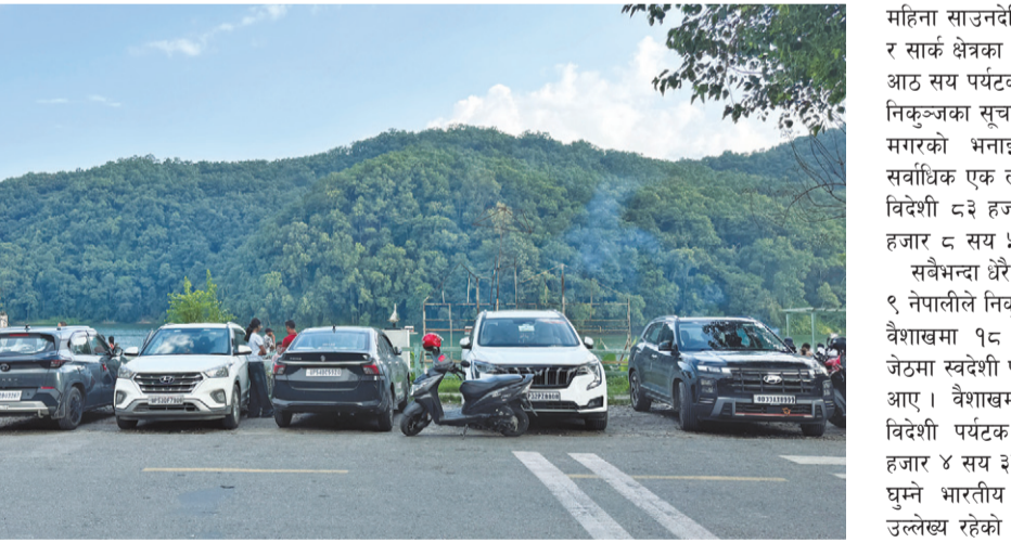
लेकसाइडमा भारतीय सवारीसाधनको लस्कर।