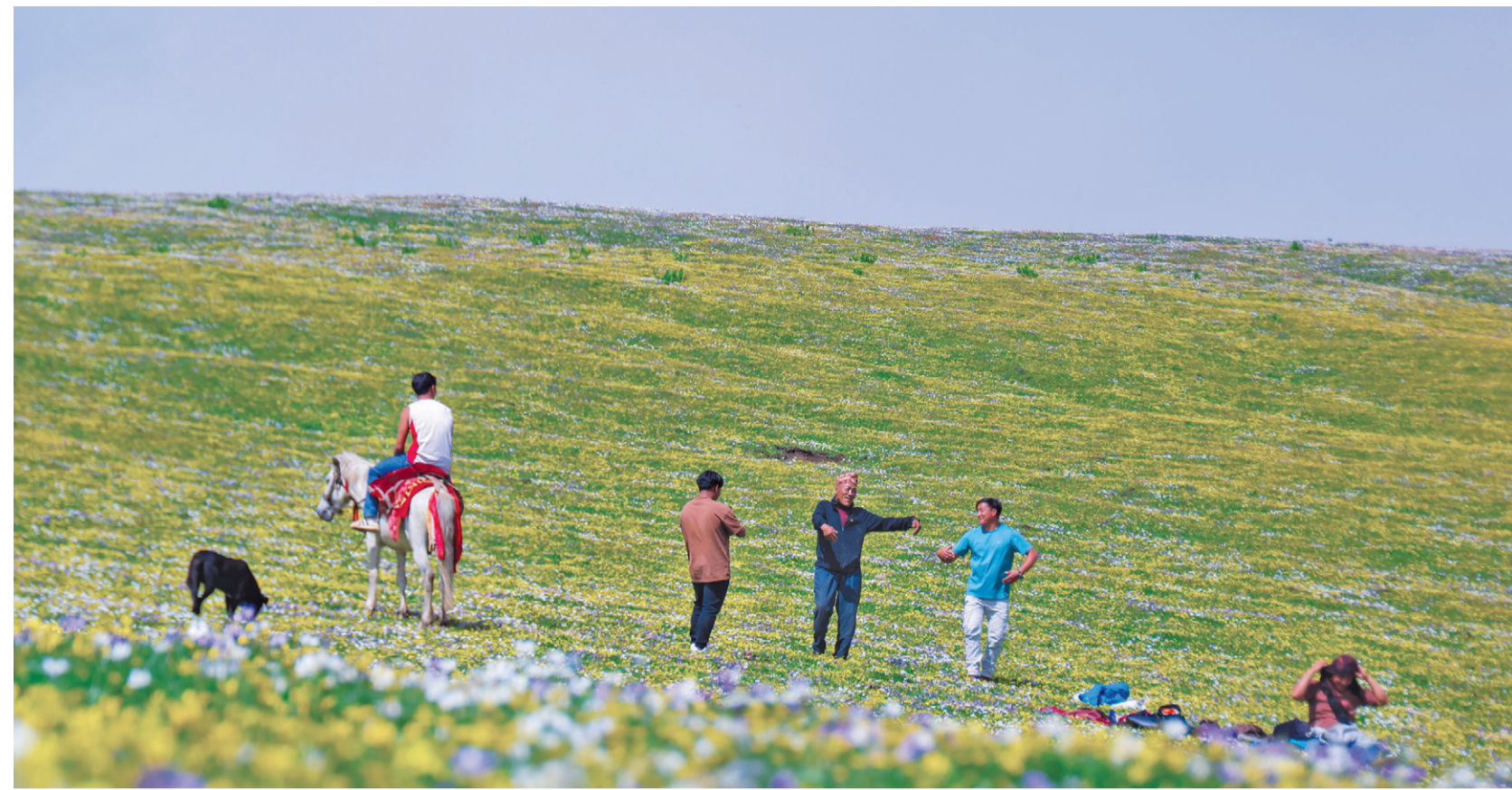
बर्खायमा सुद भएसँगै बुकी फूलहरूले मनमोहक बनेको रूकुम पूर्वको चौरी लेक । यो ठाउँ समुद्री सतहदेखि करिब ४ हजार मिटर उचाइमा छ । मध्यपहाडी राजमार्ग भएर रूकुम पूर्व र बागलुङको सिमाना पातिहल्ले हुँदै करिब आधा घण्टा कच्ची रोडमा यात्रा गरेपछि कोइपा पुगिन्छ । त्यहाँबाट साढे १ घण्टा पैदल हिंडेपछि चौरी लेक पुग्न सकिन्छ ।