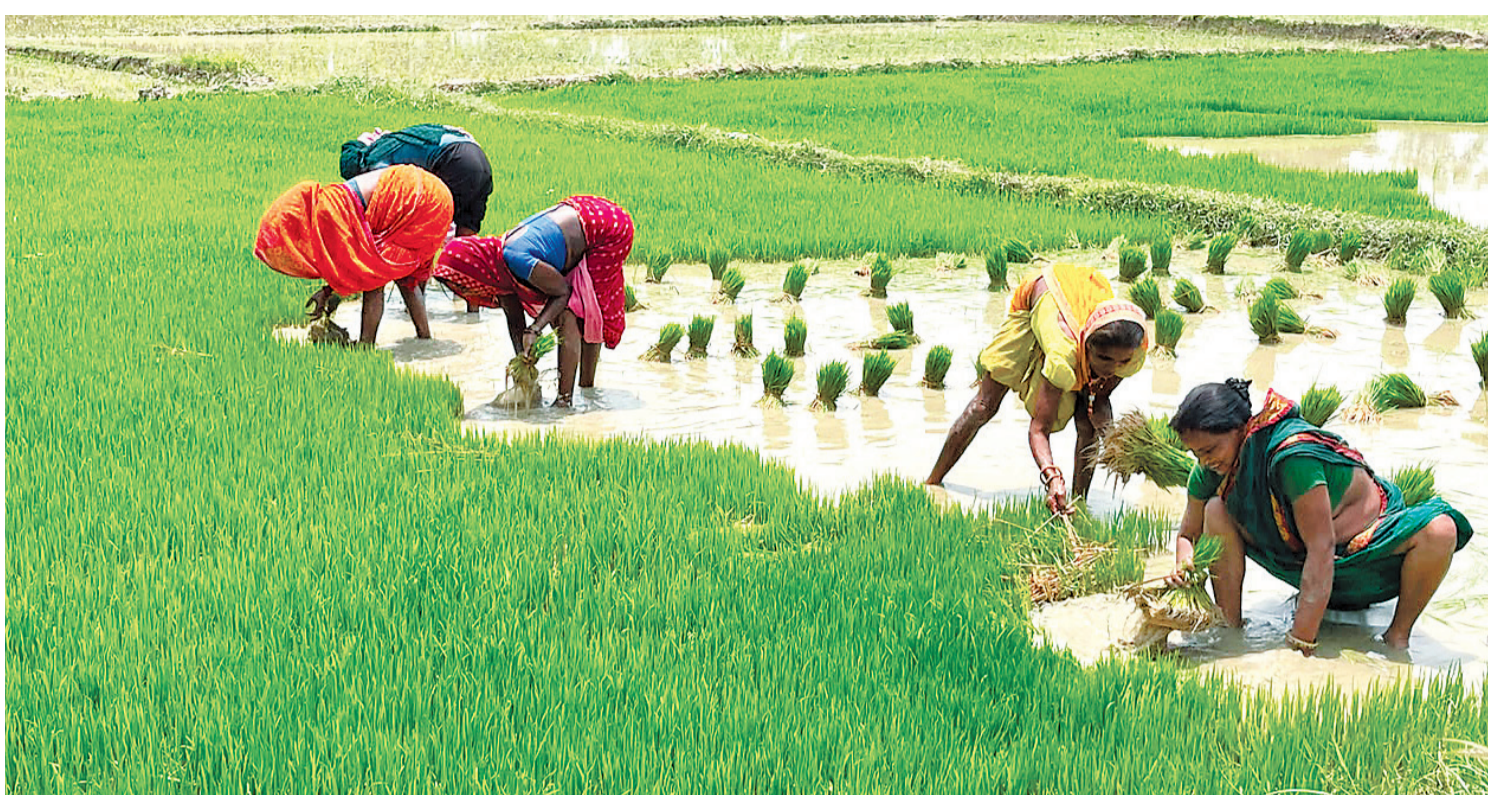
सन्तरीमा रोपाईंको तयारीमा किसान।

पाल्पाको नवौँ उपत्यकाका फाँटमा ४० प्रतिशत खेतमा रोपाईं भइसकेको छ। ६ हजार रोपनीभन्दा बढी धान रोपाईं हुने फाँटमा रोप्न बाँकी रहेकाको २० असारभित्र रोपाईं सक्ने उनी बताउँछन्। यही फाँटमा रोपाईं गर्ने किसानलाई भने हरेक वर्ष सिँचाइ र रासायनिक मलकै पिरलो हुन्छ। तानसेन