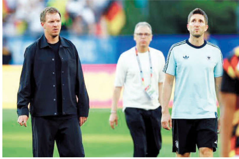
पाराग्वेसँग पराजित भएपछि निराश मुद्रामा जर्मनीका प्रशिक्षक जुलियन नागेल्समन (दायाँ)।

खेलमा गरेको तीन गोल र थप दुई गोलमा गरेको सहयोगी भूमिकालाई बढाउन सकेनन्। नागेल्समनको किन पनि आचोचना गरिएको छ भने फरवार्ड निक वोल्टमेडलाई पनि मौका दिएनन्। उनलाई पाराग्वेसिंह अतिरिक्त समयमा मैदानमा प्रवेश त गराइएको थियो, तर त्यतिबेला पर्याप्त समय नै बाँकी थिएन। जर्मनीका लागि टाइडरकरमा तीन खेलाडी पेनाल्टीमा चुकेका थिए। त्यसमा एक यिनै वोल्टमेड पनि थिए। प्रतियोगिताअगाडि नागेल्समनको दाबी थियो, जर्मनीको उद्देश्य विश्वकप उपाधि जित्नु नै हो। तर यो दाबी भुटो वाचाभन्दा बढी केही रहेन। त्यसो विश्वकप जित्ने दाबीलाई न्याय गर्न खालको प्रदर्शन नै जर्मन टिमबाट भएन। यसपल्टको विश्वकपमा जर्मनीले चार खेल खेलेकामा दुई जित मात्र निस्केको थियो, त्यो पनि डेब्यू गरिरहेको कुरासाथै र आइभोरी कोस्टविरुद्ध।