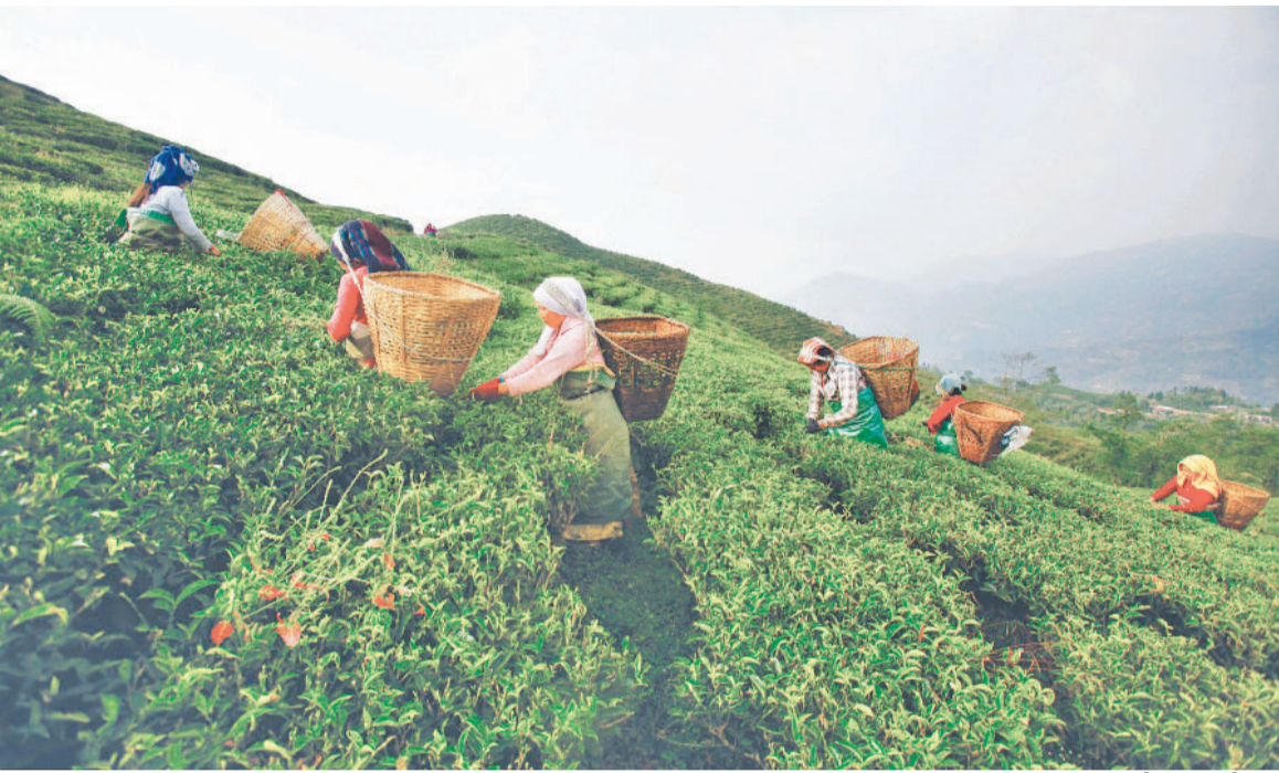
फाइल तस्वीर : कान्तिपुर