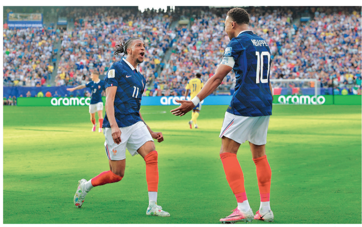
स्विडेनविरुद्ध गोल गरेपछि माइकल ओलिससँग खुसी साट्टै फ्रान्सका केलियन एम्बापे।

एफपी (लस एन्जलस) विश्वकप २०२६ सुरु हुनु अगाडि नै फ्रान्सको छवि सम्भावित च्याम्पियन टिमको थियो। अहिलेसम्मको प्रदर्शनमा आधारमा भन्दा फ्रान्सको परिचय त्योभन्दा माथिको बनेको छ। फ्रान्सको स्तर नै माथिल्लो स्तरमै देखिएको छ। फ्रान्सको अहिलेसम्मको यस्तो प्रदर्शन पछाडि कप्तान केलियन एम्बापेको सानदार गोल जति जिम्मेवार छ। माइकल ओलिसको सिर्जनात्मक खेलले पनि उत्तिकै ठूलो भूमिका खेल्नसकेको छ। प्रशिक्षक डेविड्यर डेसचाम्पले पछिल्ला केही वर्षमा अनेक प्रकारको परीक्षण गरेका छन्। अन्ततः यी प्रशिक्षक आफ्ना खास केही प्रमुख खेलाडीहरू चुनिएका छन्। तिनलाई उनले महत्वपूर्ण जिम्मेवारी दिएका छन्। फ्रान्सको फीर एफएट उपधि जित्ने धोको यिनै आक्रामक खेलाडीले पूरा गर्न सकेका छन्। प्रतियोगिता जति-जति अगाडि बढ्ने छ, को कहाँ भन्ने समीकरण फेरिदि जानेछ र नयाँ पनि बन्न सकेछ। अहिलेसम्म फ्रान्सको प्रदर्शन वास्तवमै अरूको तुलनामा धेरै अगाडि छ। यसमा ओलिसले गाढा छाप छोड्ने काम गरिरहेका छन्। न्यु जर्सीमा अन्तिम ३२ को बृधवार भएको खेलमा फ्रान्सले स्विडेनमाथि सजिलै ३-० ले विजय नतिजा निकाल्यो। फ्रान्सले प्रस्तुत गरेको फुटबल आफैमा रोमाञ्चक रह्यो। अहिलेसम्म खेलका चार खेलमा विजयी फ्रान्सले १३ गोल गरिसकेको छ। अब अन्तिम १६ मा फ्रान्सको भेट पाराग्वेसँग हुनेछ। फ्रान्सले अहिलेसम्म गरेका गोलमा ओलिसको नाम भने छैन, तर स्विडेनविरुद्ध गरेको दुई गोलपछि एम्बापेको यस विश्वकपमा कूल गोलसंख्या नै ६ पुगिसकेको छ। त्यस खेलमा एक अर्को गोल ब्राइली बाकोलाले गरेका थिए। यस्तै बालोन डी'अर विजेता ओसमन डेबेलेले ४ र डिजायर डोउले एक गोल गरेका छन्। यति भन्दाभन्दै पनि स्विडेनविरुद्ध ओलिसको खेल अबल रह्यो। फ्रान्सका गोलमध्ये दुईमा उनको