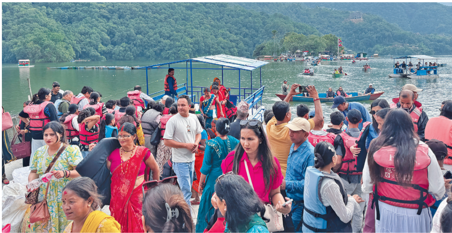
पोखराको फेवाताल घुम्न आएका पर्यटक ।

नेपालमा एकदेखि पाँचतासेसम्मका ३ सय ५० होटल सञ्चालनमा, १६ हजार ६ सय १३ कोठा र २६ हजार २ सय ८५ बेड