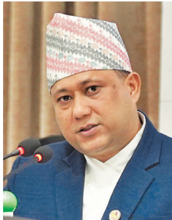
परराष्ट्रमन्त्री शिशिर खनाल

प्रधानमन्त्री शाहले राजदूत तथा नेपाल भ्रमणमा आउने विदेशी उच्च अधिकारीसँगको प्रत्यक्ष भेटघाटलाई सीमित गरेर लामो समयदेखि चल्दै आएको कूटनीतिक अभ्यासमा केही क्रमबद्ध गरेका छन् । तर नेपालको परराष्ट्र नीतिको मूल प्राथमिकता उस्तै छ । काठमाडौंको कूटनीतिको केन्द्रमा अझै पनि भारत र चीनसँगको सम्बन्ध नै छ । परराष्ट्रमन्त्री शिशिर खनालले दुवै छिमेकी मुलुकको भ्रमण गरी नयाँ सरकारले उनीहरूको संबेदनशीलतालाई सम्मान गर्ने सन्देश दिनमा विशेष जोड दिएका छन् ।