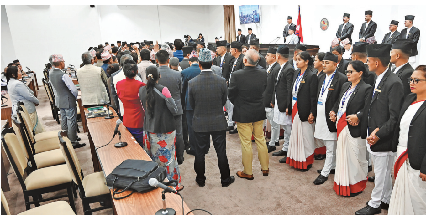
प्रतिनिधिसभा बैठकमा प्रतिपक्षी दलले गरेको विरोध।

सरकारले आह्वान भइसकेको संसद् अधिवेशन स्थगन गर्न लगाएर आठ अघ्यादेश ल्यायो, जुन ठूलो