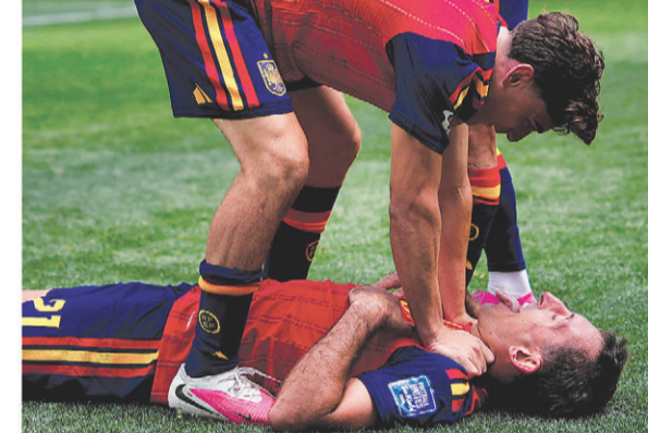
अस्ट्रियाविरुद्ध दुई गोल गरेका स्पेनका मिक्ले ओयारजाबलको खुसी साट्टै गाम्भी।