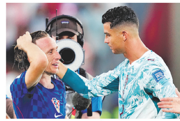
क्रोएसियाका लुका मोड्रिचलाई सान्ताना दिँदै पोर्चुगलका किटियातो रोनाल्डो। उनीहरू एक समयका रियल म्याड्रिडका प्रिय साथी हुन्।