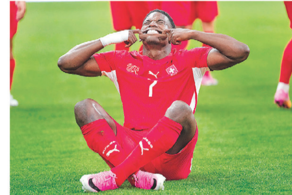
अल्जेरियाविरुद्ध गोल गरेपछि स्विट्जरल्याण्डका ब्रिन् इम्बोलो खुसी मनाउने शैली।