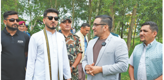
धनगढीमा प्रस्तावित फाल्गु क्रिकेट रंगशाला निरीक्षण गर्दै पूर्वाधारमन्त्री सुनील लम्साल।