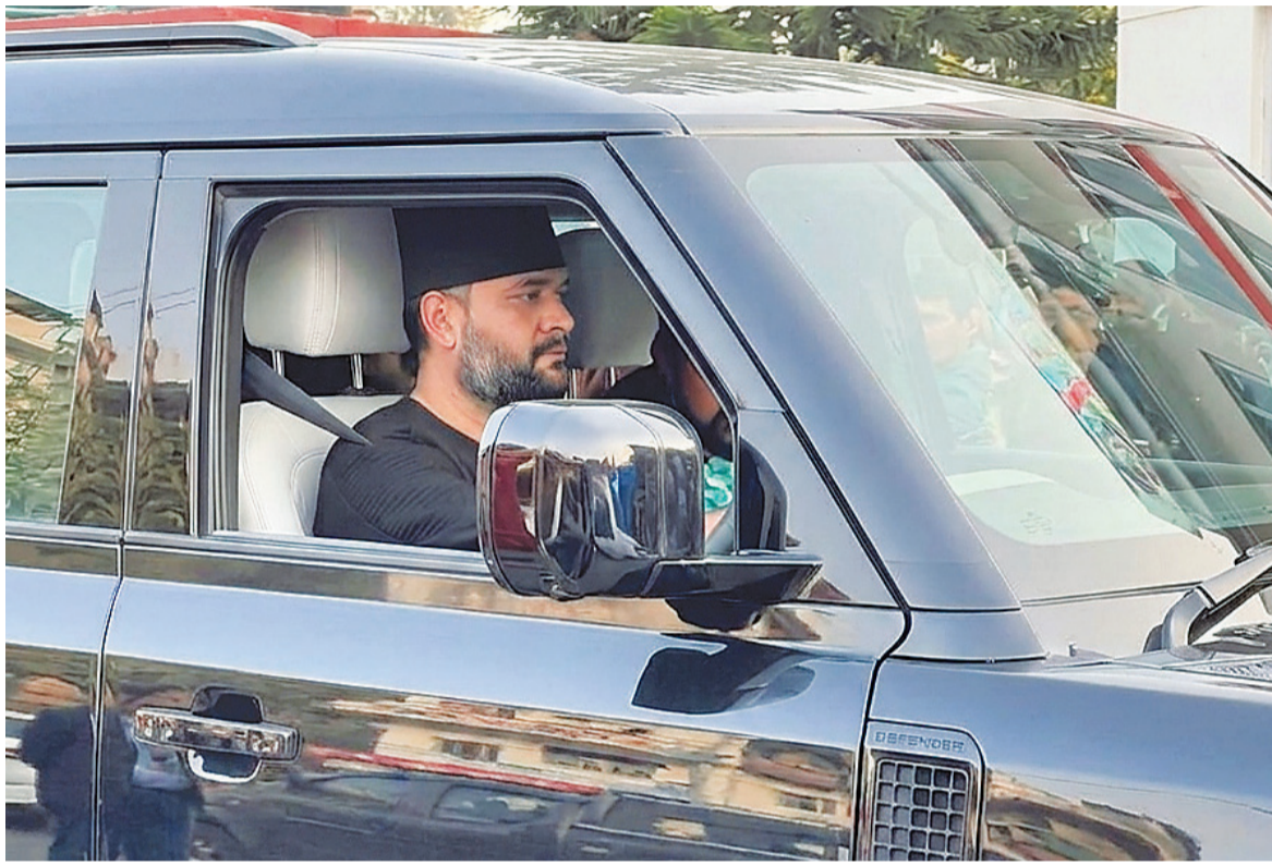
प्रधानमन्त्री वालेन्द्र शाह २१ फागुनको चुनावअघि भ्रमणमा ।

साँझ उनका सल्लाहकारले सामाजिक सञ्जालमा लेखे, 'स्वास्थ्यका कारण प्रधानमन्त्री संसद् बैठकबाट बाहिरिनुभएको हो ।' तर, केही समयपछि त्यो पोस्ट डिलिट भयो । यो प्रकरण केही दिनसम्म सदन र सञ्जाल दुवैतिर 'राष्ट्रिय बहस' को विषय बन्यो । तर, प्रधानमन्त्रीले लिएको निर्णयबाट सरकारले जवाफ दिनुपर्ने वा