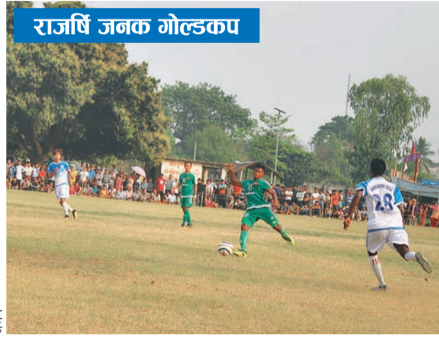
राजर्षि जनक गोल्डकप