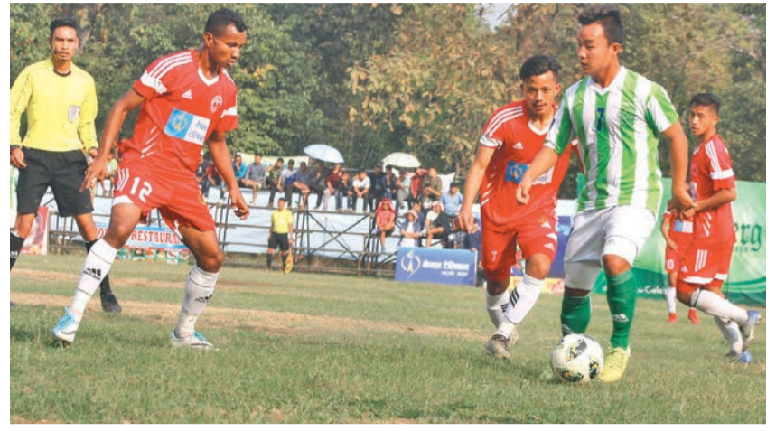
बुटवलको मानवज्ञान माविको मैदानमा बिहीबार भिड्दै नेपाल पुलिस र मनाङ्कका खेलाडी।