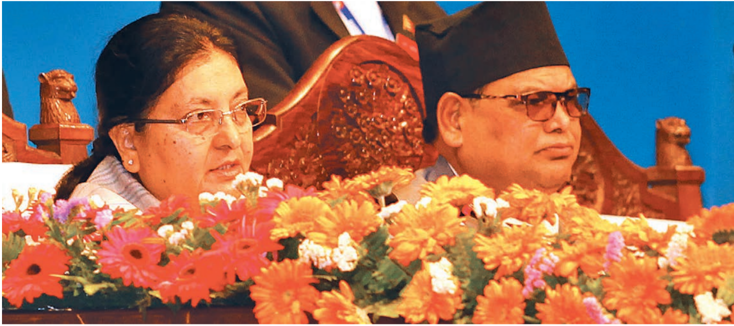
संघीय संसद्को संयुक्त बैठकलाई बिहीबार सम्बोधन गर्दै राष्ट्रपति विद्यादेवी भण्डारी। साथमा सभामुख कृष्णबहादुर महारा।