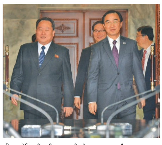
दक्षिण कोरियाली एकीकरण मन्त्री चो म्युङ-ग्युन (दायाँ) र उनका उत्तर कोरियाली समकक्षी री सन ग्वान विहीबार दुई देशको सीमाक्षेत्र पन्मुन्जोममा।

सोल (बीबीसी/रोयटर्स)- उत्तर र दक्षिण कोरियाबीच आगामी अप्रिल २७ गते शिखर वार्ता हुने भएको छ। दुई देशका शीर्ष नेताबीच १० वर्षपछि वार्ता हुन लागेको हो। दुई देशले संयुक्त रूपमा विहीबार जारी गरेको विज्ञापनमा उत्तर कोरियाली सर्वोच्च नेता किम जोङ-उन र दक्षिण कोरियाली राष्ट्रपति मुन जाय-इनबीच दुई देशको सीमाक्षेत्र पन्मुन्जोममा वार्ता हुने उल्लेख छ। विहीबार दुई देशका अधिकारीबीच भएको वार्तापछि उक्त मिति तय भएको दक्षिण कोरियाली सञ्चारमाध्यमले जनाएका छन्। उत्तर कोरियाली नेता किमले चीनका राष्ट्रपति सी चिनफिङसँग वेइजिङमा भेटवार्ता गरेको भोलिपट्टि शिखर वार्ताको मिति घोषणा गरिएको हो। उक्त भेटमा किमले आफू कोरियाली द्वीपमा परमाणु निःशस्त्रीकरणका लागि आफू तयार रहेको बताएका थिए। केही साताअघि उत्तर कोरियाली नेता किमको वार्ताप्रस्ताव अमेरिकी राष्ट्रपति डोनाल्ड ट्रम्पले स्वीकार गरिसकेका छन्। दुई नेताबीच आगामी मे महिनामा वार्ता हुने जनाइए पनि मिति भने हालसम्म तय गरिएको छैन। उत्तर र दक्षिण कोरियाली प्रतिनिधिमण्डलले दुई कोरियाबीच अप्रिल २७ को शिखर वार्ता 'शान्ति गाउँ' का नामले प्रख्यात पन्मुन्जोममा हुने बताए। विहीबार आयोजित पत्रकार सम्मेलनमा उत्तर कोरियाली प्रतिनिधि प्रमुख री सन ग्वानले 'दुई कोरियाबीच विगत ८० वर्षयताकै सम्बन्ध सुमधुर भएको' बताएका छन्।