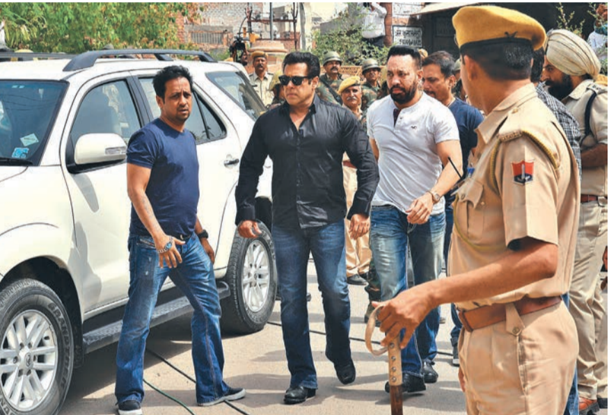
बलिउड अभिनेता सलमान खान (बायाँबाट दोस्रो) राजस्थानको जोधपुर अदालतमा विहीवार सुनुवाइमा सहभागी हुने क्रममा। सन् १९९८ मा एउटा फिल्म छायांकनका क्रममा लोपोन्मुख वन्यजन्तु कालो हरिणको अवैध सिकार गरेको अभियोगमा अदालतले बीस वर्षपछि उनलाई पाँच वर्ष जेल-सजाय सुनाएको छ। सलमानलाई जोधपुरको सेन्ट्रल जेलमा राखिएको छ।