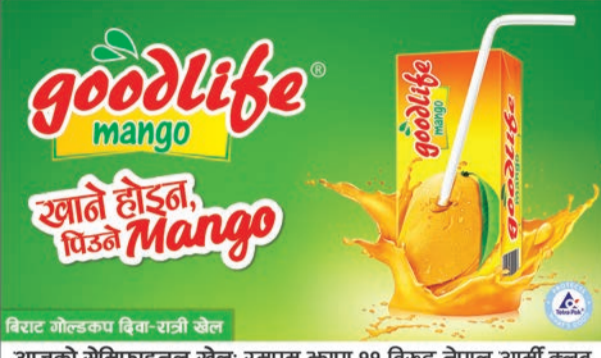
विराट गोल्डकप विज-रात्री खेल आजको सेमिफाइनल खेल: रमपम कापा ११ विरुद्ध नेपाल आर्मी क्लब