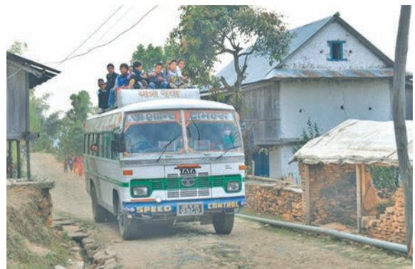
धरानबाट धनकुटाको हिले, तेह्रथुमको वसन्तपुर हुँदै संबुवासभाको सिद्धपोखरी यात्रु लिएर आएको बस।