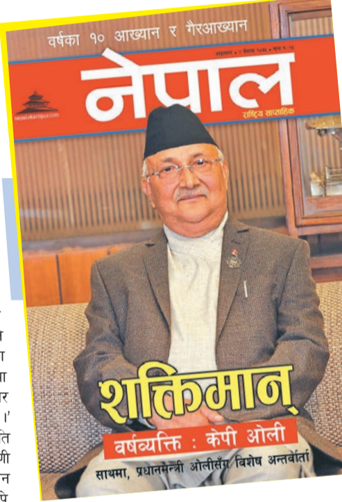
शक्तिमान् व्यक्ति : केपी ओली साभामा, प्रधानमन्त्री ओलीसँग विशेष अन्तर्वार्ता

कारणहरू छन् । अनुचित काम नगरी राष्ट्रिय स्वामिमान उठाएर मित्रता गर्न खोजेको हो ।’ आफूले अघिल्लो प्रधानमन्त्रीकालमा आशंकारहित, अविश्वाससहित र सम्मानपूर्ण सम्बन्ध बनाउन खोजेको, आन्तरिक मामिलामा हस्तक्षेप नगर्न आग्रह गरेको भन्दै त्यसैका कारण सरकार परिवर्तनसम्मका गतिविधि भएको खुलाए । ‘मैले त्यसवेला पनि छिमेकीसँग आशंकारहित, अविश्वाससहित र सम्मानपूर्ण सम्बन्ध बनाउन खोजे,’ उनले थपे, ‘मसँग