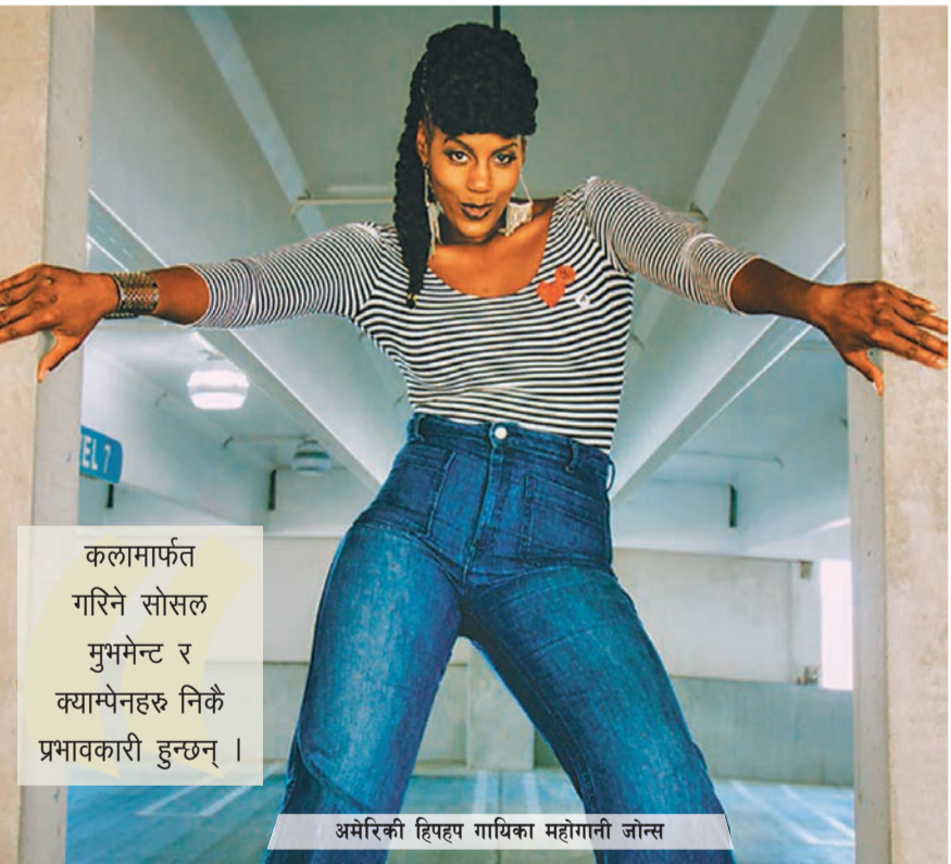
कलामार्फत गरिने सोसल मुभमेन्ट र क्याम्पेनहरू निकै प्रभावकारी हुन्छन्।