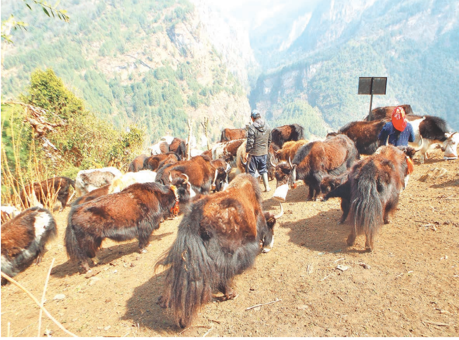
मनाङ नासोड ४ ओडारगाउँका एक किसान करिब दुई हजार मिटर उचाइमा चौरी चराउँदै । चार हजार मिटरभन्दा माथि पल्लिने चौरी कम उचाइमा पनि पाल्न सुरु गरिएको छ ।

हाल संघीय संरचनाअनुसार प्रदेशस्तरीय औद्योगिक क्षेत्रको विकासको तयारी भएको हो । उक्त औद्योगिक क्षेत्रमा साना, मझौला र ठूला उद्योग स्थापना गर्ने योजना सरकारको छ । सबै औद्योगिक क्षेत्रमा प्रत्यक्ष र अप्रत्यक्ष गरी कम्तीमा २० लाखले रोजगारी पाउने दावी सरकारको छ । हालका औद्योगिक क्षेत्रमा करिब १५ हजारजनाले रोजगारीको अवसर पाएका छन् । करिब ८ सयवटा उद्योग सञ्चालनमा छन् । ती उद्योगमा २० अर्ब रुपैयाँभन्दा बढी लगानी छ ।