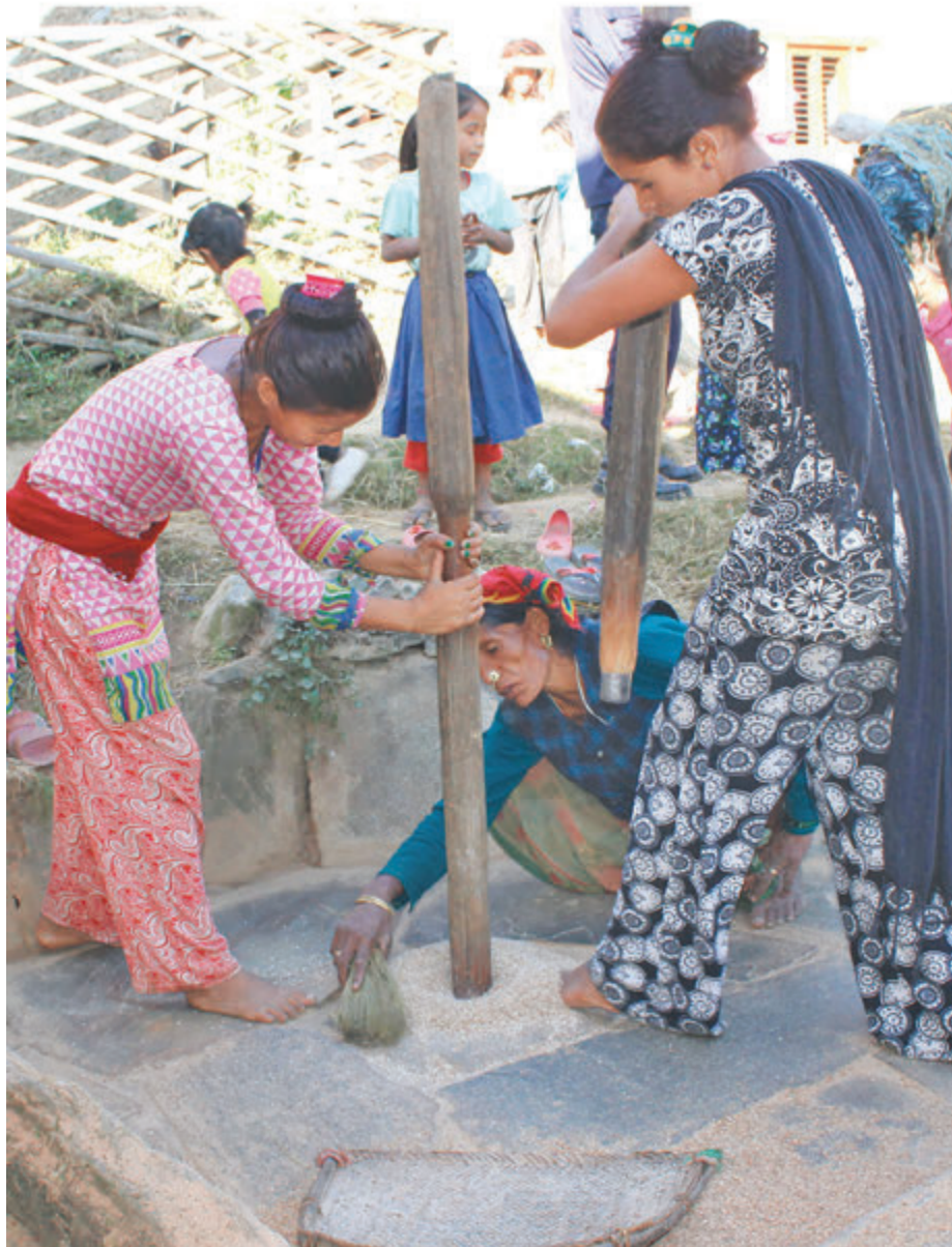
जाजरकोट कुशे गाउँपालिकाको घरगामा मुल्लामा धान कुट्दै स्थानीय महिला ।