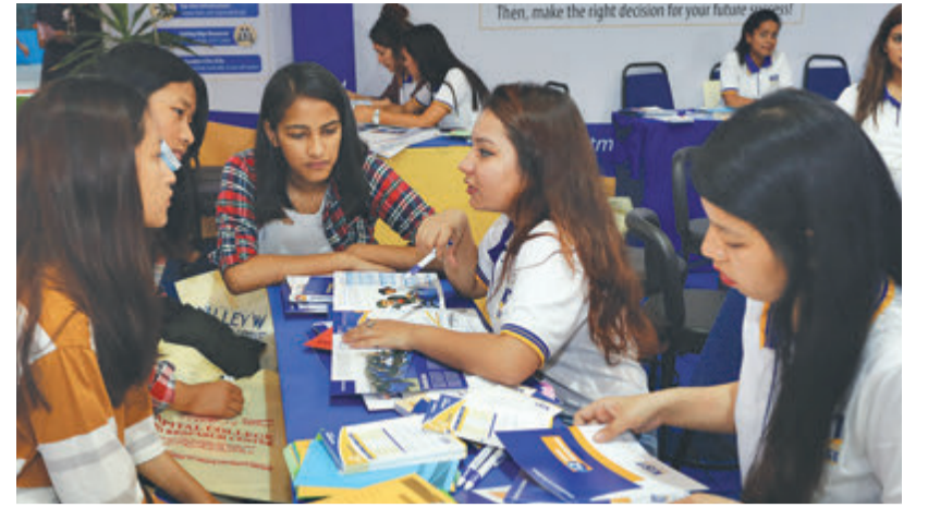
राजधानीको भूकट्टीमण्डपमा जारी पाँचौँ कान्तिपुर हिसान शैक्षिक मेलामा परामर्श लिँदै विद्यार्थी।