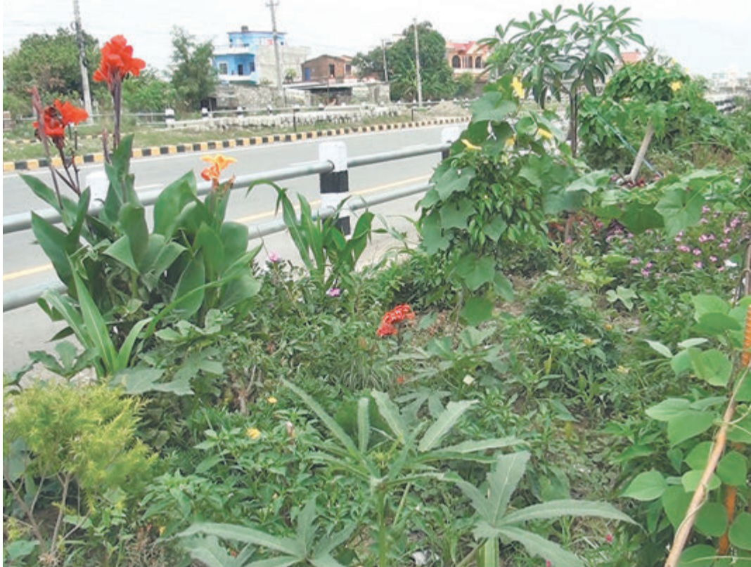
फुलबारीसहितको रूपन्देहीको बेलहिया बुटवल व्यापारिक मार्गको तिलोत्तमा खण्ड ।

कृषि, पर्यटन, संस्कृति र पूर्वाधार विकासका ठूलोला आयोजना सञ्चालित छन् । वजेट विनियोजनका हिसाबले राष्ट्रिय गौरवका २ र अर्बभन्दा बढी लगानीका १५ वटा आयोजना यहाँ चलेका छन् । तेस्रो मुलुकबाट बुद्ध जन्मस्थल लुम्बिनी आउने पर्यटकलाई सैधो ल्याउने योजनासहित गौतमबुद्ध अन्तर्राष्ट्रिय विमानस्थल बन्दै छ । एसियाली विकास बैंकको ऋण सहयोग ६ अर्ब २२ करोड ५१ लाखमा विमानस्थल निर्माण थालिएको हो । सन् २०१५ को