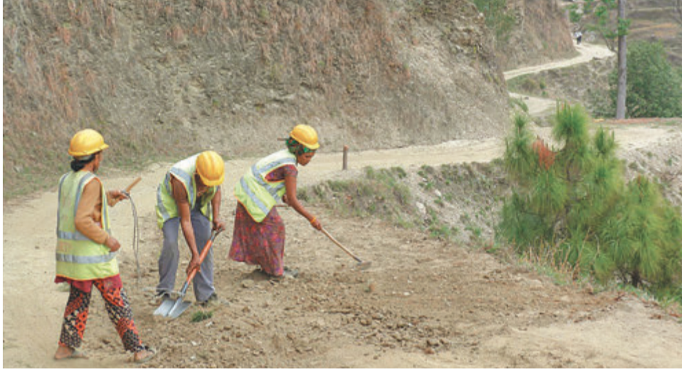
गुल्मीको धुर्कोट गाउँपालिका केन्द्र जोड्ने सडकमा काम गर्दै कामदार ।

४१ सहायक राजमार्ग, ८०५ किमि कालोपत्रे, २८९ किमि ग्रामेल र ६२४ किमि कच्ची सडक