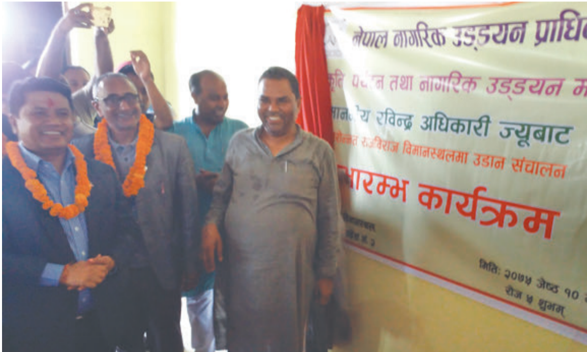
लामो समयदेखि बन्द रहेको राजविराज विमानस्थलमा पक्की धावनमार्गसहितको संरचना निर्माण भएपछि नियमित उडान कार्यको शुभारम्भ गर्दै पर्यटनमन्त्री रवीन्द्र अधिकारी, फोरम अध्यक्ष उपेन्द्र यादव र पूर्वपर्यटनमन्त्री जितेन्द्रनारायण देव ।