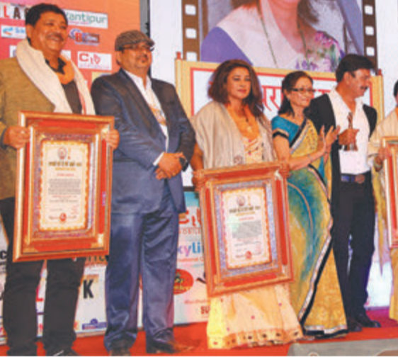
राजधानीमा बिहीबार आयोजित डी सिने अवाडमा पुरस्कृत कलाकारहरू लगायत ।