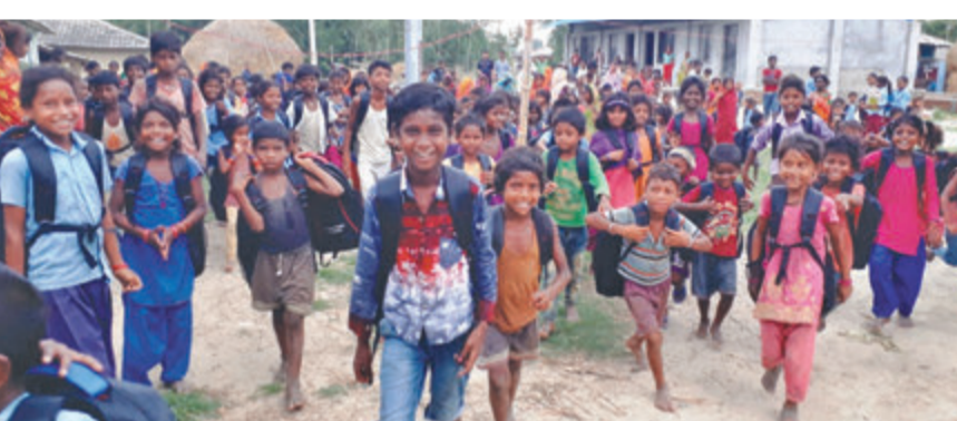
महोत्तरीको गौशाला नगरपालिका-७ स्थित मन्हरवाको आधारभूत विद्यालयबाट घर फर्कंदै गरेका मुसहर बालबालिका।

महोत्तरी (कास)- गौशाला नगरपालिका ७ मन्हरवास्थित नेपाल राष्ट्रिय जनजाति प्राथमिक विद्यालयमा अध्ययनरत मुसहर बालबालिकामा विहीवार बेग्लै खुसी देखियो। शैक्षिक सामग्रीसहितको भोला पाएपछि उनीहरू मन्हरवा परे। धुमसु-सुन्तली फाउन्डेसनले विपन्न समुदायका बालबालिकालाई शैक्षिक सामग्रीसहितको भोला वितरण गरेको थियो। भोला नहुँदा बालबालिका हातमै किताब च्यापेर विद्यालय जानुपर्ने बाध्यतामा थिए। अब किताब, कापी पनि सुरक्षित हुने उनीहरूले बताए।