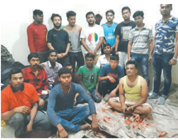
दोहाको मुग्लिनमा रहेका पीडित ।

आजाद भिसाको फाइदावारे उनलाई दलालले कण्ठस्यै बनाइदिए, 'न्यूनतम तलब १२ सय रियाल (करिब ३३ हजार रुपैयाँ) भन्दा माथि हुन्छ । कम्पनी छगीछुगी मन लागेको काम गर्न पाइन्छ । कसैको दबावमा बस्नु पर्दैन ।'