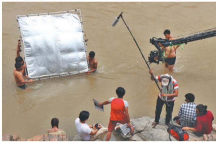
पाल्पाको तानसेन १३ बौघागुम्हामा कालीगण्डकी तटमा फिल्म 'रानीमहल' को छायाँकन गरिँदै ।