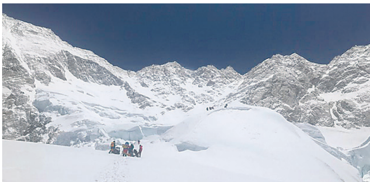
ताप्लेजुङको कञ्चनजंघा हिमाल आरोहण प्रयासमा आरोहीहरू।