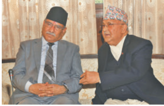
नेपाल कम्युनिस्ट पार्टीको विहीवार बसेको केन्द्रीय समिति बैठकमा अध्यक्षद्वय केपी ओली र पुष्पकमल दाहाल।

काठमाडौं- प्रधानमन्त्री एवं नेकपा अध्यक्ष केपी ओलीले अन्तरिम व्यवस्था भएकाले एकीकृत पार्टीको कार्यसमितिमा ३३ प्रतिशत महिलाको संख्या नपुगेको बताएका छन्। दुई वल मिलेर बनेको ४ सय ४१ सदस्यीय कार्यसमितिमा महिलाको संख्या ३३ प्रतिशत नपुगेको र यो राजनीतिक दलसम्बन्धी ऐनको समेत प्रतिकूल हुने भन्दै प्रश्न उठेपछि ओलीले विहीवार केन्द्रीय समिति बैठकमा यसबारे स्पष्ट पारेका हुन्। नेकपाको कार्यसमितिमा हाल ७३ जना महिला छन्।