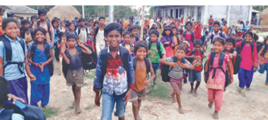
महोत्तरीको गौशाला नगरपालिका-७ स्थित मन्हरवाको आधारभूत विद्यालयबाट घर फर्कंदै गरेका मुसहर बालबालिका।

महोत्तरी (कास)- गौशाला नगरपालिका ७ मन्हरवास्थित नेपाल राष्ट्रिय जनजाति प्राथमिक विद्यालयमा अध्ययनरत मुसहर बालबालिकामा विहीवार बेग्लै खुसी देखियो। शैक्षिक सामग्रीसहितको भोला पाएपछि उनीहरू मन्हरवा परे। धुमस-सुन्तली फाउन्डेसनले विपन्न समुदायका बालबालिकालाई शैक्षिक सामग्रीसहितको भोला वितरण गरेको थियो। भोला नहुँदा बालबालिका हातमै किताब च्यापेर विद्यालय जानुपर्ने बाध्यतामा थिए। अब किताब, कापी पनि सुरक्षित हुने उनीहरूले बताए।