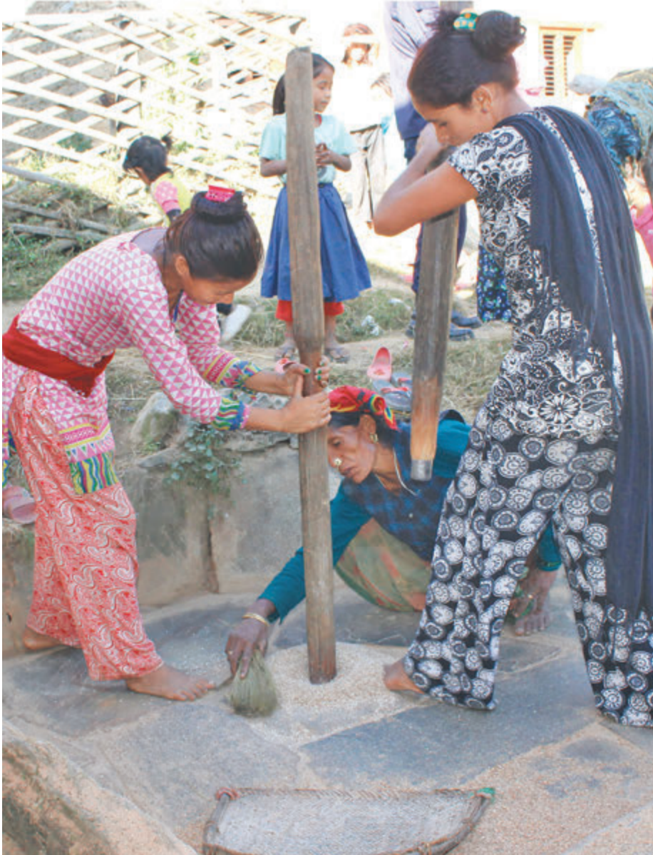
जाजरकोट कुशे गाउँपालिकाको घरगामा मुल्लामा धान कुट्दै स्थानीय महिला।

पुँजी वृद्धिको निर्देशन जारी हुँदा बढाउने उनीहरूको भनाइ छ।