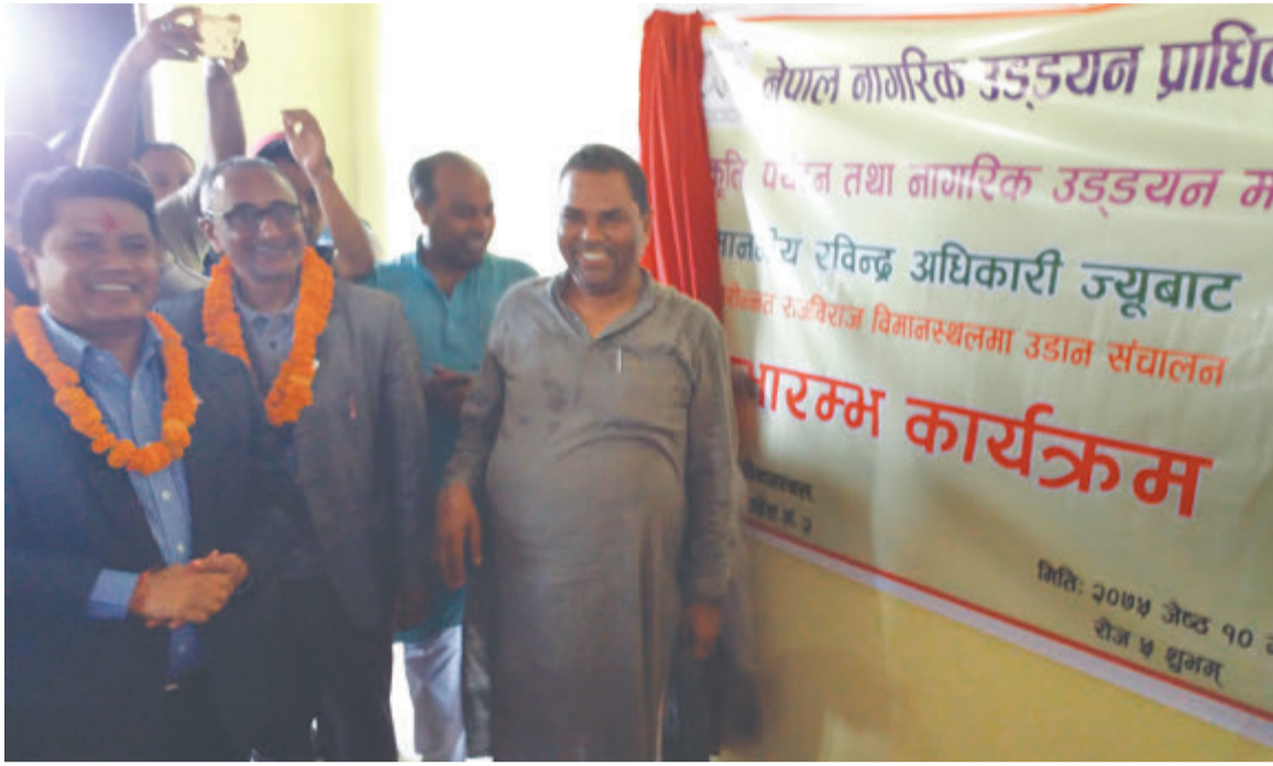
लामो समयदेखि बन्द रहेको राजविराज विमानस्थलमा पक्की धावनमार्गसहितको संरचना निर्माण भएपछि नियमित उडान कार्यको शुभारम्भ गर्दै पर्यटनमन्त्री रवीन्द्र अधिकारी, फोरम अध्यक्ष उपेन्द्र यादव र पूर्वपर्यटनमन्त्री जितेन्द्रनारायण देव।