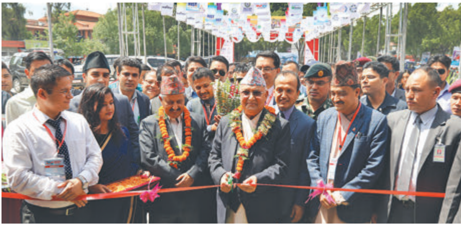
राजधानीको भूकट्टीमण्डपमा जारी पाँचौँ कान्तिपुर हिसान शैक्षिक मेलाको उद्घाटन गर्दै प्रधानमन्त्री केपी ओली।

विद्यार्थीलाई उनीहरूको रूचि र क्षमताअनुसारको विषय पढ्न दिनुपर्ने उनको भनाइ थियो। 'कुनै विद्यार्थी फेल हुँदैन, जुनतारा टिप्पला भनेर हिममतमाथि असफलताको विल्ला भिराएर बन्चो प्रहार गरिन्छ,' उनले भने, 'विद्यार्थीलाई रूचिको विषय पढ्न दिनुपर्छ।' इच्छाअनुसार नेपाली युवायुवतीले