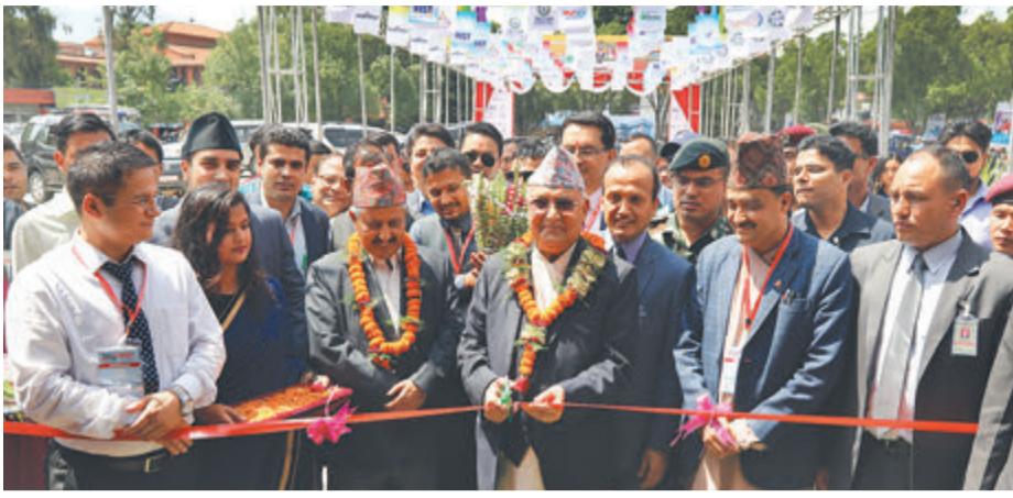
राजधानीको भूकट्टीमण्डपमा जारी पाँचौँ कान्तिपुर हिसान शैक्षिक मेलाको उद्घाटन गर्दै प्रधानमन्त्री केपी ओली।

विद्यार्थीलाई उनीहरूको रूचि र क्षमताअनुसारको विषय पढ्न दिनुपर्ने उनको भनाइ थियो। 'कुनै विद्यार्थी फेल हुँदैन, जुनतारा टिपूला भनेर हिम्मतमाथि असफलताको वित्ता भिराएर बन्चो प्रहार गरिन्छ,' उनले भने, 'विद्यार्थीलाई रूचिको विषय पढ्न दिनुपर्छ।' इच्छाअनुसार नेपाली युवायुवतीले