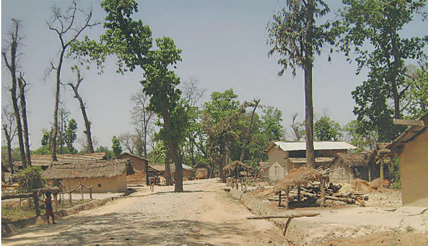
कैलालीको वसन्ता जैविकमार्गमा निर्माण गरिएका घरटहरा ।