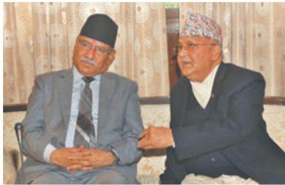
नेपाल कम्युनिस्ट पार्टीको विहीवार बसेको केन्द्रीय समिति बैठकमा अध्यक्षद्वय केपी ओली र पुष्पकमल दाहाल।

काठमाडौं- प्रधानमन्त्री एवं नेकपा अध्यक्ष केपी ओलीले अन्तरिम व्यवस्था भएकाले एकीकृत पार्टीको कार्यसमितिमा ३३ प्रतिशत महिलाको संख्या नपुगेको बताएका छन्। दुई वल मिलेर बनेको ४ सय ४१ सदस्यीय कार्यसमितिमा महिलाको संख्या ३३ प्रतिशत नपुगेको र यो राजनीतिक दलसम्बन्धी ऐनको समेत प्रतिकूल हुने भन्दै प्रश्न उठेपछि ओलीले विहीवार केन्द्रीय समिति बैठकमा यसबारे स्पष्ट पारेका हुन्। नेकपाको कार्यसमितिमा हाल ७३ जना महिला छन्।