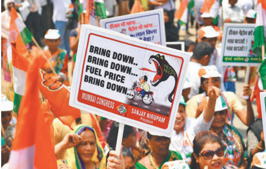
भारतमा हालै गरिएको इन्धनको मूल्य वृद्धिको विरोधमा मुम्बईमा बिहीबार गरिएको प्रदर्शन ।