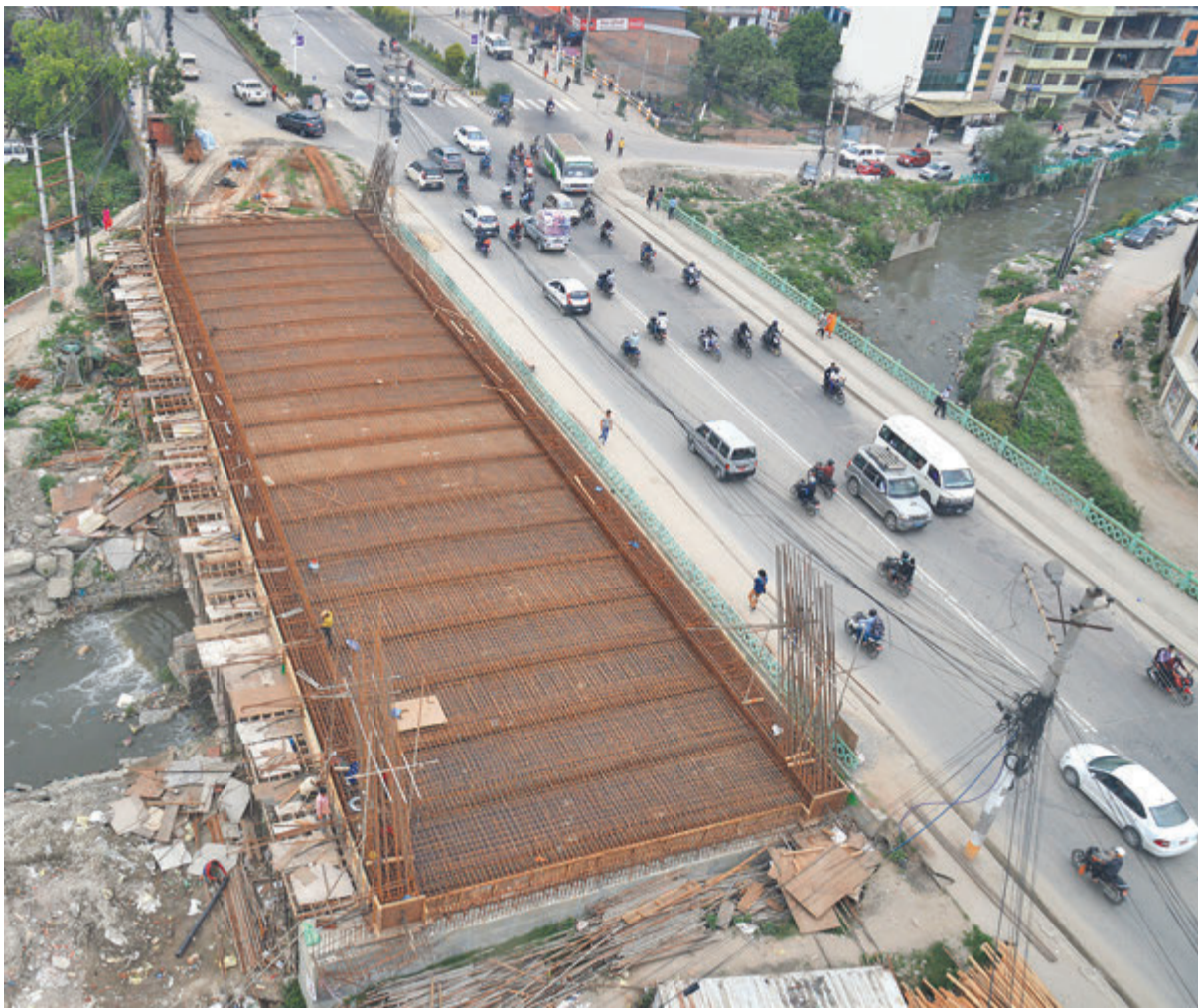
राजधानीको माइतीघर-नयाँबानेश्वर खण्डको विजुलीबजारमा निर्माणधीन आर्क नेटवर्क ब्रिज । सरकारले ट्राफिक जाम कम गर्ने तथा सहरी सौन्दर्य बढाउने उद्देश्यले २०७२ साल पुस १३ गते आर्क नेटवर्क ब्रिजको ठेक्का अघि बढाएको हो । ठेकेदार कम्पनी जेई कन्स्ट्रक्सनका कारण पुल निर्माणमा ढिलाइ भइरहेको छ । सम्भौताअनुसार गत पुस १३ गते निर्माण सम्पन्न गरिसक्नुपर्थ्यो ।