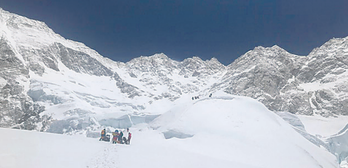
ताप्लेजुङको कञ्चनजंघा हिमाल आरोहण प्रयासमा आरोहीहरू।