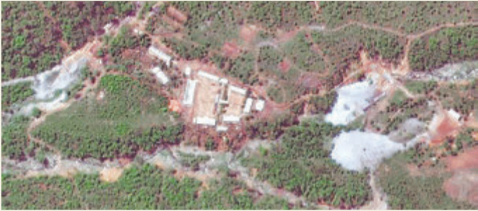
उत्तर कोरियाले विहीवार नष्ट गरेको पुङ्गो-रीस्थित परमाणु परीक्षण केन्द्र ।

समाचार संस्था रोयटर्सका अनुसार उत्तर कोरियाले पहिले भनेजस्तो स्वतन्त्र पर्यवेक्षकहरूलाई भने परीक्षण स्थलमा जान दिइएको छैन । सुरुङहरू विभिन्न देशबाट परीक्षण केन्द्र पुगेका २० पत्रकारहरूको सामुने ध्वस्त पारिएको हो । २० मध्ये ८ पत्रकार दक्षिण कोरियाका छन् ।