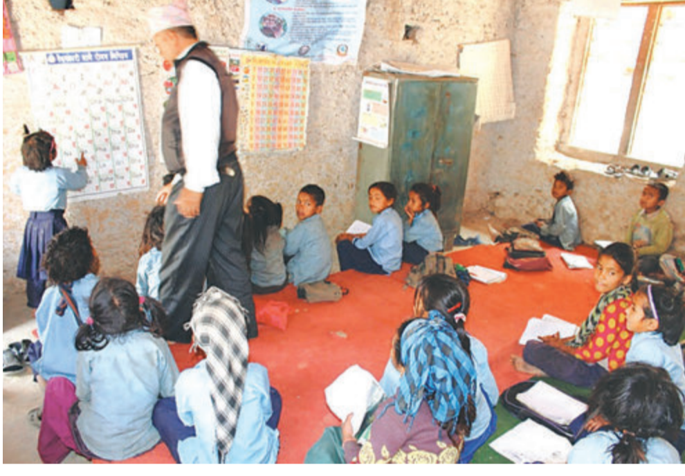
जाजरकोटको नलगाड नगरपालिका १३, बाइकाडास्थित दलित प्राविमा पढाइ हुँदै ।