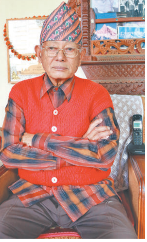
अहिलेको साहित्यमा संस्कृति छैन