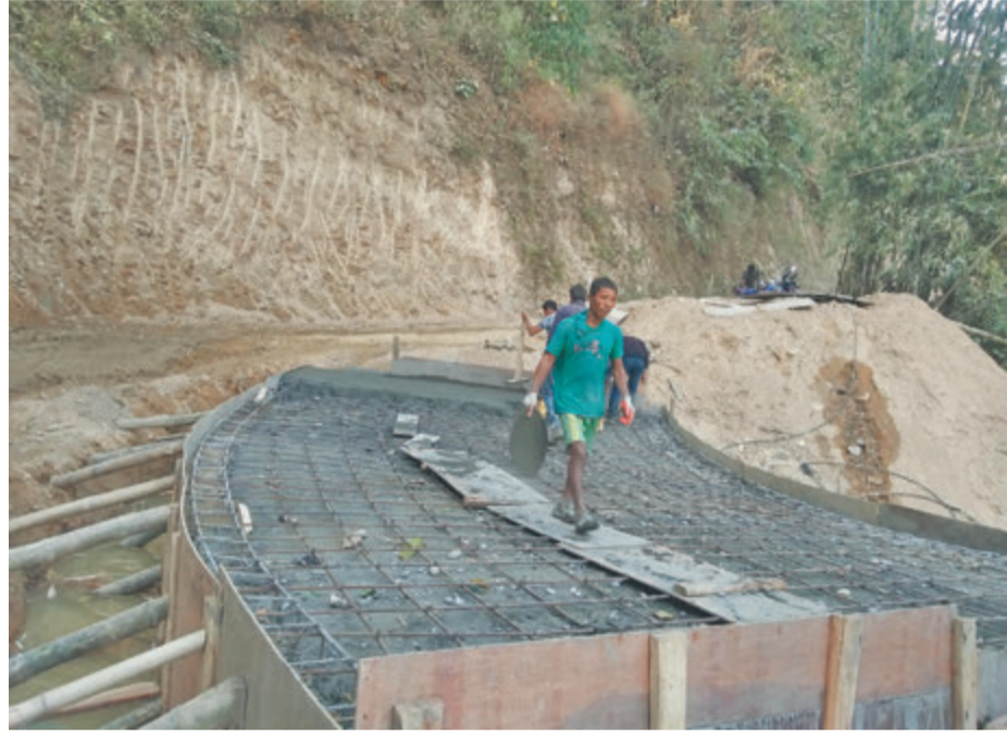
इलामको सोयाकमा सडक निर्माणमा जुटेका कामदार । डेनिस सरकारको सहयोगमा निर्माणाधीन यो सडकको काम सुस्त हुँदा समयमै पूरा नहुने देखिएको छ ।