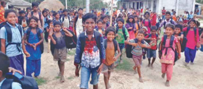
महोत्तरीको गौशाला नगरपालिका-७ स्थित मन्हरवाको आधारभूत विद्यालयबाट घर फर्कंदै गरेका मुसहर बालबालिका।

महोत्तरी (कास)- गौशाला नगरपालिका ७ मन्हरवास्थित नेपाल राष्ट्रिय जनजाति प्राथमिक विद्यालयमा अध्ययनरत मुसहर बालबालिकामा विहीवार बेग्लै खुसी देखियो। शैक्षिक सामग्रीसहितको भोला पाएपछि उनीहरू मन्ध्र परे। धुमस-सुन्तली फाउन्डेसनले विपन्न समुदायका बालबालिकालाई शैक्षिक सामग्रीसहितको भोला वितरण गरेको थियो। भोला नहुँदा बालबालिका हातमै किताब च्यापेर विद्यालय जानुपर्ने बाध्यतामा थिए। अब किताब, कापी पनि सुरक्षित हुने उनीहरूले बताए।