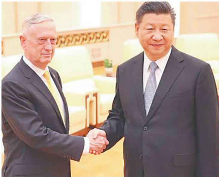
अमेरिकी रक्षामन्त्री जेम्स म्याटिस र चिनियाँ राष्ट्रपति सी चिनफिङ वेइजिङमा बिहीबार भेटवार्ता गर्दै।

भेटका क्रममा सीले ‘चीनको शान्ति कायम राख्ने अभिप्राय रहेको तर चिनियाँ जमिनको रक्षा गर्नका लागि कुनै कसर बाँकी नराख्ने’ बताए। ‘चीनले आफ्ना पुर्खाले दिएको एक इन्च भूभाग गुमाउन चाहन्न’, चिनियाँ सञ्चारमाध्यममा प्रकाशित सीको भनाइलाई बीबीसीले उल्लेख गरेको छ, ‘हामीलाई अन्य