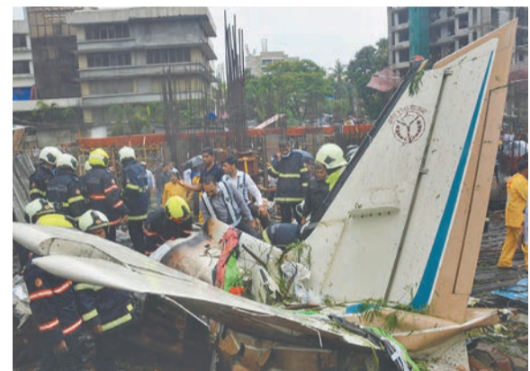
भारतको मुम्बईमा भएको विमान दुर्घटनामा खटिएका उद्धारकर्मी।

मुम्बई (एएफपी)- भारतको आर्थिक राजधानी मुम्बईमा बिहीबार भएको जहाज दुर्घटनामा ५ को मृत्यु भएको छ। मृत्यु हुनेमा जहाजमा रहेका ४ र एक पैदलयात्रु छन्।