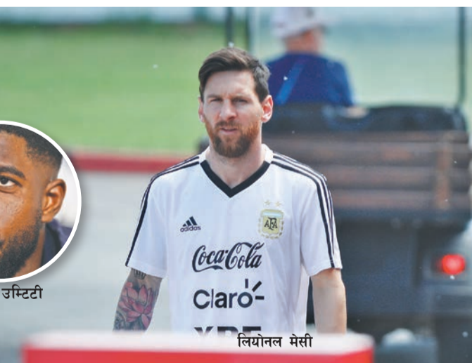
सामुइल उम्टिटी (बायाँ) र लियोनल मेसी (दायाँ)

इस्ट्रा (रोयटर्स)- अर्जेन्टिनालाई विश्वकप अन्तिम १६ मा उक्लिने फ्रान्सको आशा लियोनल मेसीमा भर पर्न सक्छ । तर मेसीलाई बार्सिलोनाबाट खेल्दा जस्तो साथ राष्ट्रिय टोलीमा नरहने उनकै क्लबका सहपाठी सामुइल उम्टिटीले विहीवार बताएका छन् । फ्रान्सका सेन्टर ब्याक उम्टिटी पछिल्लो दुई सिजन मेसीको सहयात्री रहँदैआएका छन् बार्सिलोनामा । तर शनिवार फ्रान्स र अर्जेन्टिनाबीच निकै प्रतीक्षित खेल हुँदा मेसीको पासमा उम्टिटीले बाधक बन्ने प्रयास गर्नेछन् । डेनमार्कसँगको फ्रान्सको समूह चरणको अन्तिम खेलमा आराम गर्न दिइएका उम्टिटीले कजान एरिनामा अर्जेन्टिनासँग पहिलो रोजाइमा खेल्ने सम्भावना छ । मैले उसलाई प्रत्येक दिन हेरेको छु । उनलाई रोक्नु धेरै कठिन छ । उनीसँग असाधारण क्षमता छ, उम्टिटीले भने, 'हामी उनलाई रोक्