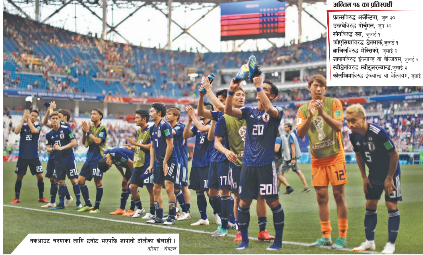
नकआउट चरणका लागि छनोट भएपछि जापानी टोलीका खेलाडी।

यसअघि पोल्यान्डमाथि ३-० को जित निकालेको जोसे पेकरम्यानको टिमलाई सामरामा भाग्यले पनि साथ दियो। जुआन क्विन्टेरो, हामेस रोड्रिगेज र जुआन काइडोले फरवार्ड राडामेल फाल्काओलाई साथ दिएका थिए। रमाडलो रहेको पहिलो हाफको अन्त्यपछि पेकरम्यान चोटका कारण रोड्रिगेजलाई परिवर्तन गरेर लुइस मुरियललाई मैदान पठाउन बाध्य भएका थिए। त्यसपछि सेनेगलले आक्रामक खेलमा प्रतिभा देखाएको थियो तर डेविड ओस्पिनालाई चुनौती दिएर