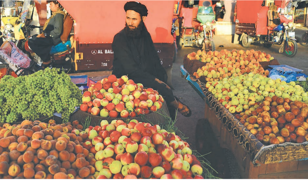
अफगानिस्तानको हेरातमा ग्राहक पखैदै फलफूल व्यापारी ।

लिन सकिन्छ। किनभने ती मुलुकहरूमा आयस्रोत सिर्जना गर्ने अवस्था हुँदैन, अखबारले म्याकाथीललाई उद्धृत गर्दै लेखेको छ, 'विकासित अर्थतन्त्र भएको मुलुकहरूमा भने उद्यमशीलता र सिर्जनशीलताले महत्त्वपूर्ण भूमिका निर्वाह गर्ने गर्छ।' अर्गनाइजेसन फर इकोनोमिक को अप्रेसन एन्ड डेभलपमेन्ट (ओईसीडी) को पछिल्लो प्रतिवेदनले कोलम्बियाका बढी कामदारहरू श्रममा अनौपचारिकता, आम्दानीमा असमानता र गैरनियमित अनुबन्धले दक्षिण अमेरिकी मुलुकहरूलाई गणना गर्न अक्षम बनाएको उल्लेख गरेको छ। युरोपमा प्रिसजस्ता दक्षिणी मुलुकमा उच्चतम स्वरोजगार दर रहेको पाइन्छ, जबकि उत्तरका मुलुकहरूमा खासगरी