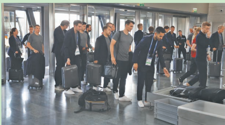
मस्कोस्थित भेनुकोभो विमानस्थलबाट घर फर्केका क्रममा रहेका जर्मन टोलीका खेलाडी ।

कजान (एएफपी)- जर्मनी दोस्रो विश्वकपयता पहिलोपल्ट विश्वकप फुटबलको पहिलो चरणबाटै बाहिरियो । यो शताब्दीमा डिफेन्डिड च्याम्पियन समूह चरणबाटै बाहिरिएको यो चौथोपल्ट हो । उरुग्वेले सन् १९३० मा भएको पहिलो संस्करण जितेको थियो । तर उसले १९३४ को संस्करणका लागि इटालीको यात्रा गरेन । त्यसलाई छोडेर विश्वकपको इतिहासमा छैटौँपल्ट डिफेन्डिड च्याम्पियनको चुनौती पहिलो चरणमै समाप्त भएको हो । पहिलो चरणबाटै बाहिरिएका डिफेन्डिड च्याम्पियन :