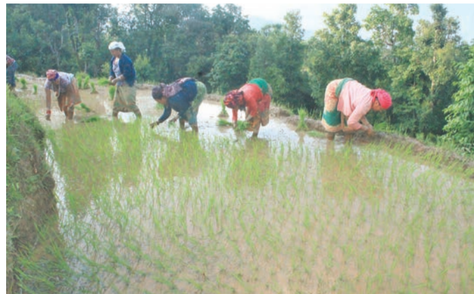
बागलुङको लेखानीमा धान रोप्दै किसान ।