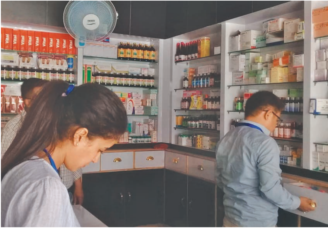
लमजुङको बेंसीसहरका औषधि पसलको अनुगमन गर्दै औषधि व्यवस्था विभागका अधिकारी।

यस्तै, भोलेटार, दुईपीप्ले र रामवजारका ९ पसलमा अनुगमन गरिएकोमा ३ पसल अर्कै व्यक्तिले सञ्चालन गरेका पाइएको थियो। उक्त अनुसार ती पसललाई बन्द गरिएको छ। दुईपीप्लेको एक पसलमा नेपालमा