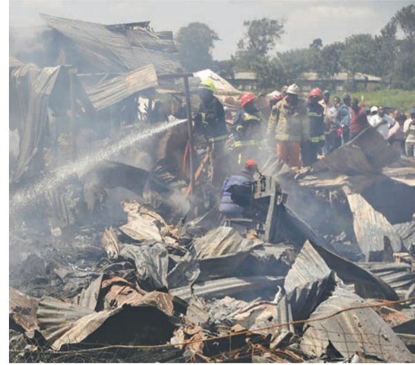
केन्याको राजधानी नैरोबीस्थित गिकोम्बा बजारमा बिहीबार भएको आगलागी नियन्त्रण गरिँदै।

सेन्ट जोन एम्बुलेन्स सेवालार्ड उद्भूत गर्दै बीबीसीले स्थानीय समयअनुसार बुधवार राति २ बजेर ३० मिनेट जाँदा आगलागी फैलिएको उल्लेख गरेको छ। स्थानीय सञ्चारमाध्यमका अनुसार बजारबाट सुरु भएको आगलागी केही क्षणमै