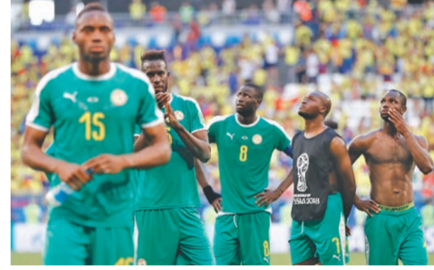
कोलम्बियासँग पराजित भएपछि निराश सेनेगलका खेलाडी ।