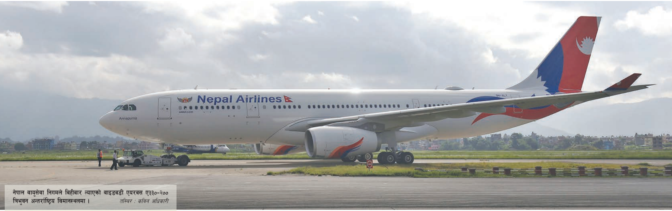
नेपाल वायुसेवा निगमले बिहीबार ल्याएको वाइडबडी एयरबस ए३३०-२०० विमान अन्तर्राष्ट्रिय विमानस्थलमा ।