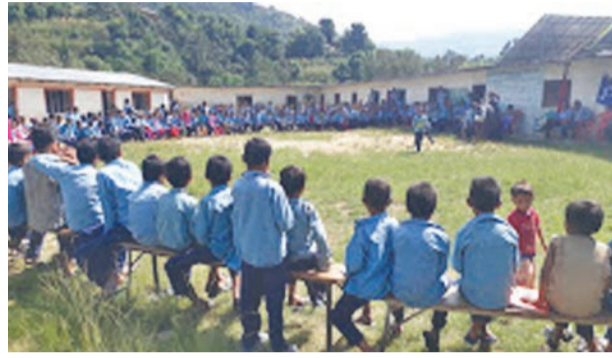
सल्यानको दामा गाउँपालिका-४ भन्वैरको कालिका आधारभूत विद्यालयमा बालबालिका । अभिभावक पनि सँगै विद्यालय जान थालेपछि बालबालिका नियमित उपस्थित हुन थालेका छन् ।

सल्यान- दामा गाउँपालिका-४, भन्वैरस्थित कालिका आधारभूत विद्यालयमा शैक्षिक गुणस्तर कायम गर्न बालबालिकासँगै अभिभावक पनि विद्यालय जाने गरेका छन् । विद्यालयमा उपस्थित नहुने र नियमित पठनपाठनमा ध्यान नदिने शिक्षकलाई अभिभावकले निगरानी गर्न थालेका हुन् । विद्यालयमा उपस्थित नहुने र नियमित पठनपाठनमा ध्यान नदिने शिक्षकलाई अभिभावकले निगरानी गर्न थालेका हुन् । विद्यालयमा उपस्थित नहुने र नियमित पठनपाठनमा ध्यान नदिने शिक्षकलाई अभिभावकले निगरानी गर्न थालेका हुन् ।