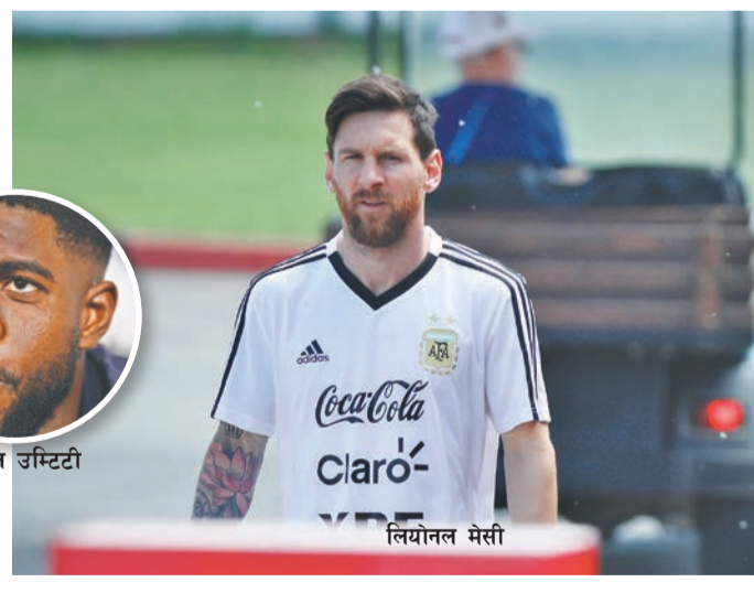
सामुइल उम्टिटी (बायाँ) र लियोनल मेसी (दायाँ)

इस्ट्रा (रोयटर्स)- अर्जेन्टिनालाई विश्वकप अन्तिम १६ मा उक्लिने फ्रान्सको आशा लियोनल मेसीमा भर पर्न सक्छ । तर मेसीलाई बार्सिलोनाबाट खेल्दा जस्तो साथ राष्ट्रिय टोलीमा नरहने उनकै क्लबका सहपाठी सामुइल उम्टिटीले विहीवार बताएका छन् । फ्रान्सका सेन्टर ब्याक उम्टिटी पछिल्लो दुई सिजन मेसीको सहयात्री रहदैआएका छन् बार्सिलोनामा । तर शनिवार फ्रान्स र अर्जेन्टिनाबीच निकै प्रतीक्षित खेल हुँदा मेसीको पासमा उम्टिटीले बाधक बन्ने प्रयास गर्नेछन् । डेनमार्कसँगको फ्रान्सको समूह चरणको अन्तिम खेलमा आराम गर्न दिइएका उम्टिटीले कजान एरिनामा अर्जेन्टिनासँग पहिलो रोजाइमा खेल्ने सम्भावना छ । मैले उसलाई प्रत्येक दिन हेरेको छु । उनलाई रोक्नु धेरै कठिन छ । उनीसँग असाधारण क्षमता छ, उम्टिटीले भने, 'हामी उनलाई रोक्