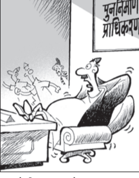
आम्मी नि ! पराक्रमै गा' र'छ ?... म त कसैले भ्रवभ्रका को भट्टारो पो... वास्तै नगरी बस्या त !