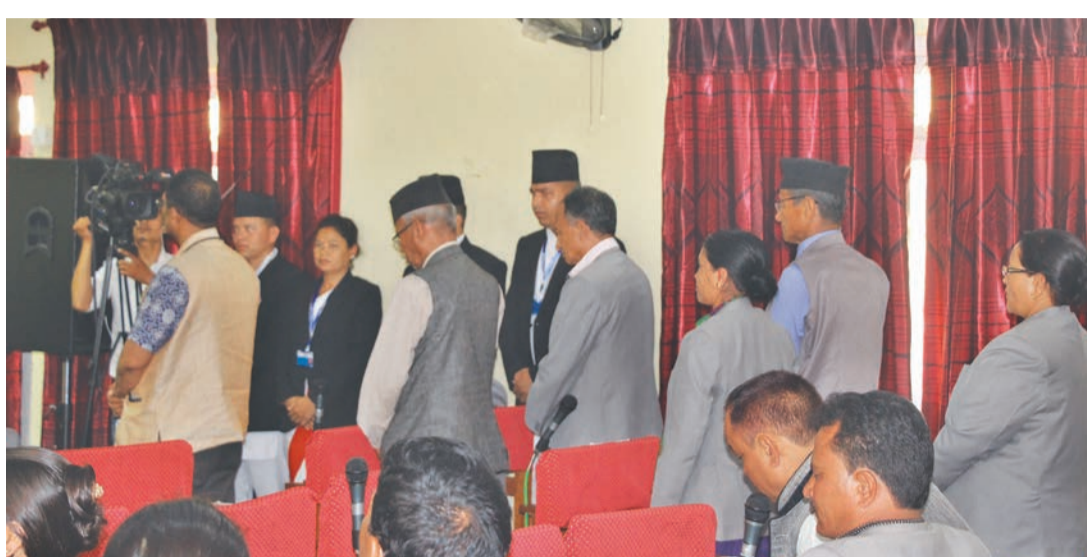
कर्णाली प्रदेशसभाको विहीवारको बैठक अवरोध गर्दै प्रतिपक्षी कांग्रेसका सांसद ।