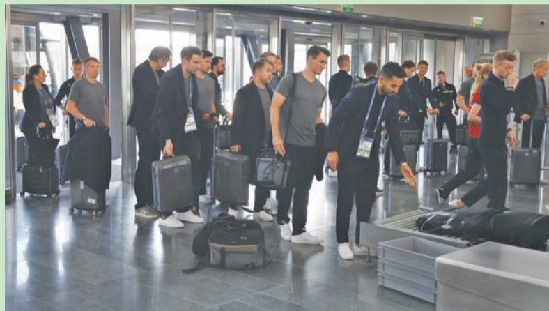
मस्कोस्थित भेनुकोभो विमानस्थलबाट घर फर्केका क्रममा रहेका जर्मन टोलीका खेलाडी ।

कजान (एएफपी)- जर्मनी दोस्रो विश्वकपयता पहिलोपल्ट विश्वकप फुटबलको पहिलो चरणबाटै बाहिरियो । यो शताब्दीमा डिफेन्डिड च्याम्पियन समूह चरणबाटै बाहिरिएको यो चौथोपल्ट हो । उरुग्वेले सन् १९३० मा भएको पहिलो संस्करण जितेको थियो । तर उसले १९३४ को संस्करणका लागि इटालीको यात्रा गरेन । त्यसलाई छोडेर विश्वकपको इतिहासमा छैटौँपल्ट डिफेन्डिड च्याम्पियनको चुनौती पहिलो चरणमै समाप्त भएको हो । पहिलो चरणबाटै बाहिरिएका डिफेन्डिड च्याम्पियन :