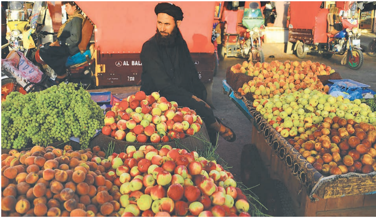
अफगानिस्तानको हेरातमा प्राकृष पखैदै फलफूल व्यापारी ।