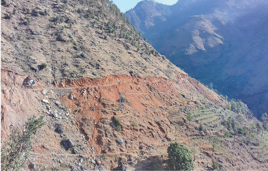
सडकभन्दा तलको सिँचाइ कुलो र खानेपानीमा क्षति पुऱ्याएको निर्माणाधीन बगोरा-आगर सडक खण्ड ।