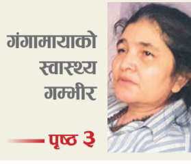
गंगामायाको स्वास्थ्य गम्भीर — पृष्ठ ३