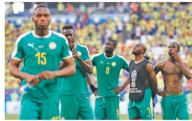
कोलम्बियासँग पराजित भएपछि निराश सेनेगलका खेलाडी ।