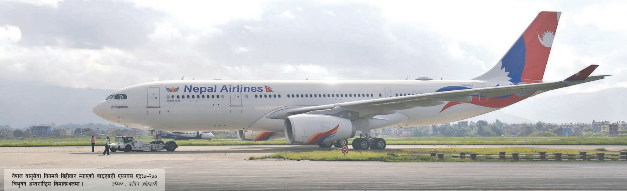
नेपाल वायुसेवा निगमले बिहीबार ल्याएको वाइडबडी एयरबस ए३३०-२०० विमान अन्तर्राष्ट्रिय विमानस्थलमा ।